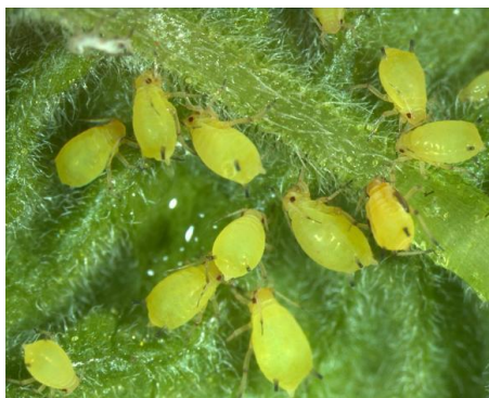
Slika 16. Kolonija lisnih uši

Lisne uši (Sl.16.)su kukci nježnog tijela, veličine svega nekoliko milimetara, imaju 2 para krila sa slabo nervaturom, prednji par znatno veći od zadnjih. Javljaju se forme s krilima i bez krila. Imaju usni ustroj za bodenje i sisanje. Izlučuju mednu rosu i prenosioci su virusa.. Na mednu rosu naseljavaju se gljivice čađavice u to slučaju listovi pocrne što se može odraziti na prinos. Lisne uši naseljavaju mlade listove, imaju veći broj generacija (10-20) tijekom vegetacije, stvaraju kolonije i kod jakog napada lisne uši nalaze se po cijeloj biljci.