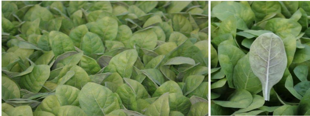
Slika 9. Plamenjača duhana u proizvodnji rasada