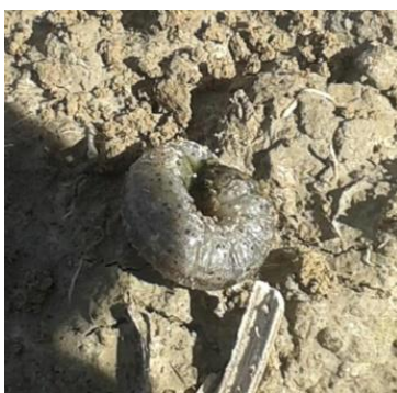
Slika 14. Gusjenica sovice pozemljuše

Imago je noćni leptir s rasponom krila od 3 do 4,5 cm, neupadljivih boja (sive i sivosmeđe) tijekom dana miruju. Na prednjim krilima imaju karakteristične pjege, usni ustroj je za sisanje i lizanje i ne prčinjavaju štetu. Imaju 1- 2 generacije godišnje. Ličinke su gusjenice golog i sjajnog tijela (Sl.14.), zemljane boje, narastu do 45 cm. Na dodir se skupe u krug. Prezimi odrasla ličinka. Danju se skrivaju ispod grudica ili u pukotinama tla, a noću izlaze i hrane se na vratu korijena i prizemnim lišćem. Najštetnije su gusjenice posljednjeg stadija.