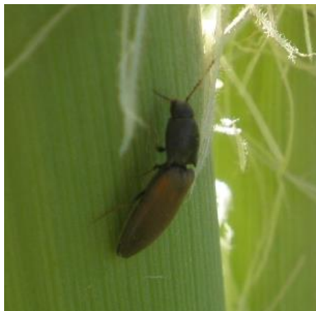
Slika 13. Klisnjak - imago

Imago - klisnjaci su kornjaši tamne boje, uskog i duguljastog tijela veličine od 7-15 mm (Sl.13.). Hrane se na cvjetovima biljaka i ne prave veće štete. Odlažu jaja u površinski sloj tla. Na našim poljima prevladava rod Agriotes .