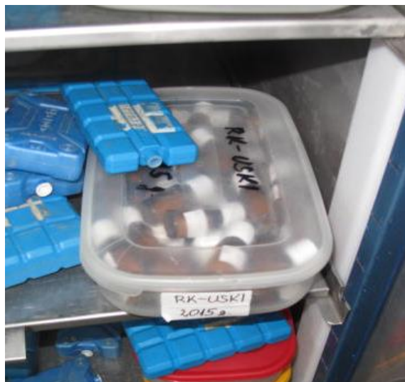
Sl.7. , Zamrzavanje cvjetnog praha u staklenim bočicama

Cvjetni prah u zamrznutom stanju može se čuvati 3-5 godina a da ne izgubi klijavost. Svaka bočica cvjetnog praha označena je svojom etiketom na kojoj piše naziv linije i datum kad je cvjetni prah spremljen. Prilikom odlaska u polje uzima se odgovarajući cvjetni prah i kist uz pomoć kojeg se nanosi na njušku tučka odgovarajućeg cvijeta. Ukoliko je oplodnja izvršena, kroz par dana se može primijetiti da su plodnice cvijeta odebljale. Za sazrijevanje plodnice i sjemena potrebno je oko tri do četiri tjedna, ovisno o vanjskoj temperaturi i količini oborina. Berba zrelih tobolaca duhana obavljena je ručno i tobolci su osušeni u sušnicama za duhan na temperaturi 32°C (sl. 8), tobolci mijenjaju boju do blago smeđe.