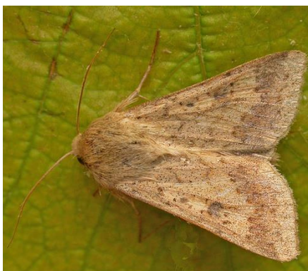
Slika 17. Helicoverpa armigera – žuta kukuruzna sovica

Imago žute kukuruzne sovice (Sl.17.) je noćni leptir sa svijetlosmeđim krilima. Raspon krila je oko 3,5 cm. Periodična, migratorna i polifagna vrsta česta pogotovo u toplijim krajevima. Ima 2-3 generacije godišnje. Prezimi kao kukuljica u tlu, a katkad i na biljkama. Ličinka je gusjenica promjenjive boje od sivozelene do crvenkastosmeđe s tri uzdužne tamnije valovite pruge. Boja varira i s obzirom čime se hrane. Odrasla gusjenica duga je 3-4 cm.