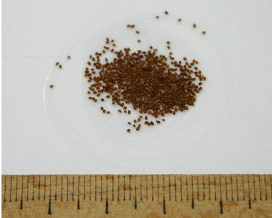
Slika 2. Sjeme duhana