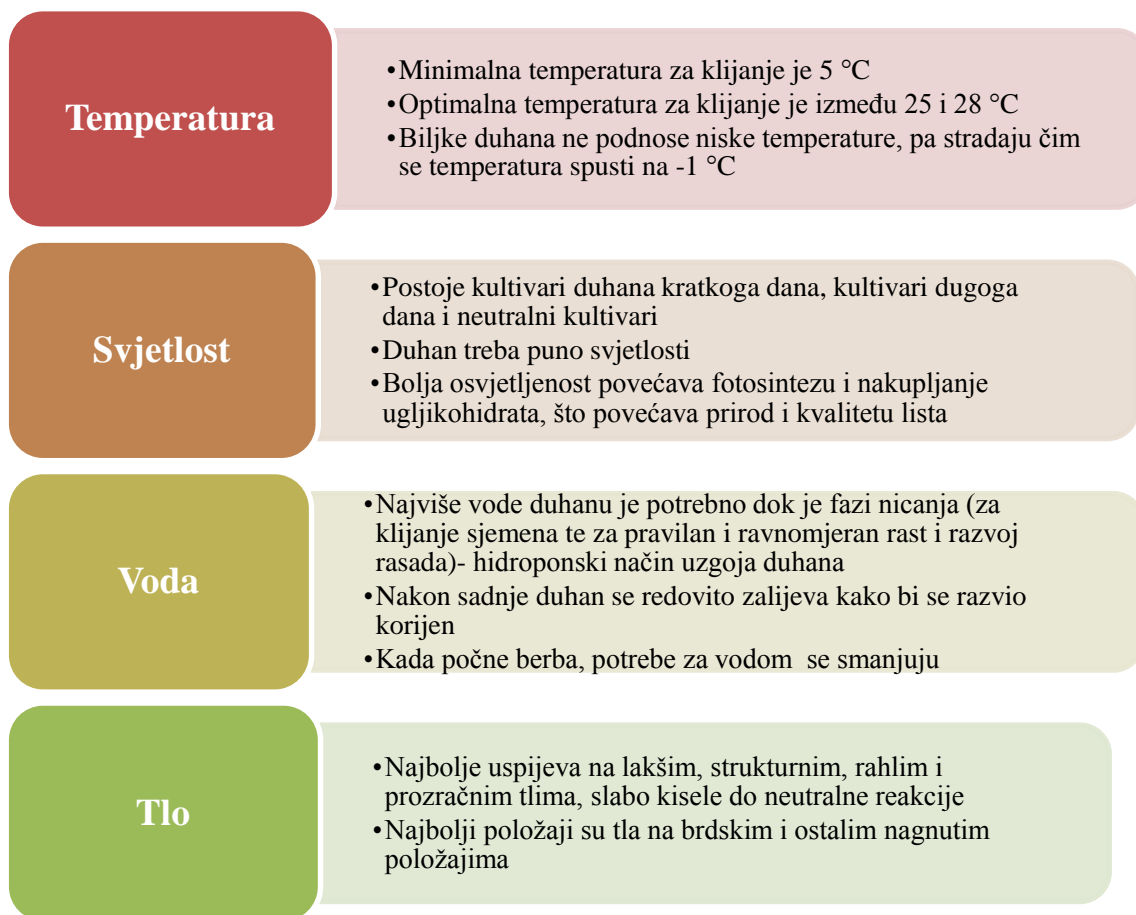
Shema 2. Agroekološki uvjeti proizvodnje duhana