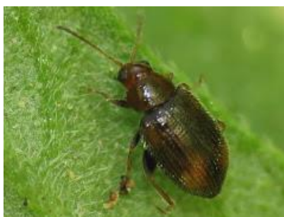
Slika 18. Epitrix hirtipennis – duhanov buhač

Imago, duhanovog buhača je mali kukac, veličine 1,4 – 2,2 mm, crvenkasto smeđe boje, punktiranog pokrivanja (Sl. 18). Kreću se skakanjem, dobri su letači. U Europi otkriven je prvi put 1983. godine.