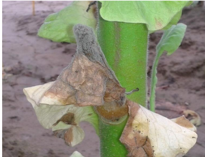
Slika 11. Siva plijesan