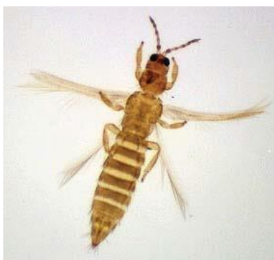
Slika 15. Thrips tabaci – duhanov trips

Imago je s karakterističnim uskim krilima s resama. Malih su dimenzija 0,8 – 1 mm, žute do smeđe boje. Imaju usni ustroj za bodenje i sisanje (Sl.15). Ženke leglicom odlažu jaja u biljno tkivo. Na otvorenom imaju 4 generacije, dok u zatvorenom prostoru mogu se javiti i do 8 generacija godišnje.