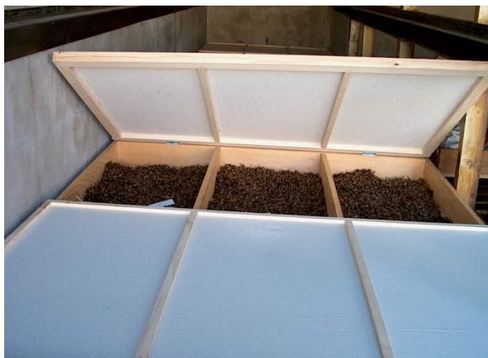
Sl.8. , Sušenje tobolaca u sušnicama za duhan

Cvjetni prah u zamrznutom stanju može se čuvati 3-5 godina a da ne izgubi klijavost. Svaka bočica cvjetnog praha označena je svojom etiketom na kojoj piše naziv linije i datum kad je cvjetni prah spremljen. Prilikom odlaska u polje uzima se odgovarajući cvjetni prah i kist uz pomoć kojeg se nanosi na njušku tučka odgovarajućeg cvijeta. Ukoliko je oplodnja izvršena, kroz par dana se može primijetiti da su plodnice cvijeta odebljale. Za sazrijevanje plodnice i sjemena potrebno je oko tri do četiri tjedna, ovisno o vanjskoj temperaturi i količini oborina. Berba zrelih tobolaca duhana obavljena je ručno i tobolci su osušeni u sušnicama za duhan na temperaturi 32°C (sl. 8), tobolci mijenjaju boju do blago smeđe.