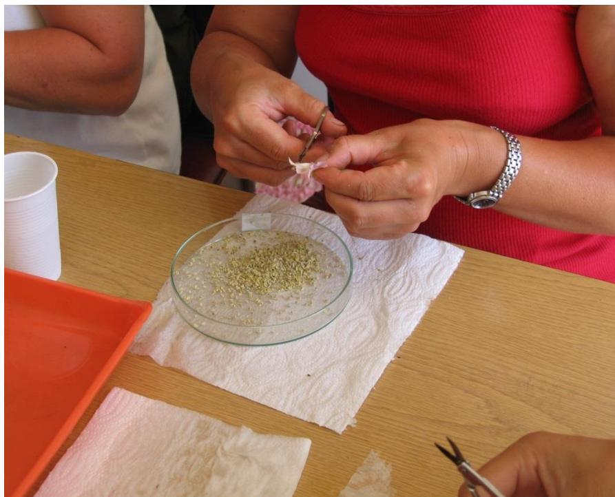
Slika 1. Izdvajanje antera iz cvijeta duhana

Za komercijalnu proizvodnju sjemena u Hrvatskim duhanima koristi se citoplazmatska muška sterilnost (CMS).