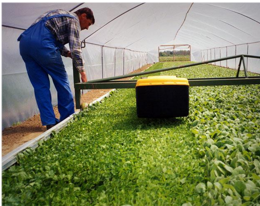
Slika 4. Šišanje rasada duhana