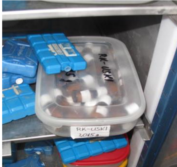
Sl.7. , Zamrzavanje cvjetnog praha u staklenim bočicama

Cvjetni prah u zamrznutom stanju može se čuvati 3-5 godina a da ne izgubi klijavost. Svaka bočica cvjetnog praha označena je svojom etiketom na kojoj piše naziv linije i datum kad je cvjetni prah spremljen. Prilikom odlaska u polje uzima se odgovarajući cvjetni prah i kist uz pomoć kojeg se nanosi na njušku tučka odgovarajućeg cvijeta. Ukoliko je oplodnja izvršena, kroz par dana se može primijetiti da su plodnice cvijeta odebljale. Za sazrijevanje plodnice i sjemena potrebno je oko tri do četiri tjedna, ovisno o vanjskoj temperaturi i količini oborina. Berba zrelih tobolaca duhana obavljena je ručno i tobolci su osušeni u sušnicama za duhan na temperaturi 32°C (sl. 8), tobolci mijenjaju boju do blago smeđe.