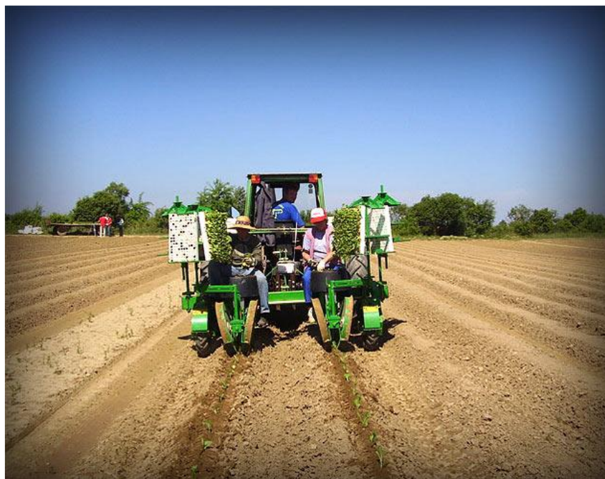
Slika 5. Sadnja rasada duhana

olovke. Duljina stabljike s lišćem iznosi 12-15 cm, a korijen treba biti što bolje razvijen. Dobar rasad spreman za presađivanje jest onaj kojemu pri savijanju oko prsta stabljika ne puca. Duhan se uzgaja u plodoredu minimalno svake 2-3 godine. Mjere zaštite i obrada jednaki su kao i za široku proizvodnju duhana.