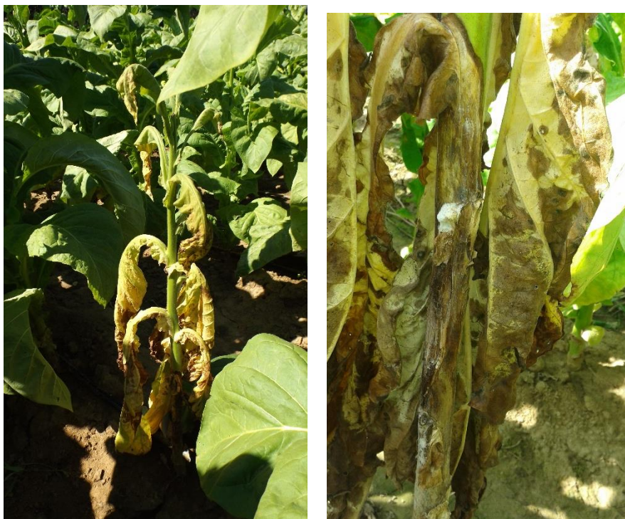
Slika 10. Bijela trulež