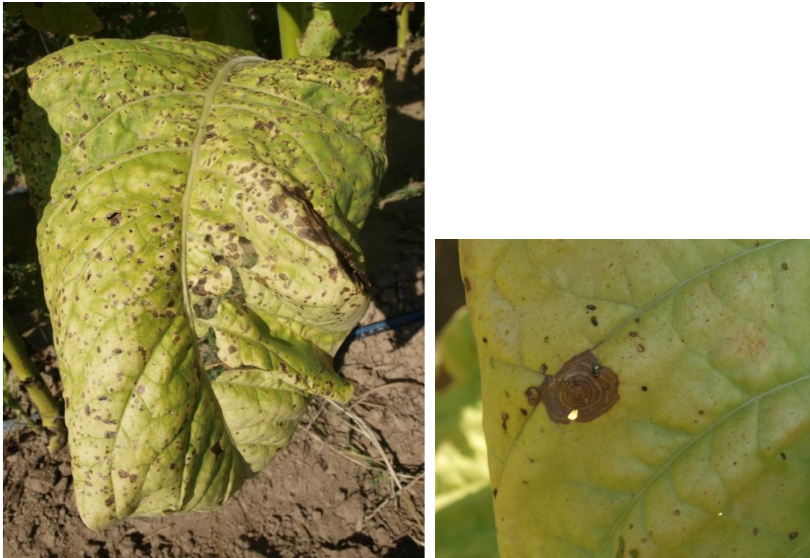
Slika 12. Smeđa pjegavost lista

- simptomi se mogu pojaviti i na peteljka listova i na stabljikama