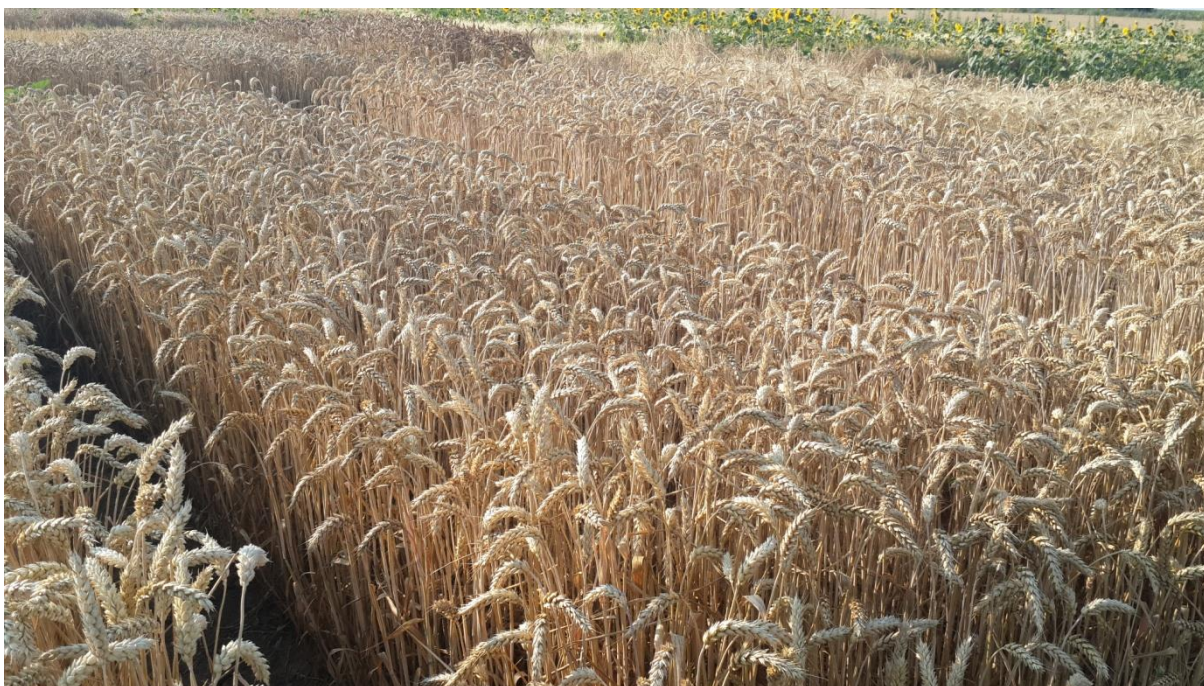
Slika 3. Izgled parcela za proizvodnju sjemenske pšenice