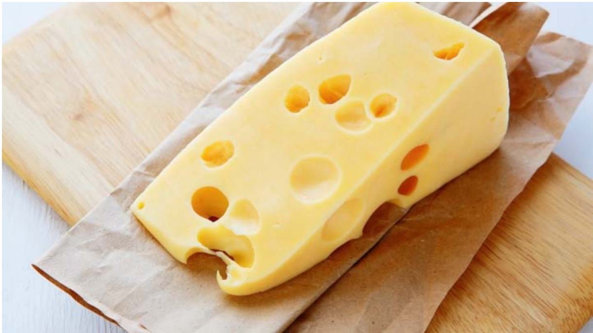
Slika 2. Švicarski sir

Proizvodnja švicarskog šupljikavog sira uključuje propionsku-kiselu fermentaciju mlijeka uz sazrijevanje koje se obavlja s pomoću Propionibacterium shermanii i Propionibacterium freudenreichii . Propionska kiselina daje karakterističan miris i okus, a ugljikov dioksid koji nastaje tijekom fermentacije stvara rupe u švicarskom siru. Tijekom sazrijevanja različitih sireva upotrebljavaju se i mnoge vrste plijesni. Nedo zreli se sir inokulira sporama plijesni i inkubira u toploj i vlažnoj prostoriji kako bi se potakao rast plijesni.