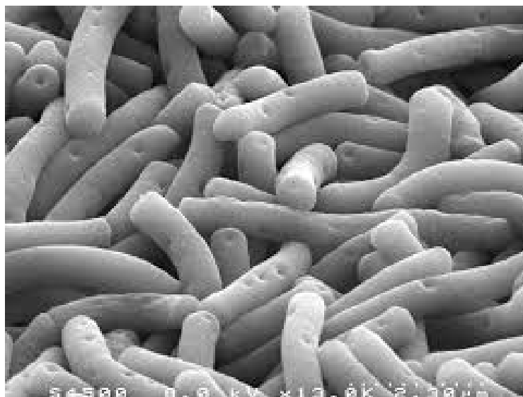
Slika 6. Lactobacillus bulgaricus