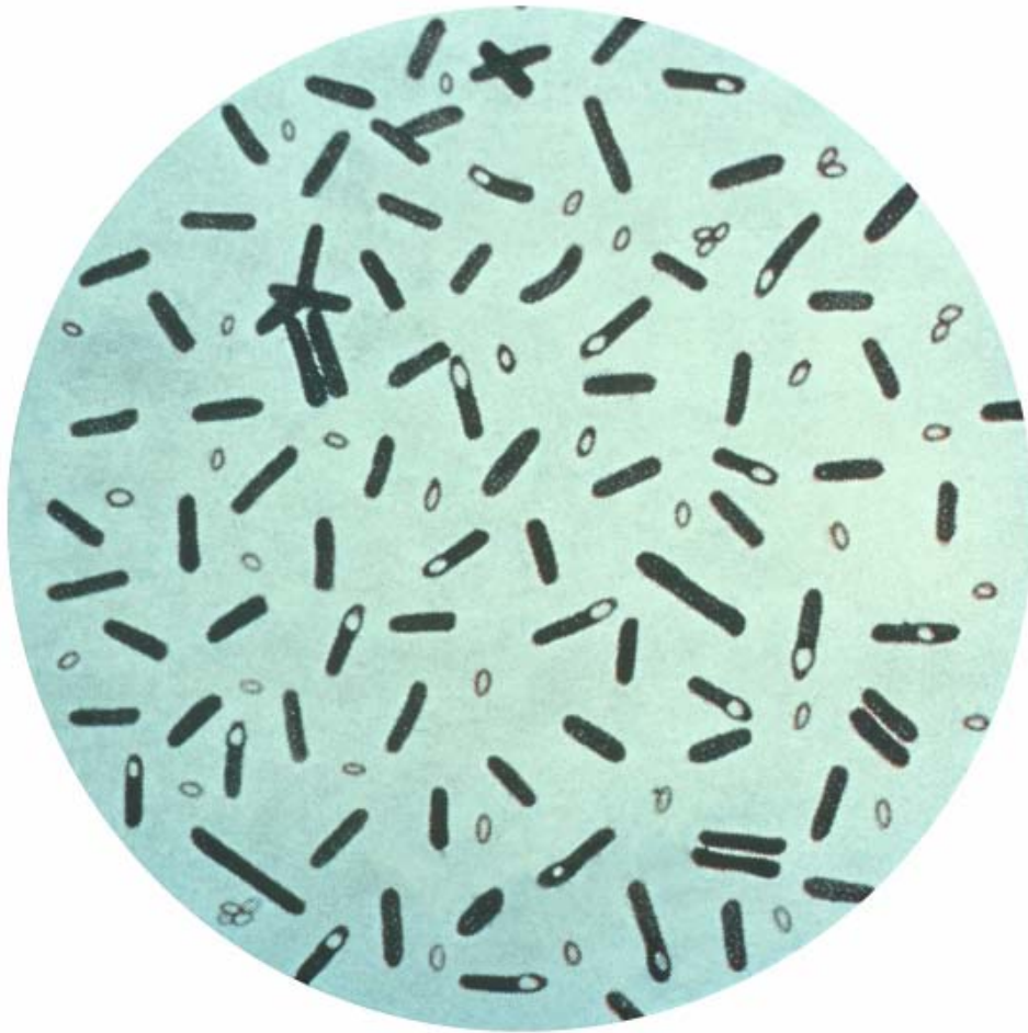
Slika 8. Clostridium botulinum