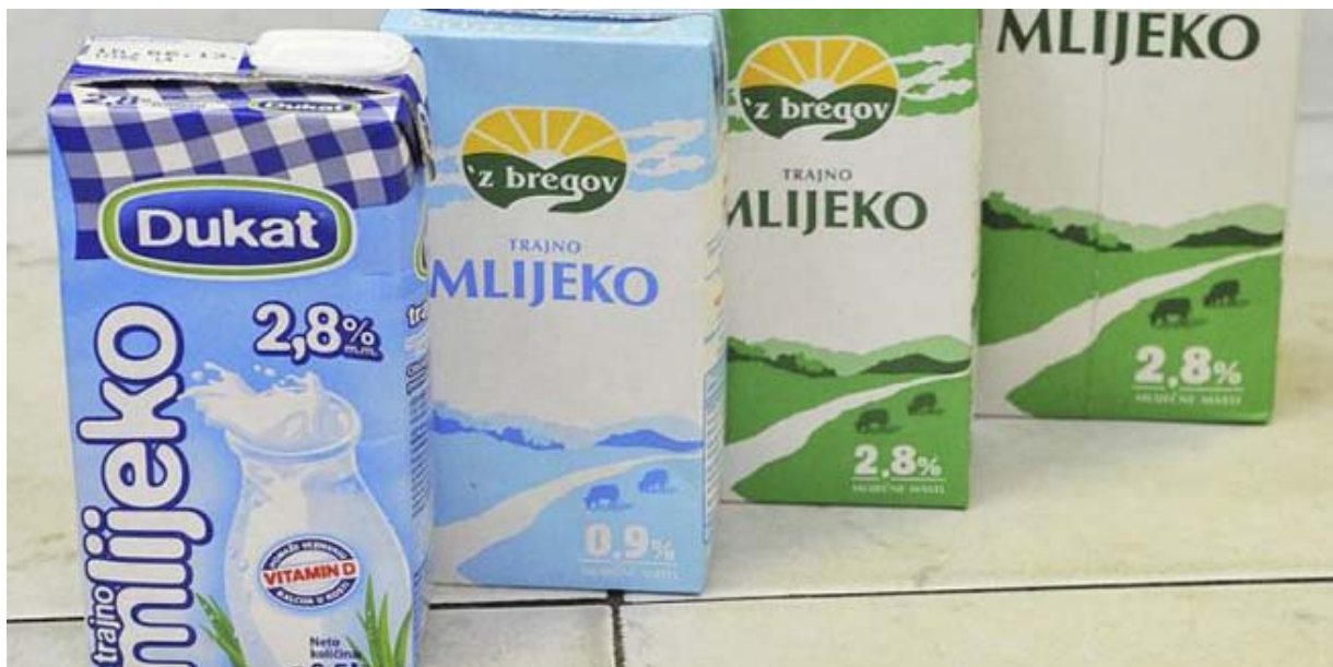
Slika 3 . Trajno pasterizirano mlijeko

Kako zaključujemo na osnovu svih pokusa, čim se grije ili kuha, mlijeko gubi svoja ljekovita i hranjiva svojstva. Poznati kanadski biolog H. Tobe, piše u svojoj knjizi 'Enzimi, iskra života' da se zagrijavanjem ili pasterizacijom, a također i tvorničkim postupcima i kemikalizacijom hrane uništavaju svi enzimi koji za nas imaju životnu važnost. Na taj način naše tijelo prima u sebe samo jedan mali dio glavnih sastojaka mlijeka; naročito kalcij, željezo i fosfor. Sve što preostaje, to su otpadne tvari i zagađenje krvi. Klice bolesti koje usprkos pasteriziranju svuda vrebaju, nalaze izvanrednu podlogu za razvijanje u velikoj zasićenosti krvi otpadnim materijama, koja nastupa "ubijanjem" mlijeka. Tako nastaju i bolesti. Pasterizacija još uvijek hipotetski rečeno može uzrokovati učinak suprotan željenom.