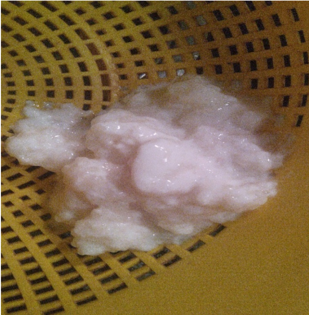
Slika 1. Procjeđena kefirna zrnca