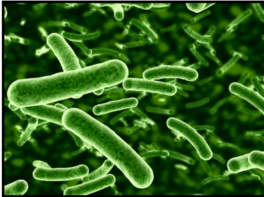
Slika 5. Lactobacillus casei ssp rhamnosus