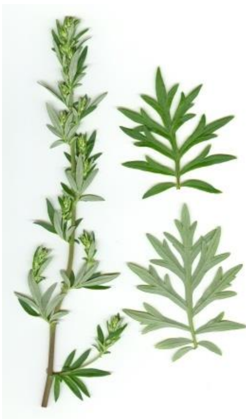
Slika 2. Listovi ambrozije