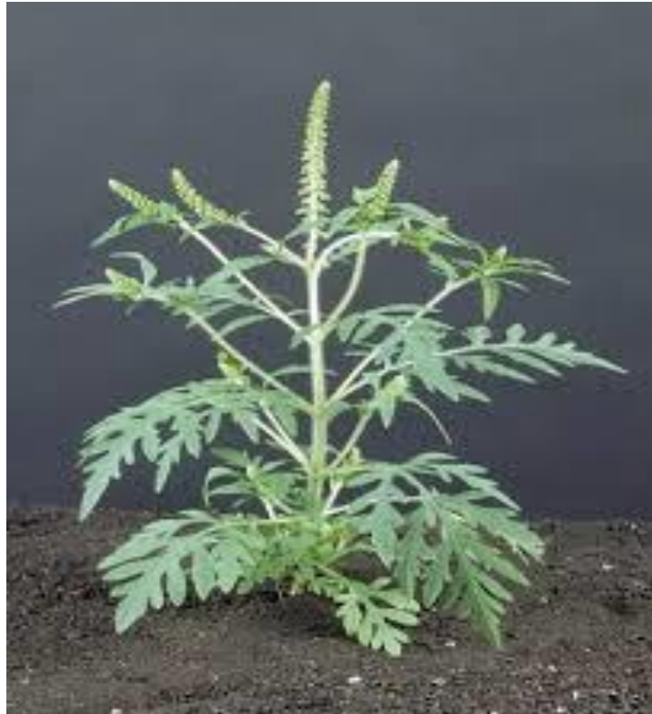
Slika 1. Ambrozija ( Ambrosia artemisiifolia L.)

Ambrosia artemisiifolia L. (pelinolisni limundžik, partizanka, fazanuša, Krausova trava) je jednogodišnja zeljasta biljka (Slika 1.).