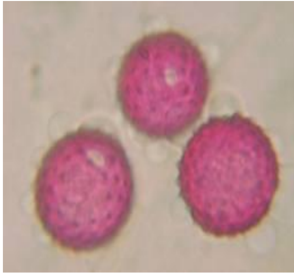
Slika 6. Peludna zrnca ambrozije

Pelud ambrozije je aeroalergen i najčešći je uzročnik ljetnih polinoza, te je jedna od najranije prepoznatih alergena (Slika 6.).