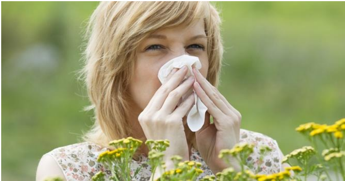
Slika 9. Simptomi alergija – kihanje i curenje nosa

Na internetskoj stranici Nastavnog zavoda za javno zdravstvo „Dr. Andrija Štampar“ navodi se da epidemiološke studije iz cijelog svijeta pokazuju da je 25 % svjetske populacije alergično i taj broj se povećava bez obzira na dob, rasu i socijalni status. Daniels (2004.) navodi da u SAD-u alergije spadaju u najbrojnije uzročnike radne nesposobnosti ljudi, a isto tako su i šeste po redu uzročnika kroničnih bolesti. Također istraživanja kažu da je 10 milijuna Amerikanaca alergično na mačke, dok je 2 milijuna alergično na ubode kukaca. Alergije na hranu su rjeđe, otprilike svaka treća osoba je alergična na hranu, djece mlađih od 3 godine je 3-8 %, a odraslih je 1 %. Mušič (2009.) navodi kako se procjenjuje da od alergija pati više od četvrtine odraslih stanovnika, te 30 % djece. Smatra se da se u zadnjih tridesetak godina učestalost alergija udvostručila, a u nekim slučajevima i utrostručila. Broj osoba koje pate od astme povećava se za 4 % godišnje u razvijenijim državama.