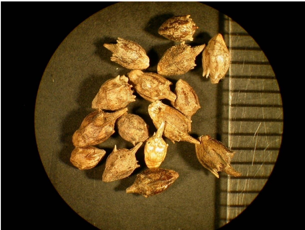
Slika 5. Roška

Plod ambrozije je okruglasto jajolika roška ili ahenija. Roška ima 5 do 7 zuba poput trnja, a središnji zub je najveći (Slika 5.).