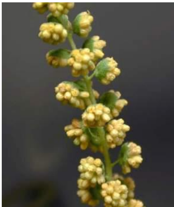
Slika 3. Muški cvjetovi