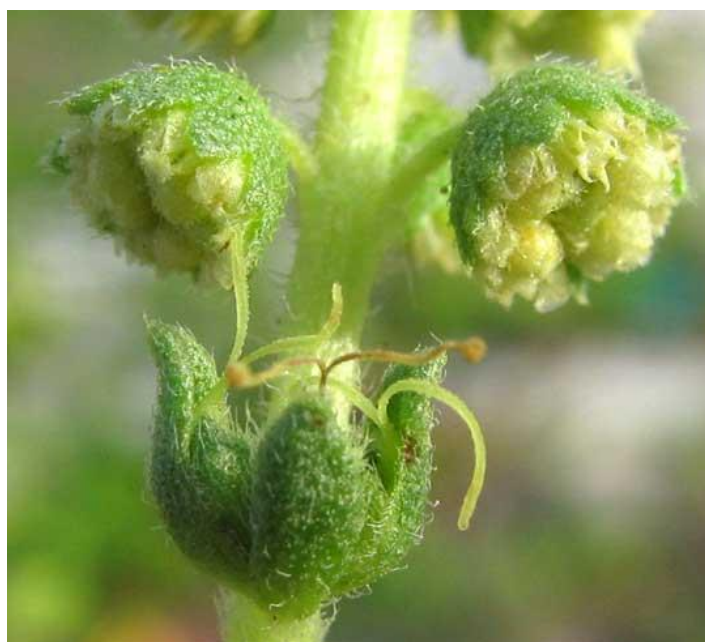
Slika 4. Muški i ženski cvjetovi ambrozije