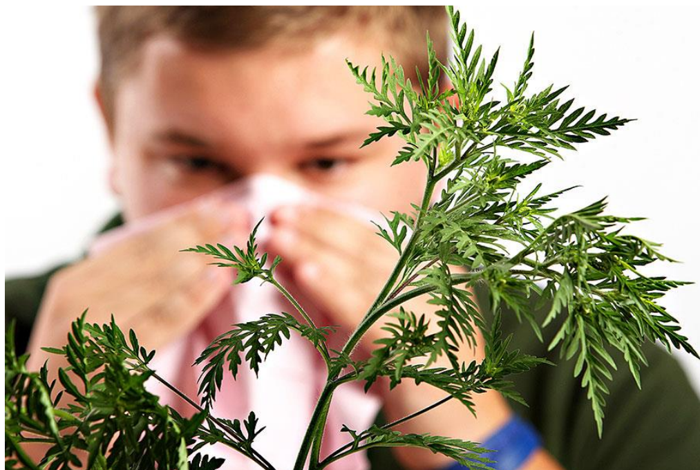
Slika 10. Simptomi alergija na ambroziju

Simptomi alergijske reakcije na ambroziju uobičajeni su kao i kod alergijske reakcije na pelud (Slika 10.), a često se uz alergijski rinitis i konjuktivitis može razviti i alergijska astma. Hulina (2011.) navodi kako je manje poznato da se kod osjetljivih osoba, ukoliko dođu u dodir s ambrozijom, može razviti dermatitis. Najviše peludi ambrozije u zraku nalazi se sredinom kolovoza, pa sve do kraja studenog, ili dok ne dođe prvi mraz (Daniels, 2004.). Za alergičare je izuzetno važno da je najveća koncentracija peludi u zraku u jutarnjim satima, te prije podneva, dok poslije kiše koncentracija opada.