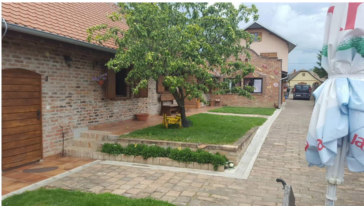
Slika 2. Prikaz imanja, (vlastita fotografija, 04.06.)