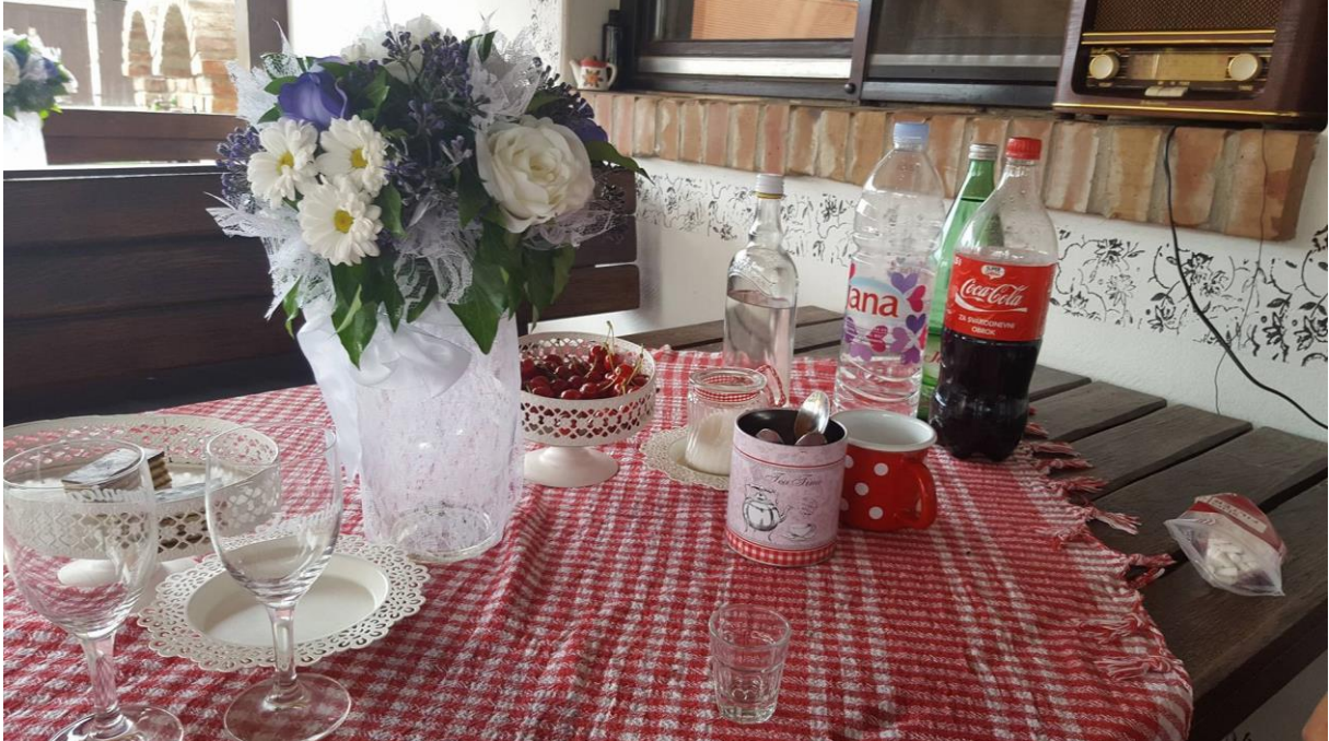
Slika 7. Ponuda na imanju, (vlastita fotografija 04.06.)

i raznolikost ponude jer svakom gostu omogućavaju da odabere nešto za sebe i da se kroz raznolikost ponude može iznova i iznova vraćati.