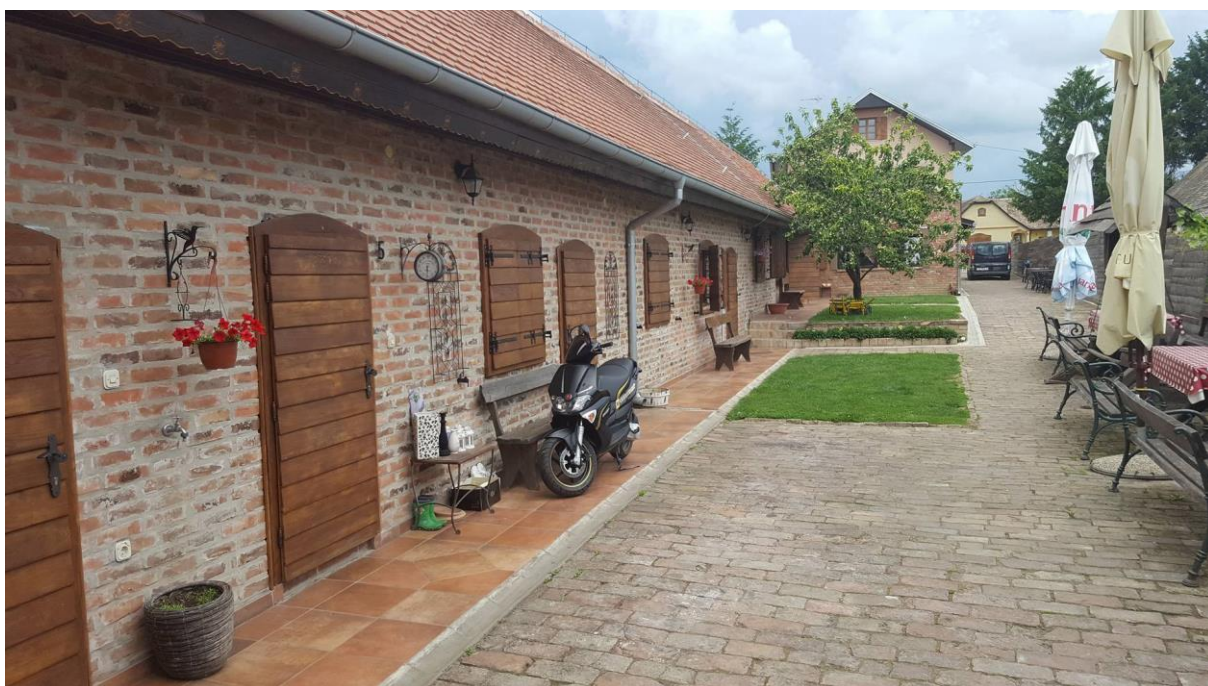
Slika 8. Izgled imanja, (04.06.)

Iz svega navedenoga kroz Porterov model konkurentnosti da se zaključiti da ono što drugi u vezi konkurencije smatraju kao nepogodnost, seljačka gospodarstva, te poduzetnici u mjestu Karanac i okolici su to prebacili u svoju korist. Sa promoviranjem svega što imaju proširuju ponudu i ne boje se konkurencije, a nivo prijetnje konkurencije i novih konkurenata je ocijenjen vrlo nisko.