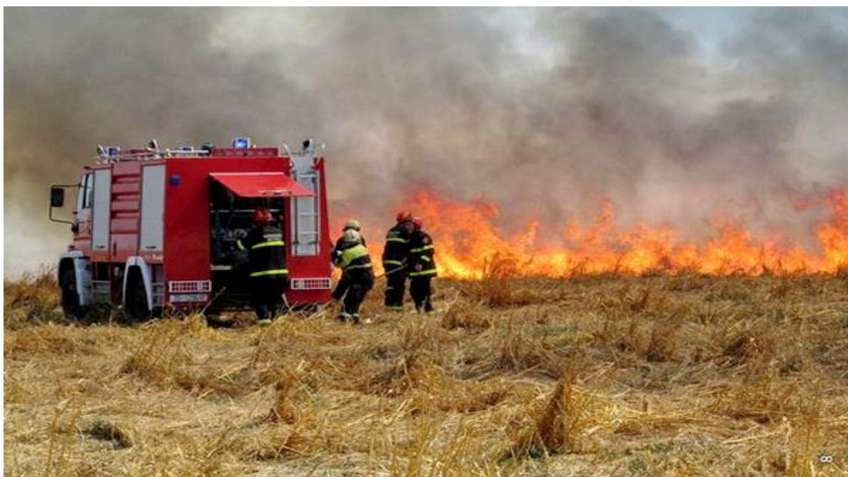
Slika 8. i 9 . Vatrogasci pozvani na teren zbog paljenja korova