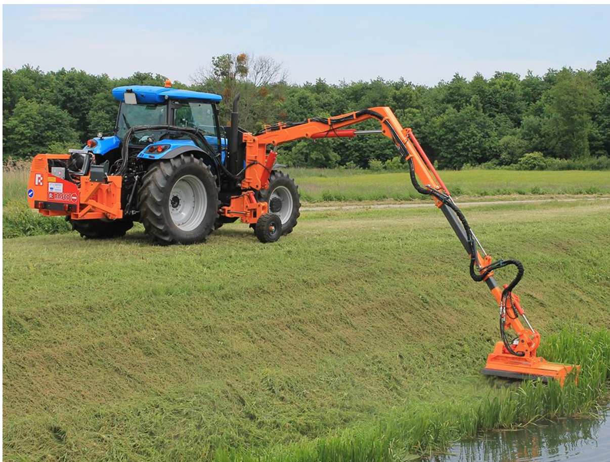
Slika 7. Održavanje kanala uz poljoprivredne površine

Košnja je jedna od najčešćih i učinkovitijih preventivnih mjera (Slika 7.). Ako se obavi prije početka generativne faze, možemo učinkovito smanjiti broj korova na nekim površinama. Najbolje je iskoristiva na antropogenim površinama poput cesta, kanala, jaraka, itd. Košnja nam isto omogućuje da iscrpimo biljku. Uništavanjem nadzemnoga dijela biljke, prisiljavamo tu biljku da nadoknadi izgubljeni stabljiku te ju tako možemo oslabiti da ne dođe do generativne faze.