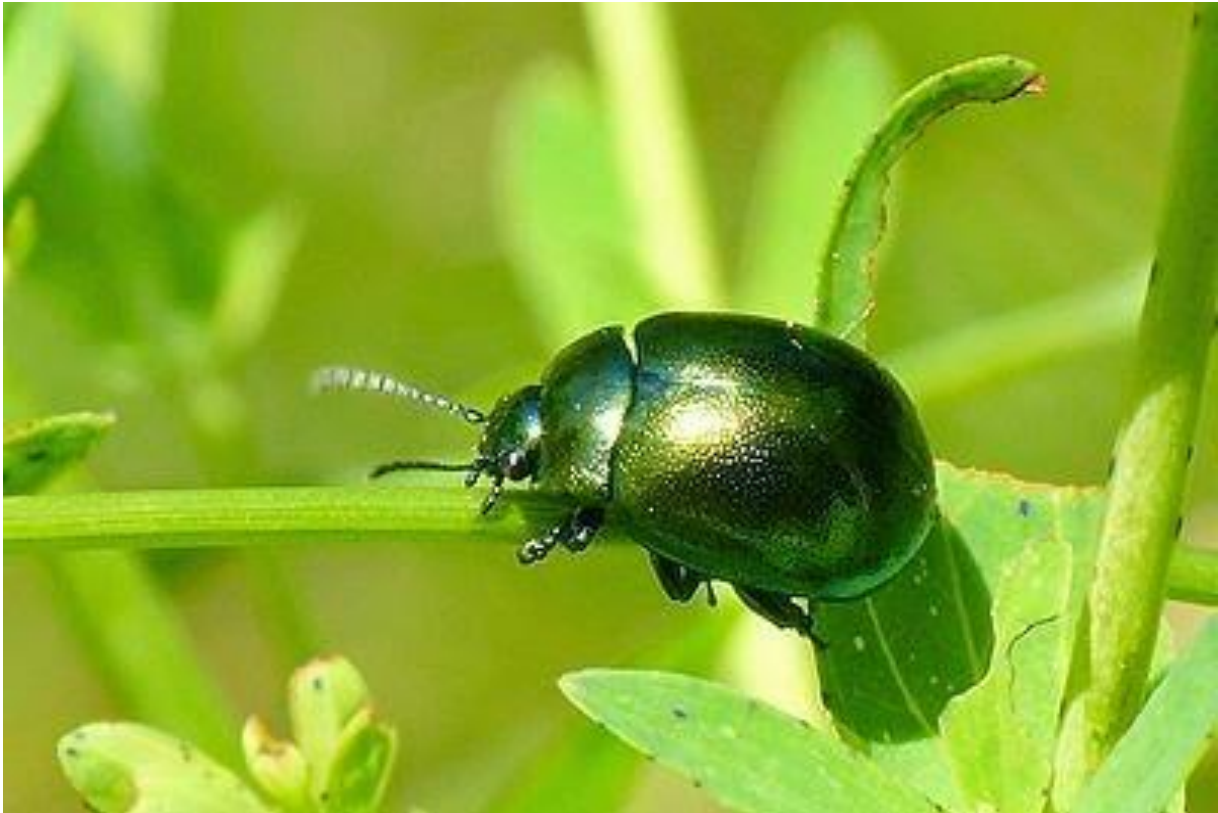
Slika 11. Zlatica ( Chrysolina quadrigemina ) napada kantarion

isplativija jer se kukci sami razmnože (Slika 11.). Ali kod ovih operacija moramo biti oprezni da ne poremetimo prirodnu ravnotežu postojećih ekosustava. Kukci mogu skočiti na domaće biljke ako se ne obave dobre analize korova koje želimo ukloniti. Pod ove mjere možemo uvrstiti i živi malč, tj. biljni pokrov koji nam služi da pokrije međuredne površine na poljima i tako spriječi razvoj korova.