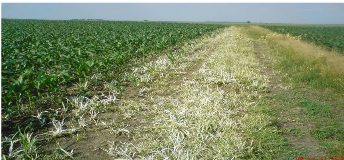
Slika 12. Herbicidi u kukuruzu

Herbicide koristimo u tri roka: prije sjetve, nakon sjetve i nakon nicanja. Prije sjetve primjenjujemo rezidualne herbicide tako da ih tretiramo po tlu ili inkorporiramo u tlo. U ovom razdoblju biljka usvaja herbicid kroz korijen te često odumre tijekom nicanja. Nakon sjetve koristimo rezidualne i folijarne herbicide. Rezidualne koristimo po tlu dok folijarne ako je korov već iznikao te ima prve listove. Nakon nicanja koriste se folijarni herbicidi. Oni mogu biti sistemični i kontaktni. Kao što je objašnjeno defolijanti djeluju tako da uništavaju nadzemne dijelove biljke. Budući da u ovom u ovom vremenu korovi imaju nekoliko listova, herbicidi su izuzetno korisni (Slika 12.).