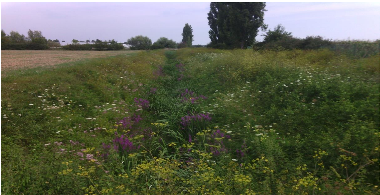
Slika 1. Zakorovljeni kanal i poljski put uz polje

Naše poljoprivredne prakse često oponašaju takve tipove područja, te nas zbog toga ne bi trebalo čuditi da su neki korovi već prilagođeni za ta područja (u nekim slučajevima su i predobro prilagođeni). Zbog te prilagođenosti, oni su u mogućnosti da prerastu kulturnu biljku na poljoprivrednim površinama, lakše se šire (vegetativno i generativno), njihovo sjeme može zadržati klijavost godinama ili može imati više generacija u istoj sezoni.