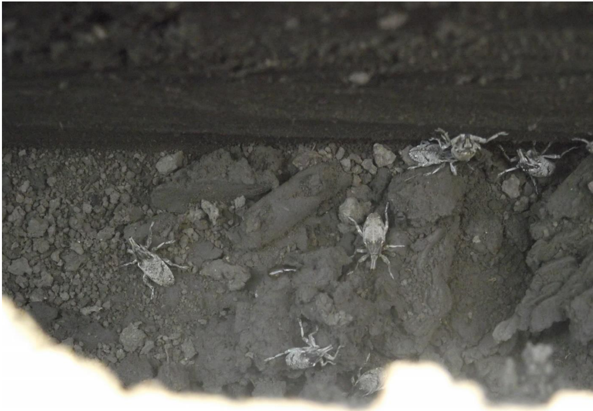
Slika 17. : Lovni kanal za repinu pipu