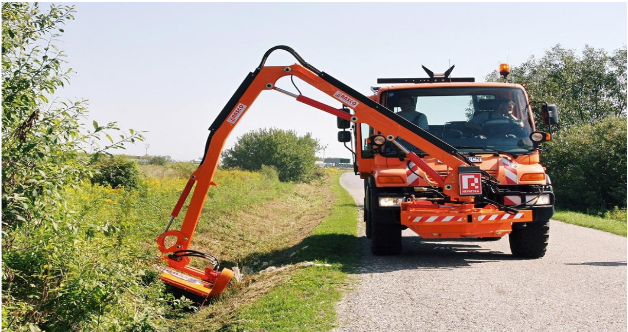
Slika 3. Košnja korova uz puteve

Zbog veličine korovnog zrna, to zrno se često može pomiješati sa zrnom kulturnih biljaka i tako se nekontrolirano širiti na druga polja. To možemo spriječiti uklanjanjem korova s polja prije žetve, a vrlo je važno i koristiti certificirano sjeme profesionalnih proizvođača. Ta sjemenska smjesa je nešto skuplja, ali nam daje garanciju da je čista od korovnih zrna i da je tretirana protiv ostalih štetnika. Ovo je jedan od najboljih načina u borbi protiv korova i bolesti.