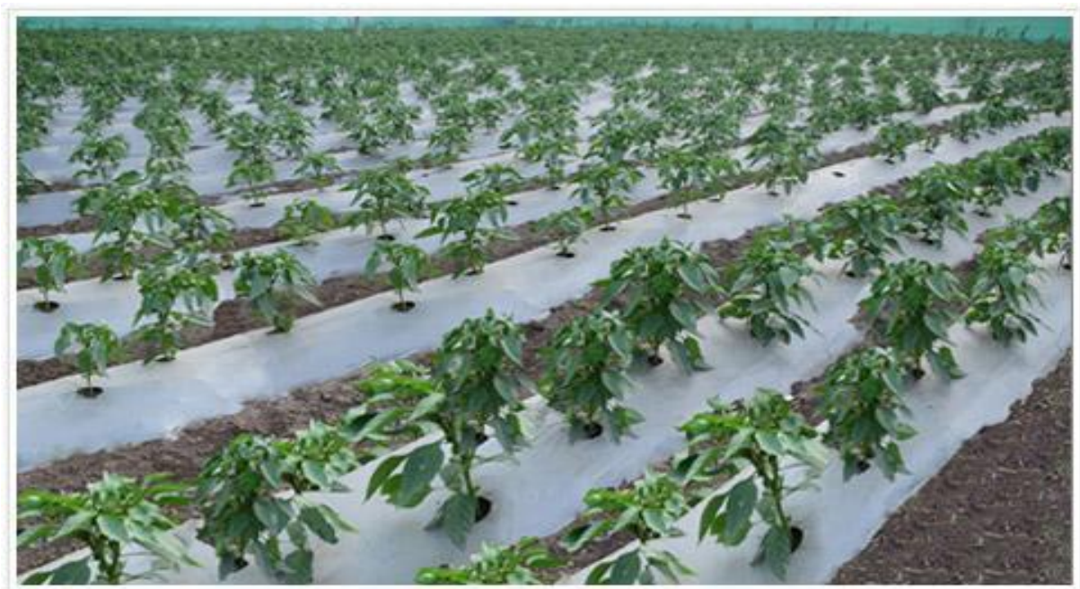
Slika 6. PVC pokrivač u uzgoju povrća

Plodored je mjera koja smanjuje mogućnost dominacije štetnika, a ako se ne provodi može dovesti do snažnijeg širenja korova koji se nalaze i razvijaju u određenim kulturama. Plodored zahtijeva različite agrotehničke mjere svake godine te i to utječe na mogućnost prilagodbe korova na polju.