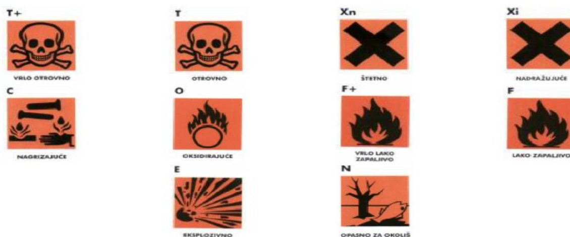
Slika 15. Oznake opasnosti na poljoprivrednim sredstvima

Kod korištenja moramo imati na umu karencu (najkraće razdoblje koje mora proći od uporabe sredstva do korištenja tretiranog proizvoda). Ona nam govori kada je neko sredstvo toliko razgrađeno da je sigurno koristiti prskane plodove ili biljke. Upute za karencu moraju se dobiti uz sredstvo. Za većinu sredstava je važna količina sredstva koje su potrebne da dođe do trovanja. To nazivamo toleranca. Toleranca je maksimalna dopuštena količina aktivne tvari nekoga sredstva za zaštitu u ili na namirnicama. Tolerance su zakonski propisane te se nadopunjuju kroz znanstvena istraživanja.