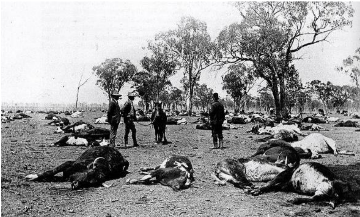
Slika 2. Trovanje stoke

Mnogi korovi imaju štetne kemikalije koje služe kao obrana od drugih organizama ili imaju alelopatski utjecaj na druge biljke. Kod neodržavanih pašnjaka može doći do razvijanja opasnih otrovnih korova koji mogu dovesti do uginuća domaćih životinja (Slika 2.). Korovi poput kantariona ( Hipericum perforatum ) (Šarić, 1985) sadrže otrovne tvari koje mogu ozbiljno ugroziti zdravlje životinja. Neke biljke sadrže cijanovodičnu kiselinu koja može ostati u proizvodima životinja koje su se njima hranile.