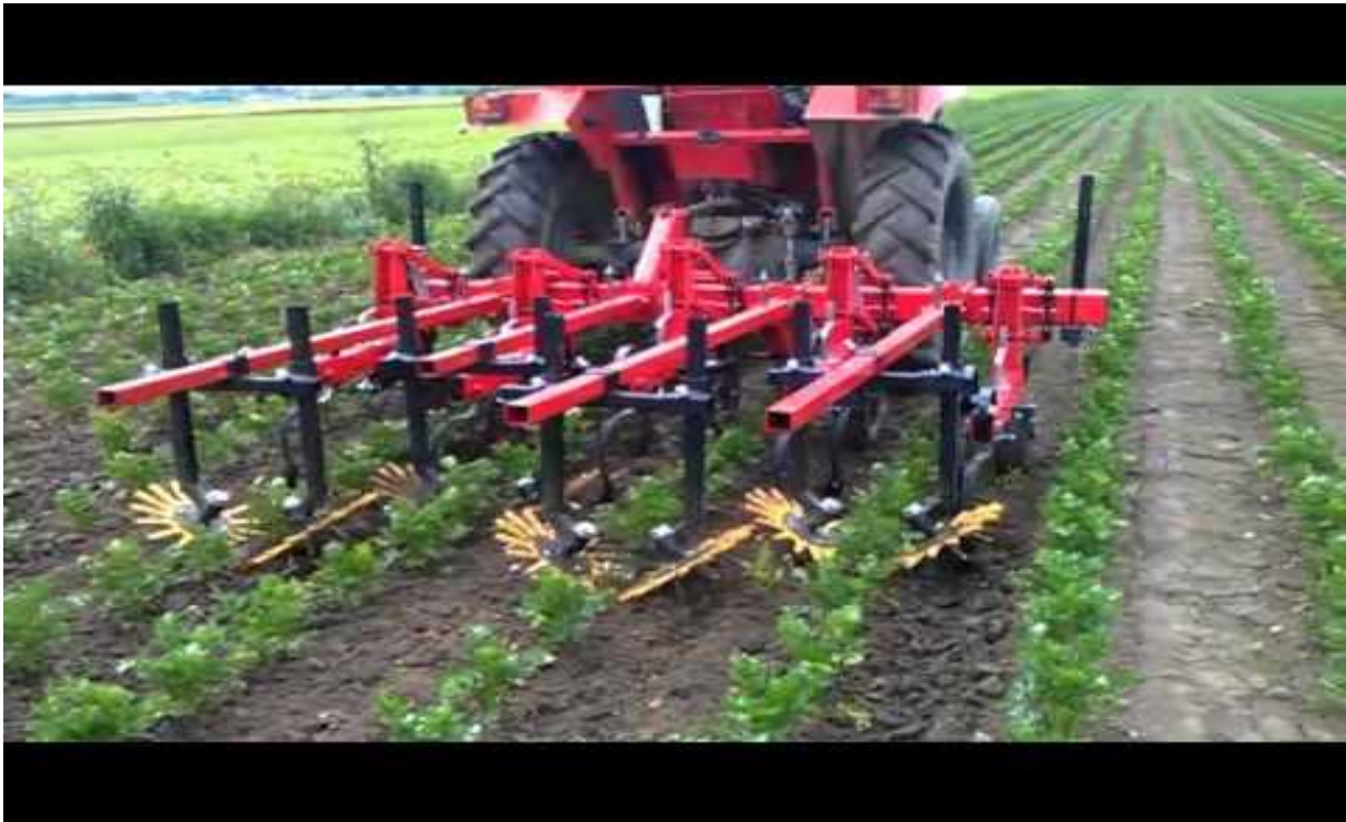
Slika 4. Fingerweeder

To je jedna od mjera koje se mogu bez većih problema koristiti na manjim površinama, ne zahtijeva posebnu mehanizaciju i ekološki je prihvatljiva. Na većim površinama se može ručno vršiti ako je napad na posebnim mjestima. Često se ova mjera mora izvoditi par puta mjesečno (ovisno o vegetaciji korova). Pomoću te mjere ručno ili strojno čupamo korov s naših površina. Jedni od strojeva koje se koriste su takozvani fingerweederi (Slika 4.). To su nastavci koji se stavljaju na kultivatore te rade tako da hvataju biljku prstima te je iščupaju iz zemlje.