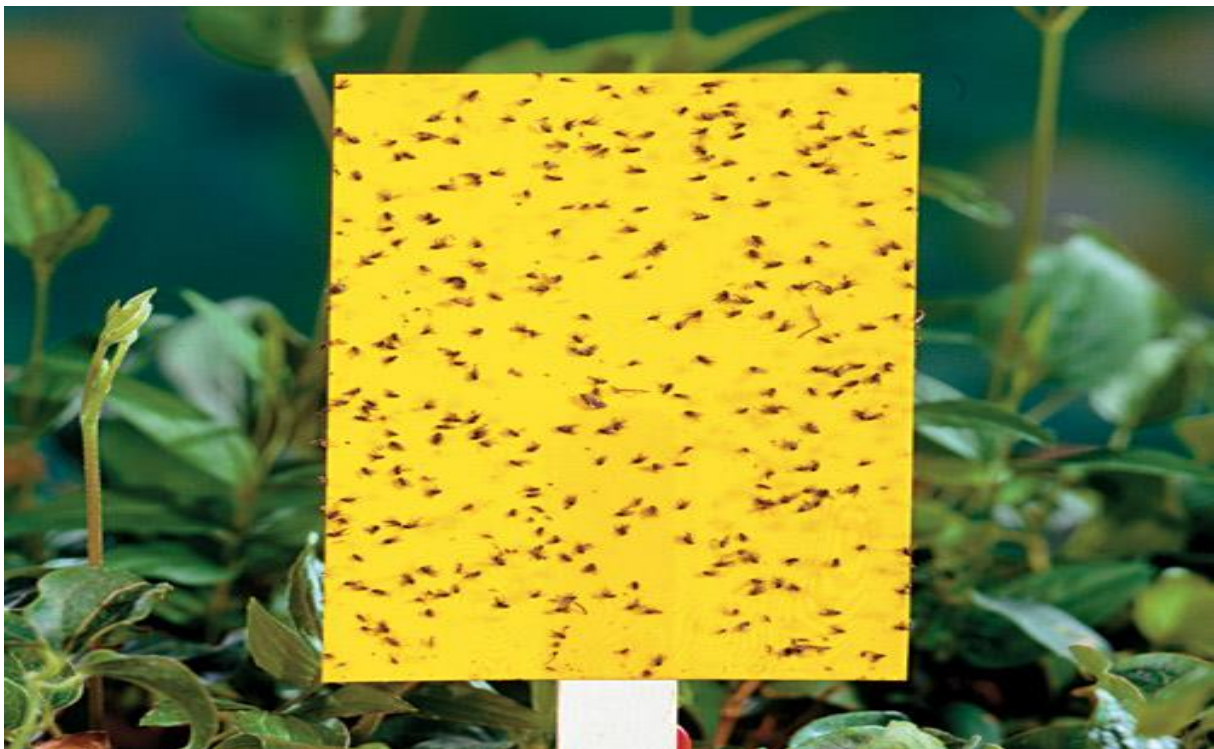
Slika 18. : Ljepljiva zamka

Uvođenje stranih organizama na određena područja moramo obaviti sa izuzetnim oprezom i uz savjet stručnjaka, jer ako ne pazimo što i kako radimo možemo ih pretvoriti u ozbiljne štetnike. Odličan primjer kod nas je uvođenje malog indijskog mungosa ( Herpestes javanicus ) na otok Pelješac gdje je trebao uništiti zmiје (uglavnom poskoke ( Vipera ammodytes )). Mungos je uništio zmiје, ali je poslije morao promijeniti svoju ishranu te je počeo činiti štetu ljudima, a to je i dovelo do porasta broja kukaca koji su ostali bez svojeg prirodnoga predatora (Matas i sur., 1992). Ovdje spadaju i razne klopke za štetnike koje koriste atraktante, bili oni vizualni (Slika 18.), feromonski ili hrana za određeni tip štetnika. Najčešće se kod ovog tipa zamki koristi metoda "privuci i ubij". Ona se oslanja na privlačenje kukca u posudu koja je ispunjena atraktantom i aktivnim sredstvom. Jedna od češćih tipova zamki je takozvana ljepljiva ploča, koja se oslanja na vizualni atraktant (često žuta i plava boja) na kojoj je ljepljiva prevlaka s koje kukci ne mogu odletjeti. Koji god tip bioloških metoda koristili, bile zamke ili introdukcija novih vrsta, moramo se obavezno pridržavati pravila, zakona i tražiti savjete stručnjaka.