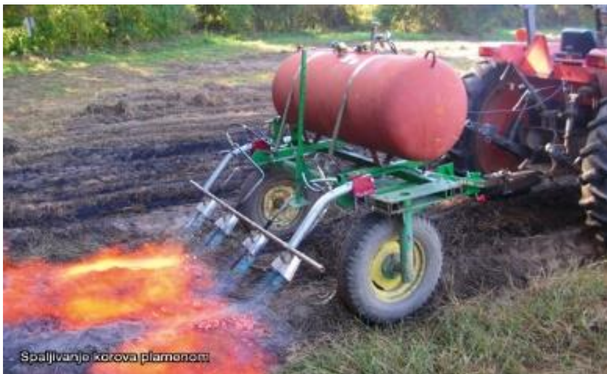
Slika 10. Stroj za suzbijanje korova plamenom