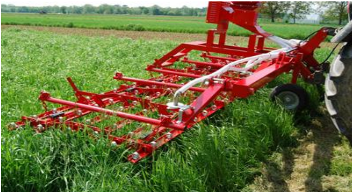
Slika 5. Drljača plijevilica

Tanjuračama možemo uništiti one korove koji se šire generativno, ali vegetativnim korovima ćemo omogućiti lakše širenje podzemnim dijelovima. Drljanjem perastim drljačama sa zupcima uništavamo korove zajedno s pokoricom (Slika 5.). Valjanjem možemo potaknuti rast i razvoj korova te ih poslije možemo lakše uništiti. Plijevljenjem korov čupamo iz tla bilo ručno ili strojno. Ručni način plijevljenja je težak i ekonomski neprihvatljiv posao, te tijekom njega dolazi do gaženja usjeva gustoga sklopa. Najbolje vrijeme plijevljenja je poslije kiše, jer se tada korov najlakše čupa iz tla. Iščupanu masu moramo izbaciti na površinu koja je udaljena od polja što dalje moguće, da se korov ne bi opet "primio". Prema raznim navodima smatra se da je plijevilica jedan od najvažnijih strojeva u ekološkoj proizvodnji, bez kojeg se ne može imati kvalitetna i uspješna obrana od korova (Kisić, 2014).