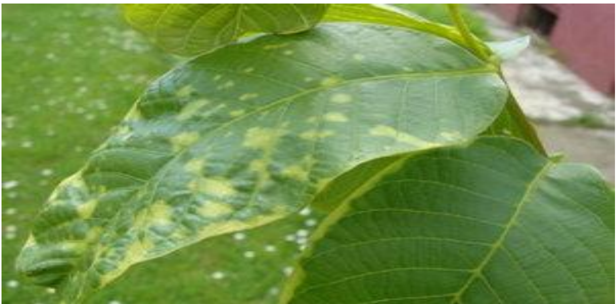
Slika 13 . Oštećenje na orahu