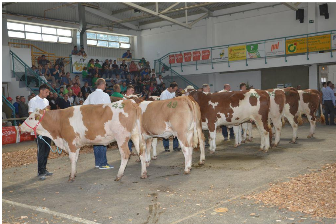
Slika 3. Stočarski sajam (Gudovac, 2015.)

tijelima kako bi se određeni programi i postojeće mjere mogle lakše provoditi. Slične institucije djeluju i u zemljama razvijenog stočarskog sektora EU. Glavni ciljevi HPA su primjenjivati najnoviju tehnologiju i alat u poslovanju, te edukacija hrvatskih poljoprivrednih proizvođača o najnovijim saznanjima u modernom stočarstvu. HPA je značajna tehnička i stručna potpora prilikom provedbe državnih programa, te će na taj način u budućnosti pomoći investitorima povoljnije iskoristavati sredstva Europskog fonda za ruralni razvoj (EFRD). ( Strateški plan HPA za razdoblje 2014. – 2016., 2013.)