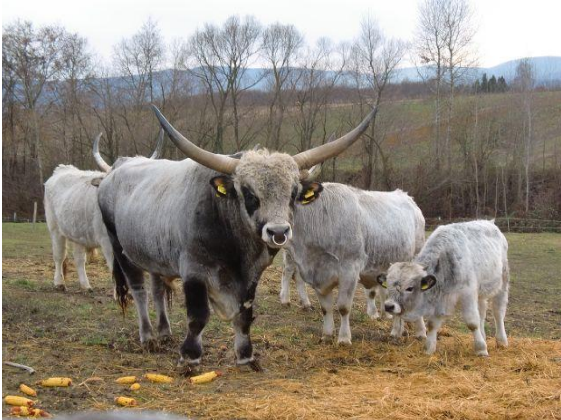
Slika 2. Slavonko-srijemski podolac (Zlatni Lug)

organizaciji svrstana je u kritično ugroženu pasminu goveda. (HPA, Godišnja izvješća 2008./2015.)