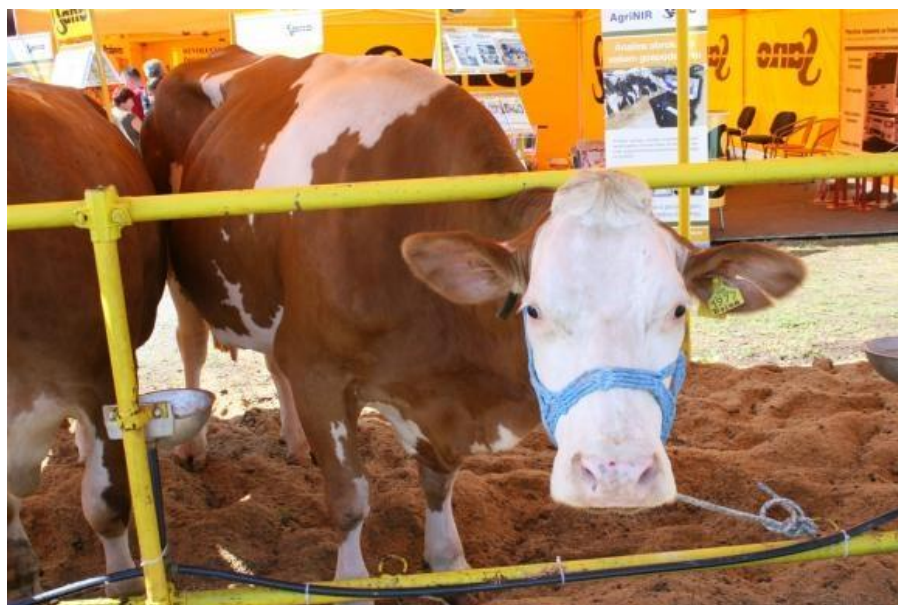
Slika 1. Simentalsko govedo na Jesenskom međunarodnom bjelovarskom sajmu 2013.godine

Simentalac je kao kombinirana pasmina u Hrvatskoj prepoznata još u 19.stoljeću i kasnije je vrlo uspješna u proizvodnji mlijeka i mesa, pa upravo iz tog razloga je 2006.godine činila oko 72% (133.816 grla) ukupne populacije krava. Godine 2015. udio populacije simentalne pasmine pao je na 63 % što je gotovo za 10% manje nego 2006.godine. Iako se broj simentalne pasmine od 2006. do 2015. postupno smanjivao, usporedno s tim, povećavao se broj krava pod kontrolom mliječnosti, pa je od 110.002 krava 2015.godine čak 51,2% bilo u kontroli mliječnosti.