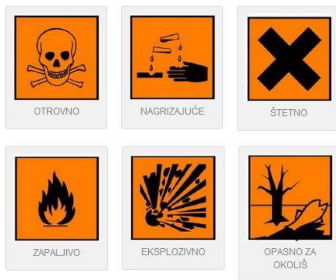
Slika 9. Neke od obilježja na opasnom otpadu