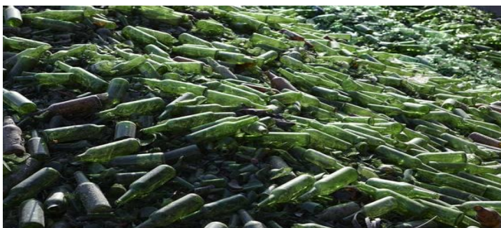
Slika 2. Recikliranje stakla

Staklo je vrlo pogodan materijal za recikliranje. Staklo čini udio 5 - 10 % komunalnog otpada. Reciklirano staklo može se koristiti za mnoge sekundarne namjene. Recikliranjem stakla postižu se velike uštede energije. Energija koja se uštedi recikliranjem jedne staklene boce, dovoljna je da žarulja od 100 W gori 4 sata. Odvojenim skupljanjem i recikliranjem staklenog ambalažnog otpada osigurava se ušteda prirodnih resursa te se smanjuje onečišćenje zraka, vode i tla.