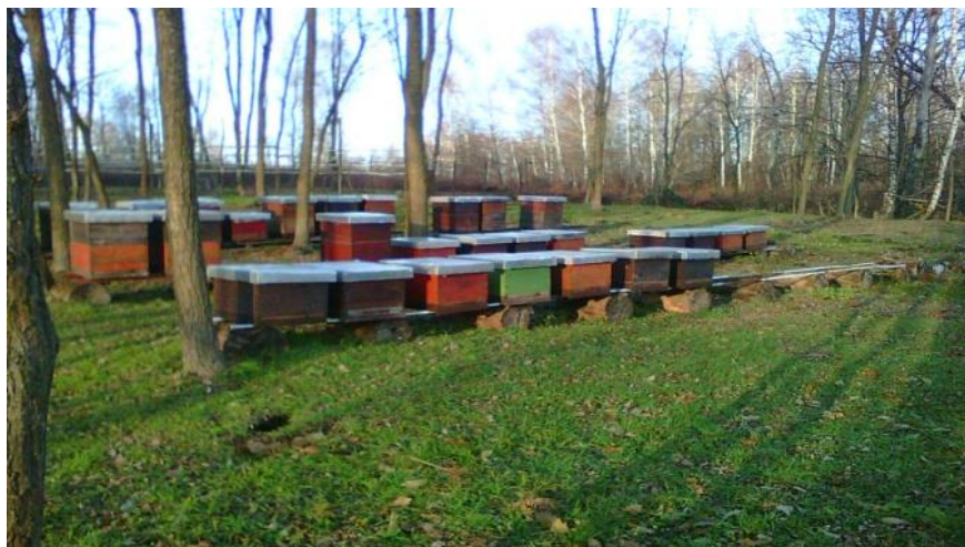
Slika 3. Originalna slika pčelinjaka nositeljice OPG-a slikano u listopadu