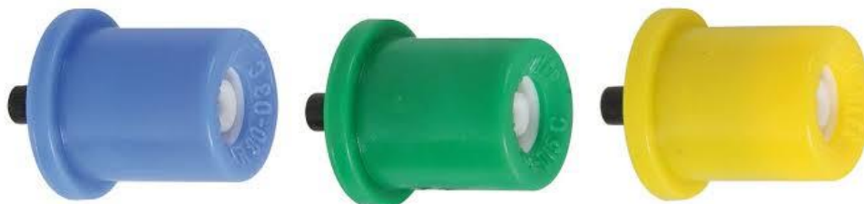
Slika 2. Lechler TR 80 mlaznice