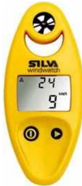
Slika 3. Anemometar Silva Windwatch