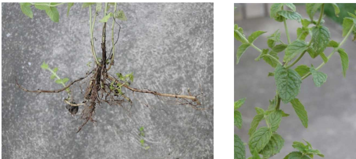
Slika 6. List i korijen paprene metvice

(Slika 6.) sadrži veliki broj izdanaka koji se na dubini od pet cm i na površini razvijaju, korijen je razgranat. Žiličast je, slabo razvijen i 3 do 5 cm od površine tla su smještene glavne žilice. Promjer stolona je 5 do 7 cm, a dužina 30 do 70 cm. Površinski izdanci na koljencima razvijaju nadzemne organe i korijenov sustav i oni su ljubičastozelene boje, a podzemni su bijele boje (Stepanović i sur., 2001; Pahlow, 1989; Kolak i sur., 2001; Borovac, 2005; Kišgeci, 2008.).