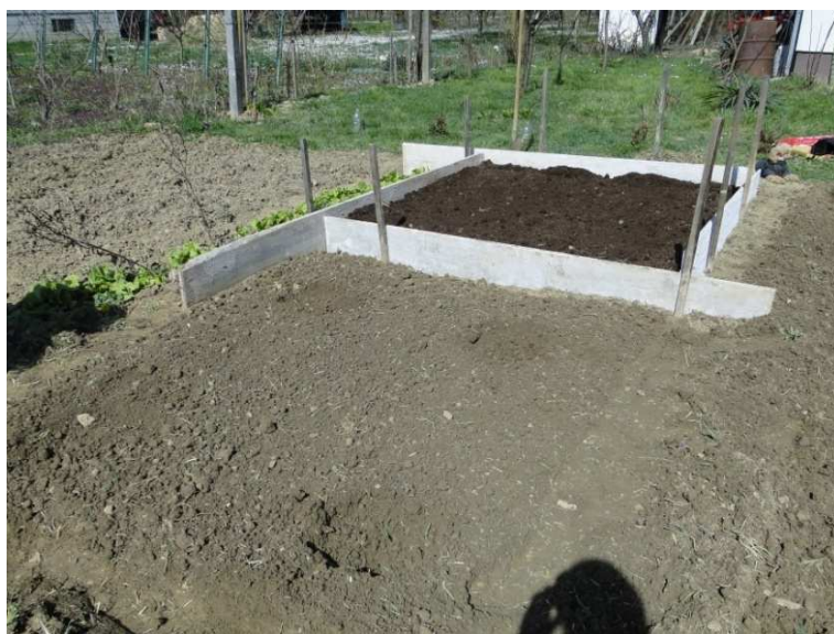
Slika 10. Obično tlo i tlo pomiješano sa supstratom