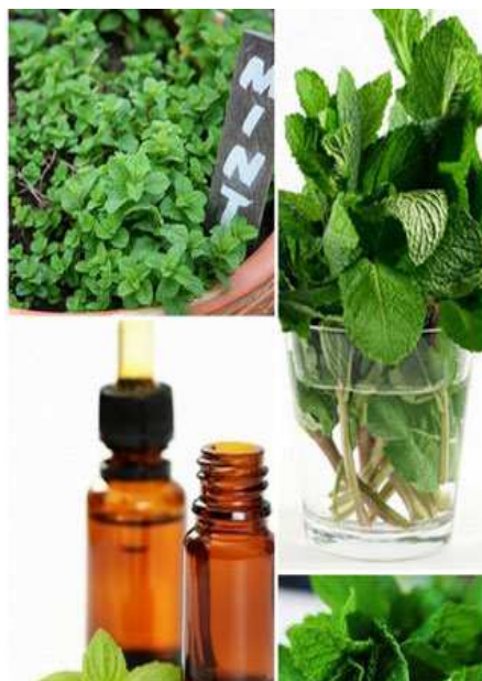
Slika 15. Eterično ulje metvice

list metvice sadrži još i 6 do 12 % trijeslovine, triterpenske spojeve i flavonoide (Kuštrak, 2005.). Iz metvice se mogu odrediti flavonoidi pomoću IR- i VIS-spektrometrije, tankoslojne kromatografije i masene spektrometrije što je pokazalo istraživanje na metvici koja je uzgojena u Slavoniji (Karuza-Stojaković, 1996.). Ulje se dobiva putem destilacije vodenom parom, a ovisno o sorti je različite kvalitete. Količina ulja u cijelom listu ne smije biti manja od 1,2 %, a u rezanom od 0,9 % (Kuštrak, 2005.). Ulje je blijedožute ili blijedozelene boje ali može biti i bezbojno i prodornog je mirisa. Kemijski spojevi u eteričnom ulju se dijele na glavne sastavnice u količini od 20 do 95 %, sekundarne sastavnice u količini od 1 do 20 % i sastavnice koje su u tragovima u količini manjoj od 1 %. Eterično ulje metvice je specifično zato što se glavna sastavnica mentol nalazi u velikoj količini čak i do 90 % i tada glavna sastavnica daje specifična obilježja ulju kao što je miris te kemijska i fizikalna svojstva. U