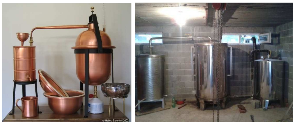
Slika 21. Destilacijski kotao ( www.i51.tinypic.com , www.njuskalo.hr )

Nakon berbe metvica se ostavlja na zemljištu na kojem se uzgajala da biljka malo povene (1 do 2 dana) te se nakon toga destilira. Ukoliko se metvica previše osuši tada se smanjuje količina dobivenog ulja zbog isparavanja ulja iz biljke prilikom sušenja. Za destilaciju se ne koristi ni svježa i potpuno osušena metvica zbog lošije kvalitete ili manje količine dobivenog ulja. Destilira se metvica koja je izgubila oko 50 % vlage. Trajanje destilacije je oko 1 do 2 sata, a ukoliko ubrojimo i punjenje i pražnjenje destilatora tada traje oko 2 do 3 sata (Šilješ i sur., 1992.). Velika količina eteričnog ulja se prodestilira prvih 30 minuta, ali destilacija se mora obaviti do kraja, zato što na kraju destilacije se dobiva najmirisnije i najkvalitetnije ulje (Šilješ i sur., 1992.). Dobivena količina se kreće od 25 do 40 kg eteričnog ulja na 1 ha (Šilješ i sur., 1992.). Mentol iz metvice se dobiva iz eteričnog ulja koje se hladi na temperaturi od -22^{\circ}\text{C} te se tada iz ulja vade kristali mentola (Kuštrak, 2005.). Istraživanja su pokazala da je ulje metvice dobiveno destilacijom vodenom parom i ekstrakcijom superkritičnog dioksida jednake kvalitete uz male razlike u količini dobivenog ulja (Aleksovski, 1999.).