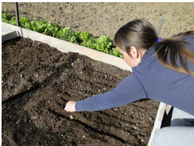
Slika 12. Sjetva metvice