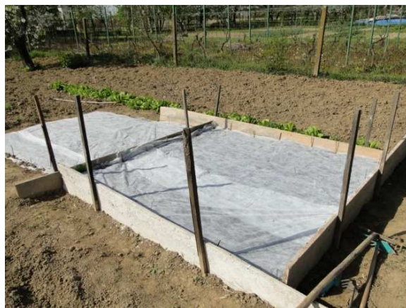
Slika 28. Agrotekstil