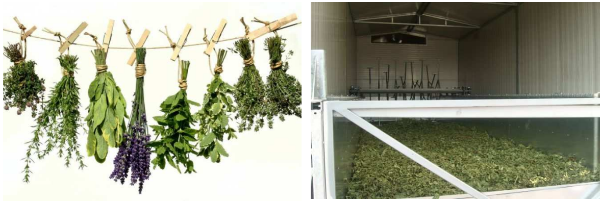
Slika 20. Sušenje začinskog i ljekovitog bilja ( www.altertv.org , www.termoplin.rs )

Prilikom skladištenja već osušene metvice treba pozornost obratiti na vlagu zraka u prostorijama skladištenja te količinu kisika. Osušeno lišće vrlo lako upija vlagu te se nebi trebalo dugo čuvati osim ako nisu povoljni uvjeti za skladištenje (Kuštrak, 2005.). Ukoliko lišće dođe u kontakt s većom količinom vlage može se dogoditi da brzo pljesnivi i izgubi zelenu boju. Također se obraća pozornost na to da se skladištenje obavlja na mračnim mjestima zaštićenim od sunčeve svjetlosti (dijelovi biljke gube prirodnu boju; dobivaju blijedozelenu boju) (Kuštrak, 2005.). Nadzemni dio se pakira u veće papirnate vreće, a lišće u manje vreće također papirnate (Stepanović i sur., 2001.). Skladištena roba se čuva na hladnim, tamnim i suhim mjestima (Stepanović i sur., 2001.).