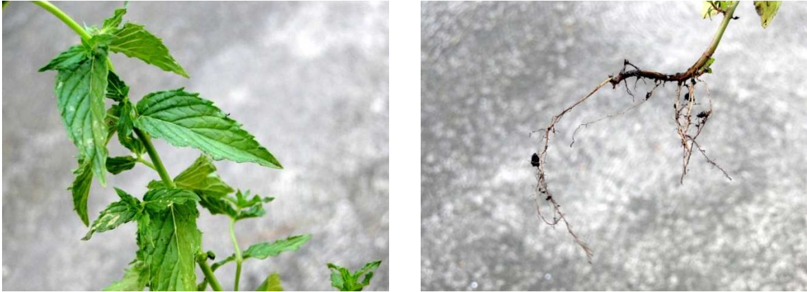
Slika 9. List i korijen klasaste metvice

Mentha spicata var. crispa je poznatija kao i kovrčava metvica, također visine 45 do 60 cm i blijedo ljubičastim cvjetovima u proljeće, listovi su naborani i jarkozelene boje sa nazubljenim rubom. Mentha spicata var. crispa "Moroccan" poznatija kao i marokanska metvica visine 45 do 60 cm sa bijelim cvjetovima ljeti i listovima jarko zelene boje (MacVicar, 2006.).