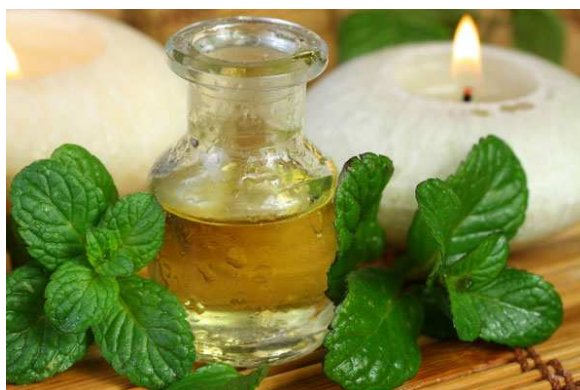
Slika 17. Ulje metvice

koji imaju giht i artritis (Stepanović i sur., 2001; Schafner i sur., 1999; Mannfried, 1989; Kuštrak, 2005; Radić, 2003; Živković, 2003; Borovac, 2005; Šilješ i sur., 1992.).