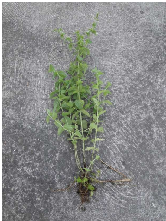
Slika 4. Mentha piperita L.