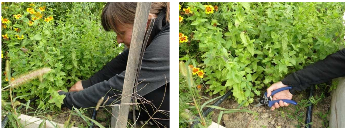
Slika 14. Berba metvice

se ne smije sakupljati za vrijeme rosnih večeri ili rosnog jutra. Ispitivanja su pokazala da prvi otkos koji se obavlja polovinom srpnja ima veću lisnu masu i količinu eteričnog ulja od drugog otkosa koji se obavlja u rujnu. Prinosi većinom budu od 1500 do 2000 kg/ha suhog lista, a prinos suhog nadzemnog dijela bude oko 3000 do 5000 kg/ha (Stepanović i sur., 2001; Kolak i sur., 2001; Kolak i sur., 1997; Kišgeci, 2008.).