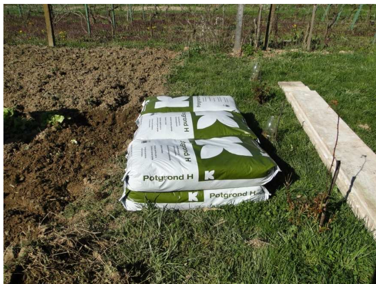
Slika 24. Klamann supstrat Potgrond H