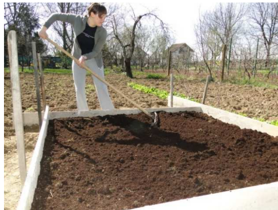
Slika 23. Ručna priprema tla