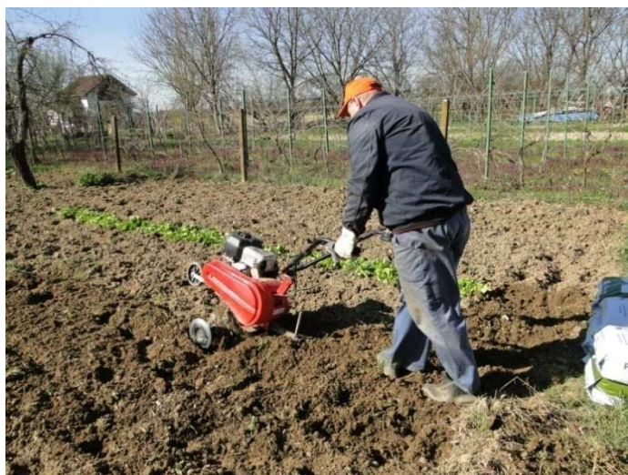
Slika 11. Obrada tla prije sjetve metvice