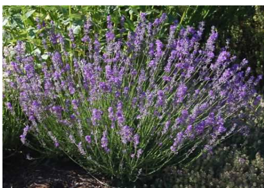
Slika 1. Lavanda

Porodica Lamiaceae je bogata fitokemijskim svojstvima te se mnoge vrste koriste kao ljekovite i začinske biljke. Biljke koje se koriste u narodnoj medicini i kao začini su: ljekovita kadulja ( Salvia officinalis L.) (Slika 3.), trava iva ( Teucrium montanum L.), bosiljak ( Ocimum basilicum L.), mažuran ( Majorana hortensis Moench), ružmarin ( Rosmarinus officinalis L.), origano ( Origanum vulgare L.), čubar ( Satureja hortensis L.), lavanda ( Lavandula angustifolia Mill.) (Slika 1.), timijan ( Thymus vulgaris L.), matičnjak ( Melissa officinalis L.) (Slika 2.) i metvica ( Mentha spicata L.) (Nikolić, 2013.).