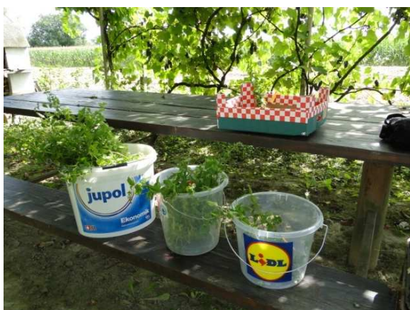
Slika 27. Metvica nakon berbe