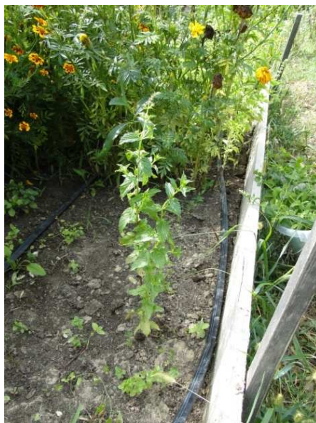
Slika 13. Navodnjavanje kap po kap

Prihranjivanje i navodnjavanje (Slika 13.) metvice je vrlo bitno za kvalitetu i količinu prinosa u uzgoju, prihranjivanje se obavlja 2 do 3 puta tijekom vegetacije. Naravno količina dušičnih gnojiva koja se najčešće unose za prihranu ovisi o analizi tla koja se obavi prije početka uzgoja. KAN se koristi za prvo i drugo prihranjivanje, prvo za vrijeme formiranja redova u količini od 100 do 150 kg/ha i drugo za vrijeme faze početnog grananja u količini od 120 do 150 kg/ha. Dušična gnojiva se koriste za vrijeme trećeg prihranjivanja nakon prvog otkosa u količini od 200 kg/ha (Stepanović i sur., 2001.).