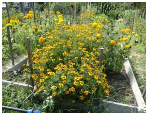
Slika 26. Kadifrica