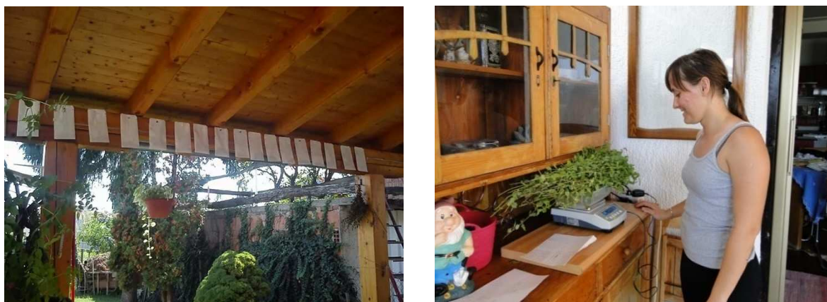
Slika 29. Sušenje metvice u papirnatim vrećicama i vaganje