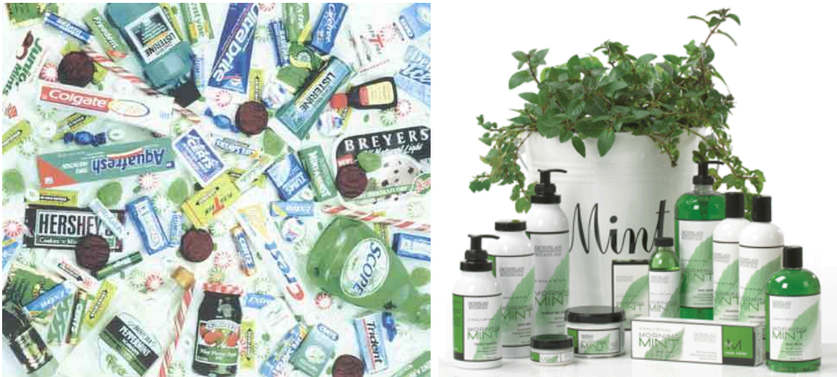
Slika 19. Proizvodi od metvice ( www.usmintindustry.org )