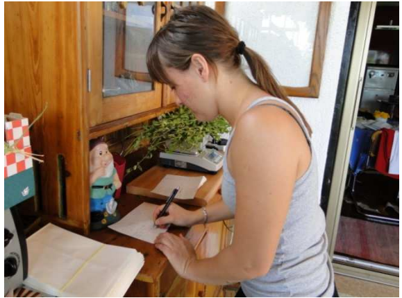
Slika 30. Električna vaga i vaganje svježe zeleni