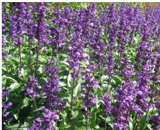
Slika 3. Kadulja

biti potpuno izloženi na donjoj usni ( Teucrium ), mogu biti skriveni ispod donje usne ( Lamium ) ili mogu ležati djelomice izloženi ( Coleus ). Pelud napušta biljku u obliku pojedinačnih zrna, a zrnca su trostanična ili dvostanična u vrijeme polinacije (Strasburger i sur., 1984; Nikolić, 2013; Bačić, 1995.).