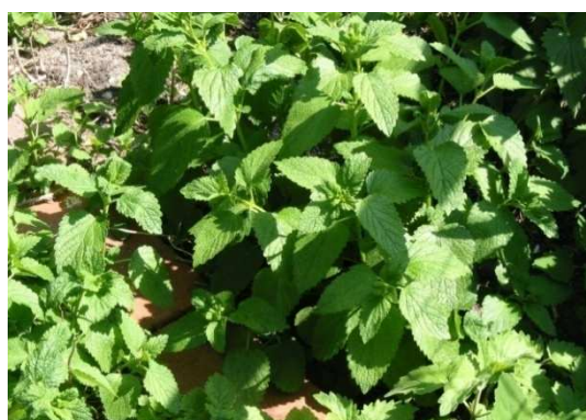
Slika 2. Matičnjak (www.bihusa.com)

Poznato je da porodica usnače ima oko 3500 vrsta unutar 210 rodova, a u Republici Hrvatskoj oko 230 vrsta unutar 37 rodova te je rasprostranjena u gotovo svim klimatskim područjima. Vrlo rijetko mogu biti penjačice ili drvenaste kulture (samo u Južnoj Americi) te su najčešće samostojeće zeljaste biljke (trajnice ili jednogodišnje), a ponekad mogu biti polugrmovi i grmovi. Ova porodica se vrlo lako prepoznaje po vegetativnim organima. Stabljika je četverobridna tj. kvadratnog presjeka s razvijenim uglastim potpornim staničjem tj. kolenhimom te ima spužvaste, čvrsta ili šuplja međukoljenca. Listovi su rjeđe pršljenasti, a češće nasuprotni s 3 do 10 listova na pršljenju i aromatskim mirisom. Pršljenasti listovi se