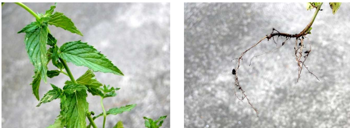
Slika 9. List i korijen klasaste metvice

Mentha spicata var. crispa je poznatija kao i kovrčava metvica, također visine 45 do 60 cm i blijedo ljubičastim cvjetovima u proljeće, listovi su naborani i jarkozelene boje sa nazubljenim rubom. Mentha spicata var. crispa "Moroccan" poznatija kao i marokanska metvica visine 45 do 60 cm sa bijelim cvjetovima ljeti i listovima jarko zelene boje (MacVicar, 2006.).