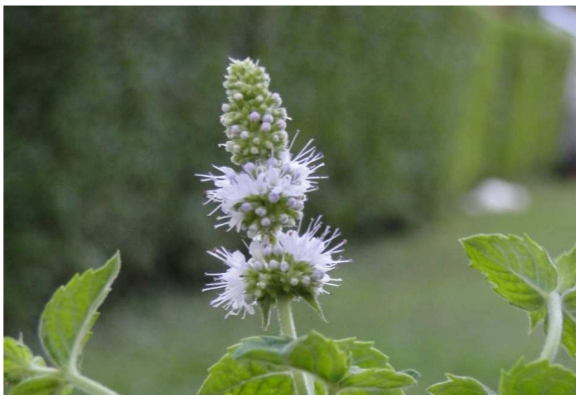
Slika 8. Cvijet paprene metvice

Miris ove vrste paprene metvice je slatkast i pikantan. Mentha piperita f. citrata "Lemon" je visine 45 do 60 cm, otporna je višegodišnja biljka, ljubičastih cvjetova i nazubljenih listova. Miris ove vrste paprene metvice je osvježavajući u kombinaciji metvice i limuna (MacVicar, 2006.).