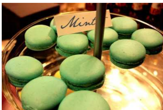
Slika 18. Sok i kolači od metvice