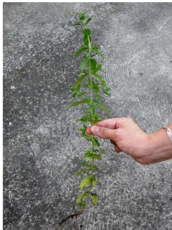
Slika 5. Mentha spicata L.