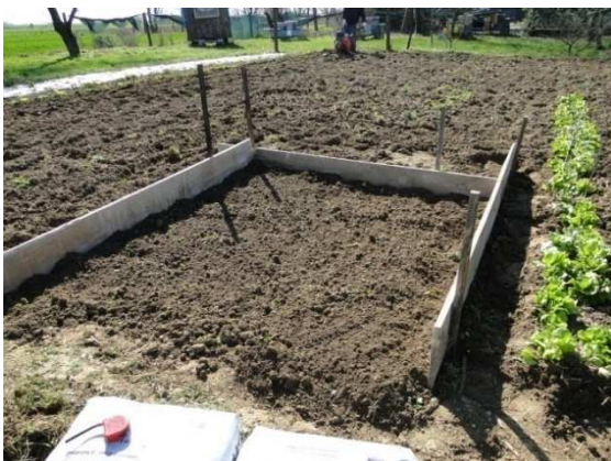
Slika 22. Tlo bez supstrata