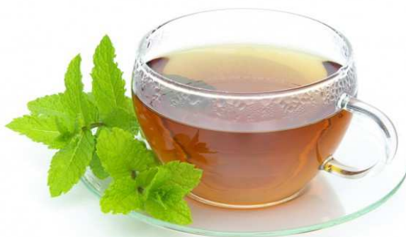
Slika 16. Čaj od metvice ( www.teamajesty.com )

sinusima. Drugi glavni sastojak je menton, a on daje snažan miris paprenoj metvici. 1,8 cineol pomaže kod kašlja, začepljenja dišnih puteva, problema sa sinusima i prehlade.