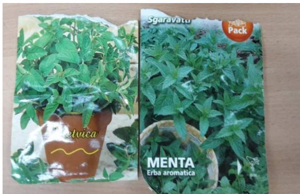
Slika 25. Vrećice sa sjemenom metvice

Berba i vaganje svježe zeleni (Slika 27.) je obavljena 12. kolovoza 2014. između 10 i 15 sati. Nakon određivanja svježe mase, biljke su stavljene na sušenje prirodnim putem. Osušena masa je vagana 25. kolovoza 2014. godine (Slika 30.) digitalnom vagom (Kern & Sohn), a metvica se prije toga sušila ispod nadstrešnice u sjeni i na vjetru u papirnatim vrećicama kako bi se sačuvala njena ljekovitost. (Slika 29.)