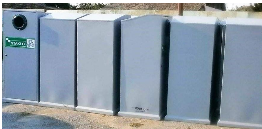
Slika 6. Spremnici za odvojeno prikupljanje stakla

Sastavni element funkcioniranja sustava su komunalna vozila za prijevoz otpada, sakupljenog od korisnika javne usluge prikupljanja miješanog i biorazgradivog komunalnog otpada, na odgovarajuća mjesta odlaganja, odnosno obrade istog.