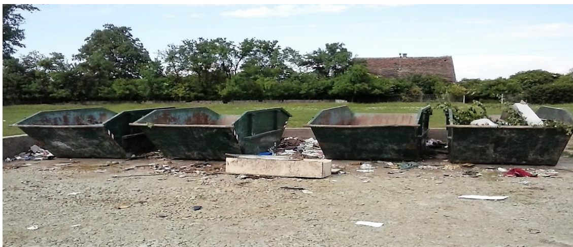
Slika 9. Kontejneri za odlaganje građevinskog otpada

Građevinski otpad na području Općine Erdut ne zbrinjava se na odgovarajući način. Gotovo polovica građevinskog otpada završi na odlagalištima komunalnog otpada, kao i divljim odlagalištima, što višestruko povećava troškove sanacije, zauzima korisni volumen odlagališta i nove površine. Slika 5. prikazuje kontejnere za odlaganje građevinskog otpada na odlagalištu.