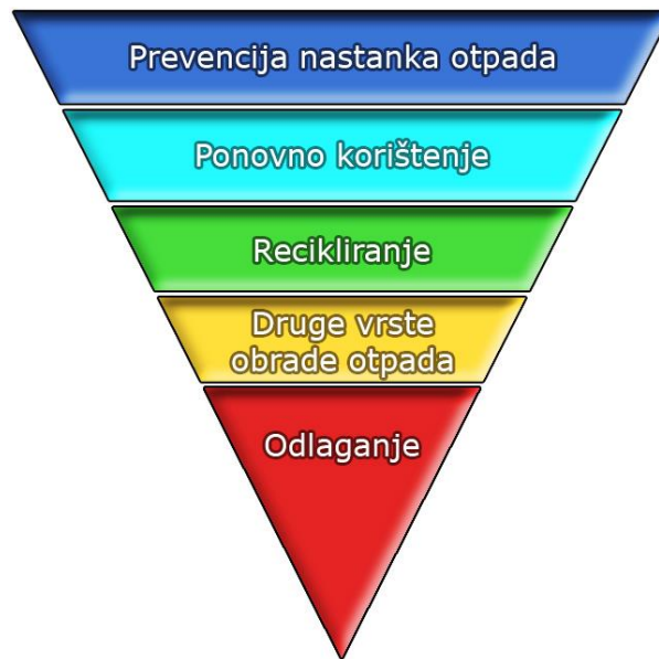
Slika 3. Red prvenstva gospodarenja otpadom

( http://www.mariscina.com/wp-content/uploads/2012/12/hijerarhija_otpada_Slika_Bojan_Banjac.jpg )