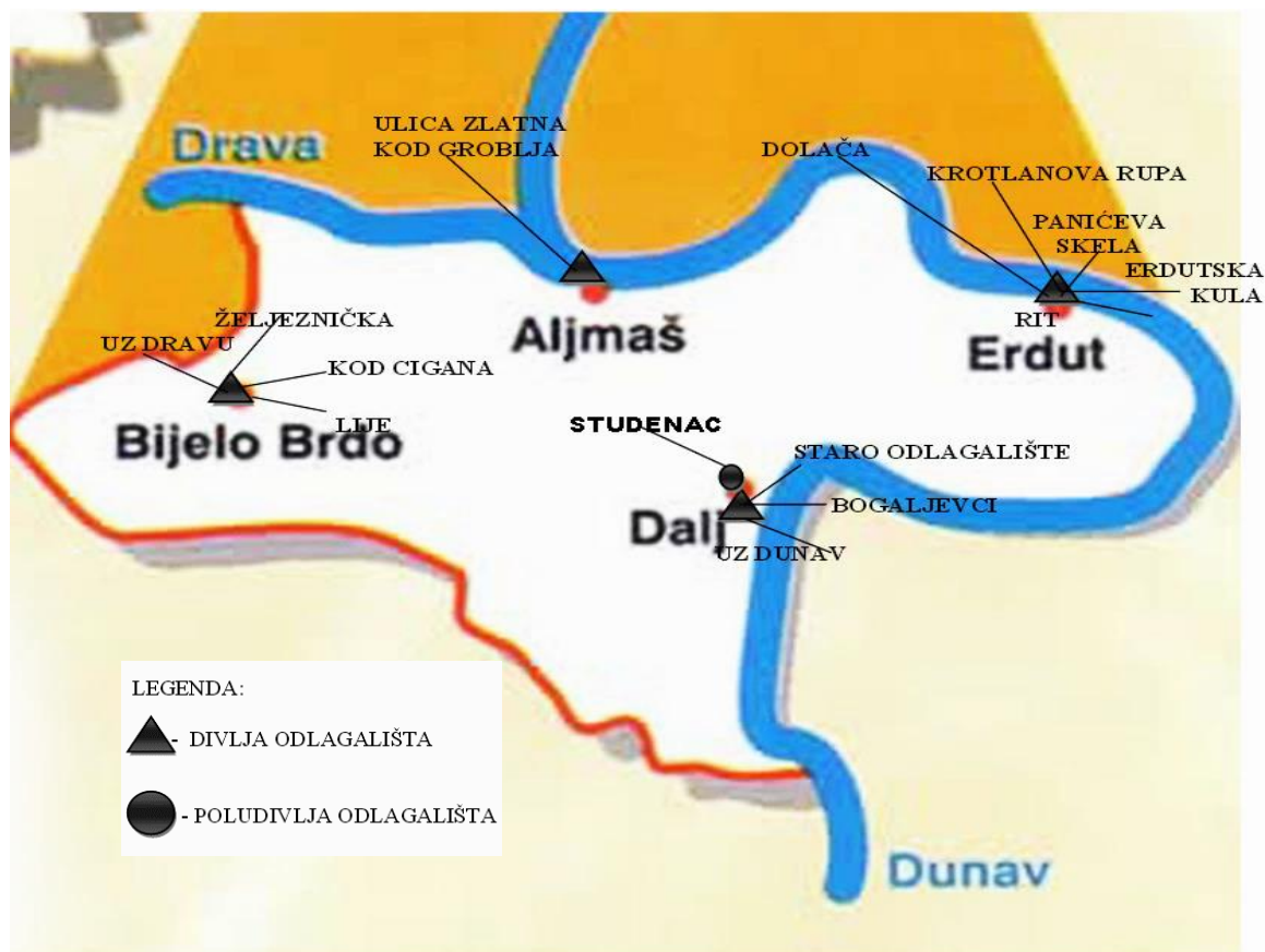
Slika 8. Lokacije divljih i poludivljih odlagališta u općini Erdut

Poludivlja odlagališta najčešće su manji neuređeni prostori za odlaganje otpada i nisu predviđeni odgovarajućim prostorno-planskim dokumentima za koje nije proveden postupak procjene utjecaja na okoliš. Ne raspolažu nijednom od dozvola, ali za razliku od divljeg odlagališta djeluju uz znanje ili u dogovoru s nadležnim tijelom. Velika su prijetnja onečišćenju okoliša, tla, vode, zraka kao i ljudskome zdravlju i drugim živim organizmima. Primjer poludivljeg odlagališta je "Studenac", označeno na slici 8.