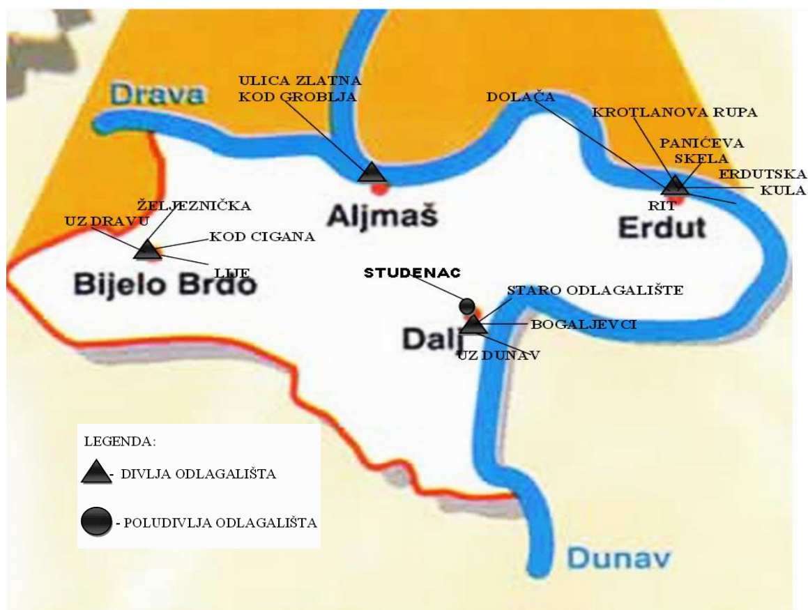
Slika 8. Lokacije divljih i poludivljih odlagališta u općini Erdut

Poludivlja odlagališta najčešće su manji neuređeni prostori za odlaganje otpada i nisu predviđeni odgovarajućim prostorno-planskim dokumentima za koje nije proveden postupak procjene utjecaja na okoliš. Ne raspolažu nijednom od dozvola, ali za razliku od divljeg odlagališta djeluju uz znanje ili u dogovoru s nadležnim tijelom. Velika su prijetnja onečišćenju okoliša, tla, vode, zraka kao i ljudskome zdravlju i drugim živim organizmima. Primjer poludivljeg odlagališta je "Studenac", označeno na slici 8.