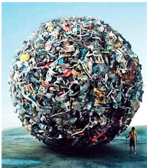
Slika 1. Otpad - jedan od glavnih problema suvremene civilizacije

Otpad je, dakle, jedan od glavnih problema suvremene civilizacije i središnji problem zaštite okoliša, budući da su kapaciteti naše planete ograničeni, zahtjevi za prirodnim resursima sve veći, a mogućnosti prirodnog apsorbiranja emisija i svih vrsta otpada sve manje. Stoga se s pravom može reći da se Zemlja pretvara u planetu otpada, simbolično prikazanu na slici 1.