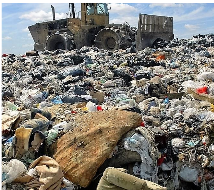
Slika 2. Odlagalište otpada

Čovjek u svom svakodnevnom životu stvara velike količine različitih vrsta otpada koje su se uglavnom, vrlo često i nekontrolirano, odbacivale na odlagališta otpada koja su zatim postala veliki problem za rješavanje kao što je prikazano na slici 2.