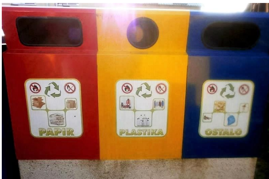
Slika 5. Spremnici za odvojeno prikupljanje papira, plastike i ostalog otpada