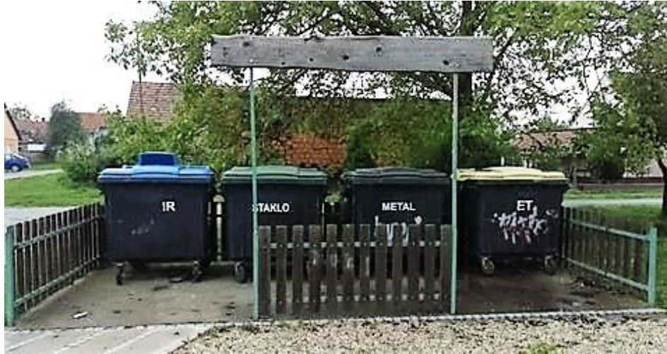
Slika 11. Zeleni otok u Općini Erdut