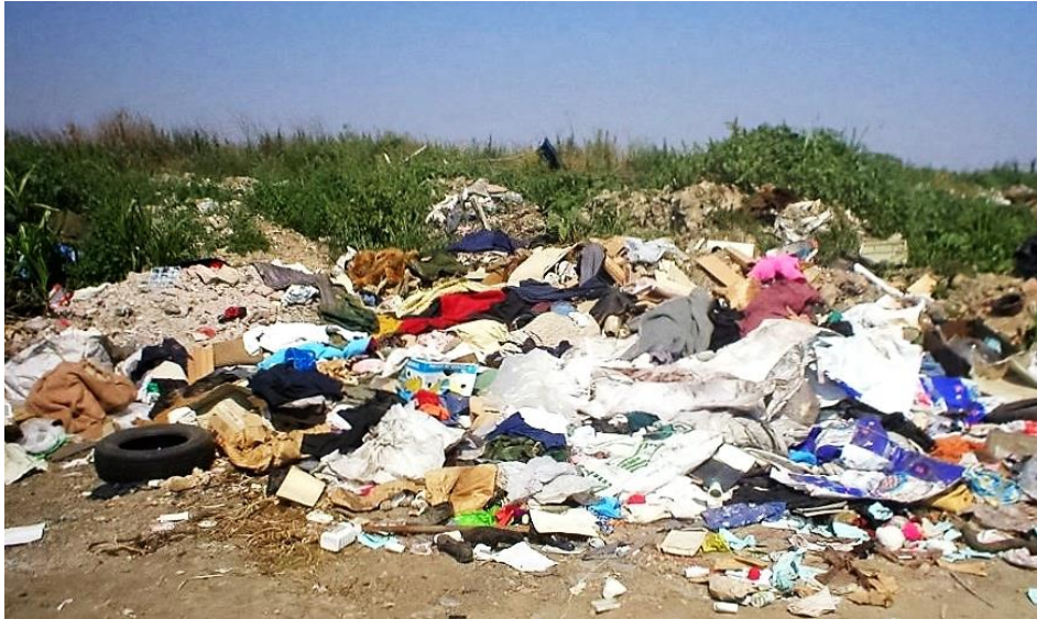
Slika 12. Divlje odlagalište otpada u općini Erdut

Planom sanacije divljih odlagališta obuhvaćeno je sljedeće: