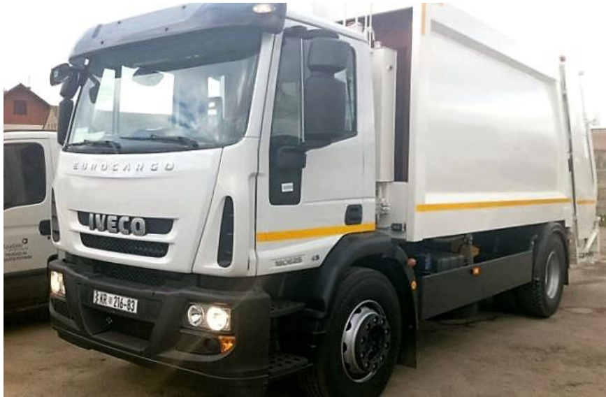
Slika 7. Kamion za odvoz otpada u Općini Erdut