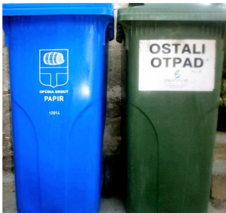
Slika 4. Posude za skupljanje papira i komunalnoga otpada u kućanstvima

Na slici 4. prikazane su posude za skupljanje papira i komunalnoga otpada u kućanstvima.