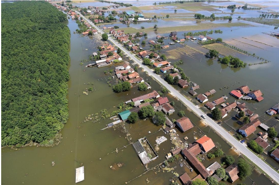
Slika 10. Poplava u županjskoj Posavini 2014. godine

( http://rijeka.meteoadriatic.net/obiljezana-godisnjica-katastrofalne-poplave-u-zupanjskoj-posavini/ )