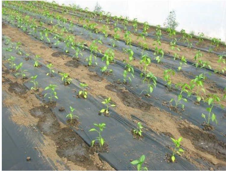
Slika 6. Navodnjavanje paprike

prinosu i u hidrološki povoljnijim godinama kao što je bila 2005. Navodnjavanje je posebno poželjno u povrtlarskoj proizvodnji (Slika 6.).