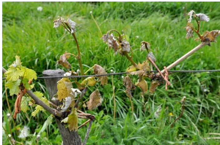
Slika 2. Šteta načinjena pojavom mraza na vinovoj lozi

Advektivno-radijacijski mrazevi javljaju se uslijed prodora hladnog zraka i hlađenja zemljine površine tijekom vedre noći, odnosno uslijed djelovanja dva fizička procesa, a to su advekcija i radijacija.