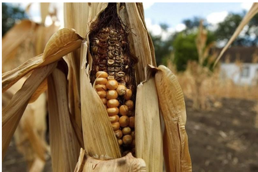
Slika 4. Šteta na kukuruзу izazvana sušom i visokim temperaturama ( http://www.uskinfo.ba/vijest/stete-zbog-suse-u-bih-iznose-800-miliona-km-dugotrajna-susumanjila-urod-kukuruza-i-u-usk-u/14868 )