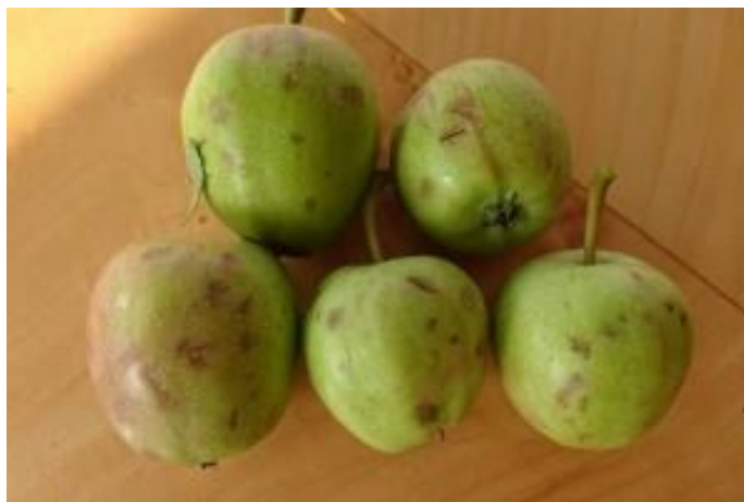
Slika 9. Šteta od tuče na plodu jabuke ( http://www.agroklub.com/vocarstvo/led-unistio-jabuke-steta-i-do-50-posto/25952/ )

tuče i rast tuče do konačne veličine se odvija u različitim uvjetima i stoga u različitim dijelovima oblaka. Provođenju akcije treba pristupiti selektivno za svaki pojedini Cb, imajući u vidu povijest oblaka i pravilno određujući vrstu Cb-a. Područje zasijavanja treba biti područje stvaranja zametaka tuče. Bitna stavka kod raketa je da njima upravljaju za to obučene osobe, jer u protivnom dolazi do ozljeda i nepoželjnih posljedica.