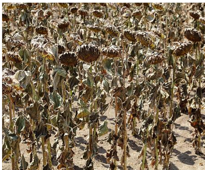
Slika 5. Izgled suncokreta nakon ljetne suše

Ljetnu sušu odlikuje niska vlažnost zraka i visoke temperature. Isušuje tlo, uvjetuje isušivanje listova i smanjuje fotosintetsku aktivnost biljaka (Slika 5.). Štetno djelovanje ljetne suše ovisi o: fazi razvoja biljke, otpornosti biljaka na sušu i zalihama vlage u tlu. U manjoj ili većoj mjeri smanjuje prinos poljoprivrednih kultura. Jesenska suša utječe na sjetvu, klijanje i nicanje ozimih kultura. U takvim uvjetima nicanje kasni, pa biljka u zimsko razdoblje ulazi nerazvijena, a samim tim joj je otpornost i tolerancija na niske temperature umanjena. Zimska suša ne omogućuje stvaranje dovoljne zalihe zimske vlage, koja je u proljeće neophodna za razvoj kako ozimih, tako i jarih kultura, (Otošec, 1980.).