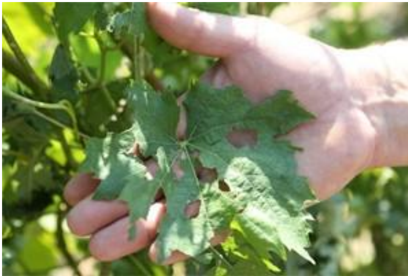
Slika 8. Šteta od tuče na vinovoj lozi ( http://www.agroklub.com/poljoprivredne-vijesti/tuca-ostetila-vinograde-i-vocnjake/7210/ )

Tuča je važan ekonomski problem u većini europskih zemalja, a javlja se u ljetnom periodu godine (Slika 8. i Slika 9.). To je kruta oborina sastavljena od zrna ili komada leda, promjera većeg od 5 mm, a nastaje isključivo u cumulonimbusima (Cb), grmljavinskim oblacima vertikalnog razvoja. Do pojave tuče dolazi u toplom dijelu godine kada su prisutne visoke temperature zraka, a u višim slojevima atmosfere se nalazi hladniji i vlažniji zrak. Nastaje tako što kišne kapi prolaze kroz hladni dio oblaka, te dolazi do smrzavanja kapljica i stvaranja kuglica leda. Ako nastale kuglice leda dospiju u jaku uzlaznu struju u olujnom oblaku, tada ih ta struja zajedno sa kišnim kapima opet podiže u najviši dio olujnog oblaka. Tog trenutka kišne kapi se lijepe na kuglice leda povećavajući njen obujam. Proces se može ponoviti više puta, a kada uzlazne struje više ne mogu zadržati težinu kuglica leda, kuglice napuštaju uzlaznu struju i padaju na tlo gdje redovito uzrokuju štetu na poljoprivrednim površinama.