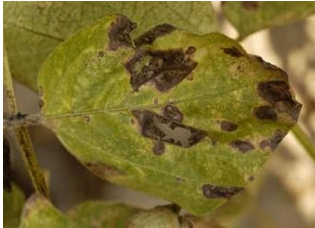
Slika 1. Deformacije na listu izazvane stresnim faktorom ( http://ritamsela.rs/poljoprivreda/vocarstvo/i-biljke-su-podlozne-stresu/ )

Aklimatizacija je prilagođavanje jedinke izmjenjenim uvjetima sredine, a bazira se na pomjeranju homeostaze, (Nešković i sur., 2003.).