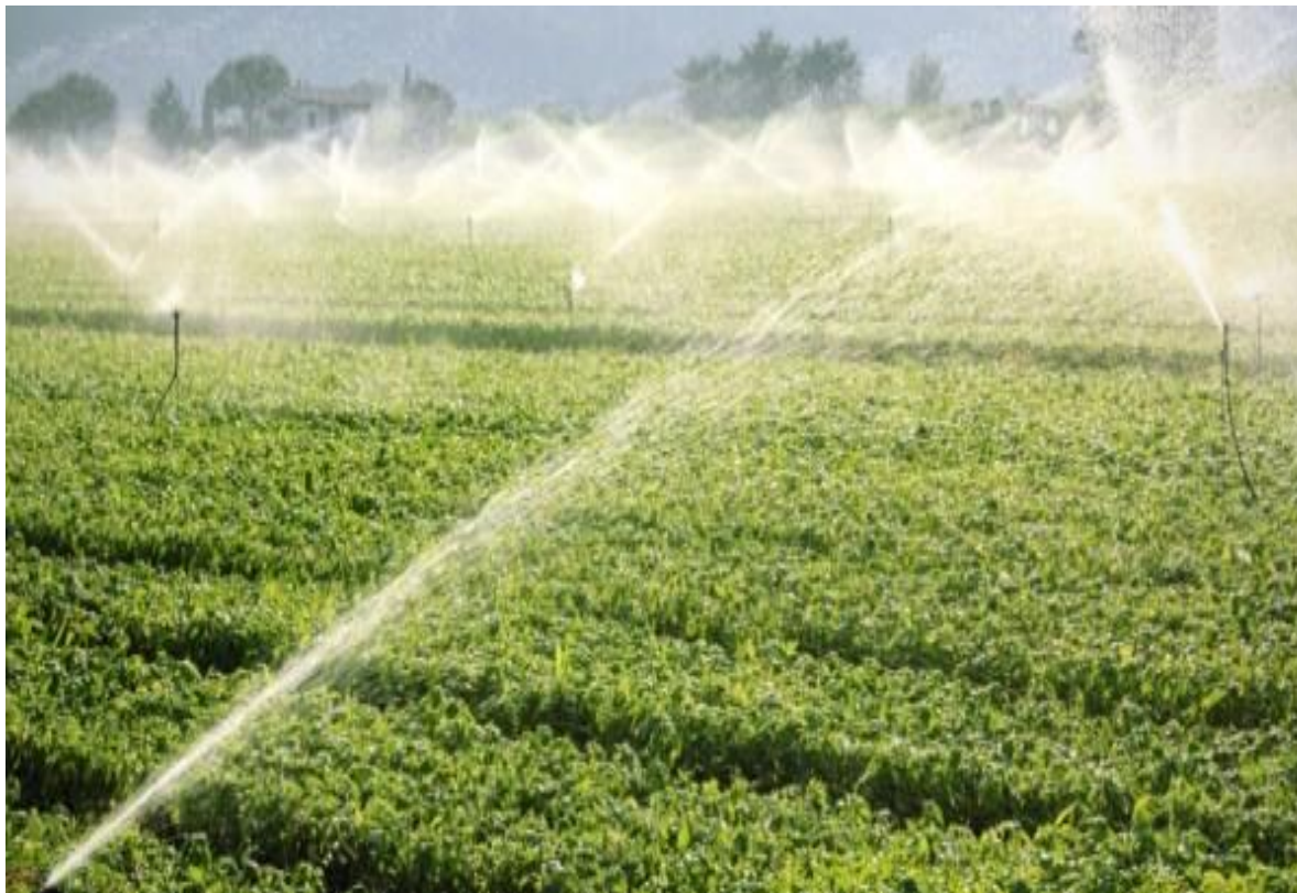
Slika 7. Sustavi navodnjavanja u Vukovarsko-srijemskoj županiji ( http://www.agroportal.hr/vijesti/20815 )

vitamina, kao i folijarna gnojidba kalcijem. Sve pripravke poželjno je koristiti preventivno prije nastupanja visokih temperatura i nedostatka vode, kako bi biljke u stresnim uvjetima imale više energije za preživljavanje.