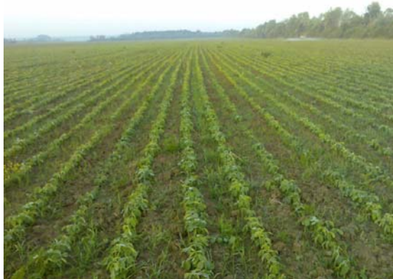
Slika 4. Soja sorte „Ika“ ( http://www.poljoprivredni-forum.biz/t953-sjetva-soje-2009 )

Slika 4. prikazuje sortu soje „Ika“ koja uspijeva na oranicama obiteljskog poljoprivrednog gospodarstva „Matinac Josip“. Soja sorte „Ika“ ubraja se u srednje ranu sortu (0-I grupe zriobe) koja je najraširenija u Republici Hrvatskoj. Vodeća je po površinama, ali i po urodu zrna. Visina ove sorte soje je otprilike oko 100 centimetara. Ističe se po tome što je bogata bjelančevinama i uljem. Stabljika „Ike“ je jako čvrsta i zbog toga je otporna na polijeganje. Osim toga, ova sorta soje ima toleranciju na glavne bolesti u usporedbi s ostalim sortama soje koje su slabije otporne na bolesti. Optimalni sklop je 580-600 000 biljaka/ ha. Vrijeme koje je pogodno za sjetvu sorte soje, „Ike“ je krajem travnja.