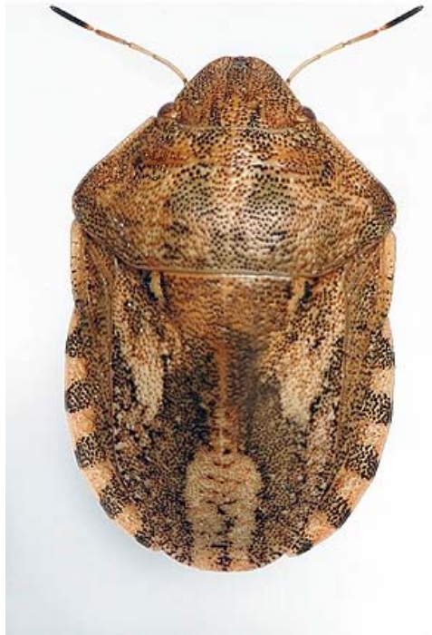
Slika 18. Žitna stjenica

( http://agronomija.rs/wp-content/uploads/2013/11/Eurygaster-maura-zitna-stenica.jpg )