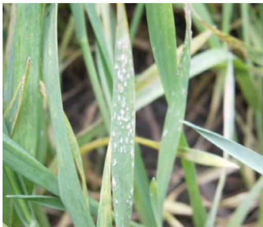
Slika 14. Pepelnica

( http://www.pisvojvodina.com/RegionVSS/Lists/Photos/P%C5%A1enica/_w/Pepelnica%2031.03.jpg.jpg )