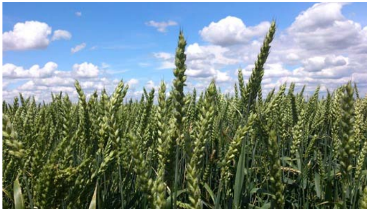
Slika 12. Pšenica sorte Graindor ( http://www.bioizvorb.rs/slike/novosti/nov8.jpg )

Na obiteljskom poljoprivrednom gospodarstvu „Matinac Josip“ zastupljene su dvije sorte ozime pšenice, a to su Graindor i Kraljica. Graindor (Slika 12.) je visoko prinosna krušna pšenica proizvođača „RWA“. Na ovom OPG-u uvedena je u uporabu 2014. godine. Visina stabljike je oko 92 cm, vrlo dobre otpornosti na polijeganje. Ima relativno dobru toleranciju na hrđe i fuzarioze. Dobre je otpornosti na proklijavanje, hektolitarska težina je prosječna do visoka, a masa tisuću zrna iznosi oko 42 grama.