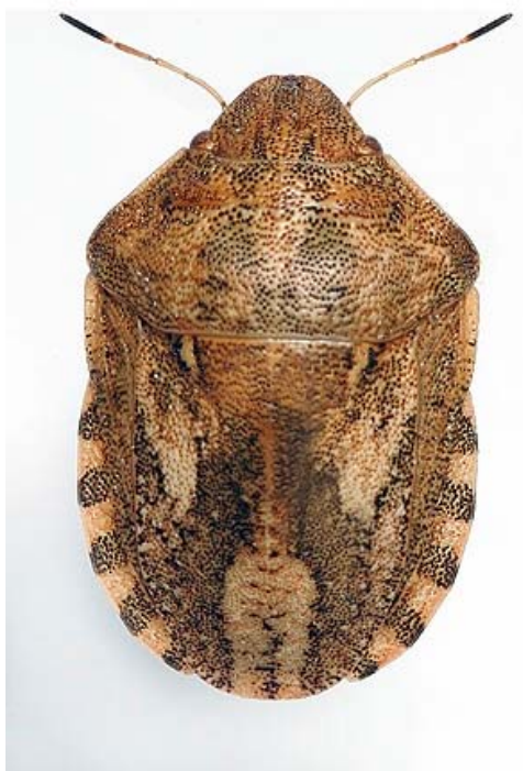
Slika 18. Žitna stjenica

( http://agronomija.rs/wp-content/uploads/2013/11/Eurygaster-maura-zitna-stenica.jpg )