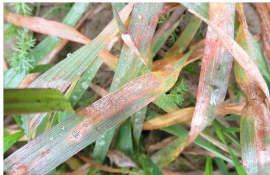
Slika 16. Smeđa pjegavost lista

Slika 15. prikazuje žutu hrđu pšenice koja se u 2015. godini pojavila na obiteljskom poljoprivrednom gospodarstvu „Matinac Josip“. (Slika 15.) uzročnik se pojavio na zelenom listu jer samo na njemu može i opstati, a utvrđena je na parceli „Dilein stan“. Za suzbijanje bolesti upotrijebljen je fungicid Amistar 250 SC tretiranje je obavljeno (07.05.2015.).