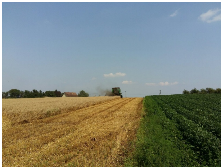
Slika 19. Žetva pšenice 2015. godine na OPG „Matinac Josip“ 1

Kod žetve pšenice treba pripaziti da se skida u fiziološkoj zrelosti zrna pri vlazi 13-14%. Žetva pšenice počela je 8. srpnja na parceli „Dilein stan“, a završila 10. srpnja na parceli „Pod brdom“ (Slika 19. i 20.). Očekivani prinos je bio zadovoljavajući i iznosio je 5,75 t/ha.