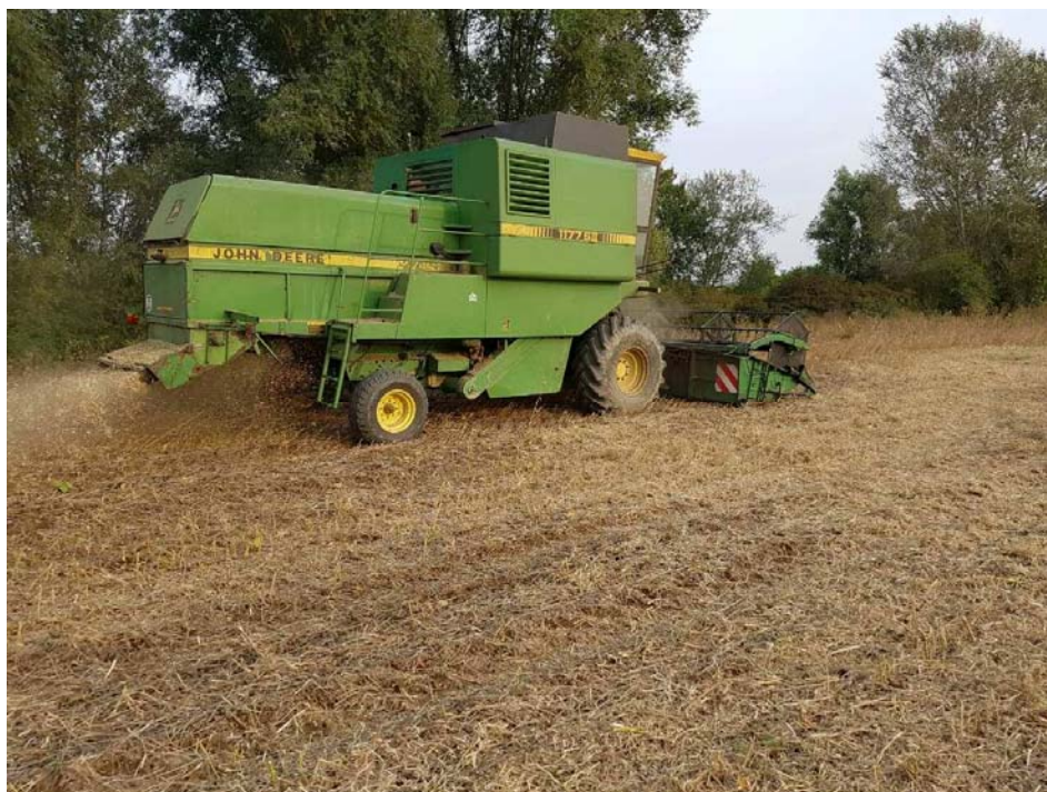
Slika 9. Žetva soje na OPG „Matinac Josip“

Osnovni cilj u uzgoju i proizvodnji soje je dobivanje visokih prinosa, zato je veoma važno odrediti pravi trenutak za žetvu. Žetva soje mora biti pravovremena jer ukoliko se vrši vlažna (više od 14% vlage), može doći do povećanja troškova proizvodnje, zbog dodatnog sušenja. Ako se zakasni sa žetvom i sjeme se previše osuši, može se dogoditi da dođe do većih gubitaka zbog pucanja mahuna te rasipanja zrnja po polju usred same žetve. Žetva soje na OPG „Matinac Josip“ obavljena je početkom rujna (Slika 9.) vlaga sjemena na parcelama je iznosila 12,2-13,3%. Prosječni prinos svih 5 parcela iznosi 2,5 t/ha (Tablica 2.).