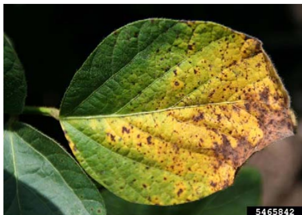
Slika 6. Smeđa pjegavost soje

Slika 6. Prikazuje bolest soje koja se pojavila na obiteljskom poljoprivrednom gospodarstvu „Matinac Josip“ u 2015. godini. Bolest je poznata pod nazivom smeđa pjegavost soje ( Septoria glycines ) koja se pojavila na manjem broju biljaka. Simptomi karakteristični za smeđu pjegavost soje su male smeđe pjege koje se spajaju a moguće je sušenje donjih listova. Na obiteljskom poljoprivrednom gospodarstvu „Matinac Josip“ bolest je uočena sredinom srpnja. Iako se ova bolest pojavila na OPG „Matinac Josip“, nije zabilježena veća zaraza obzirom da su članovi „OPG Matinac Josip“ koristili tolerantnije sorte, duboko zaoravali zaražene žetvene ostatke i vodili računa o plodoredu.