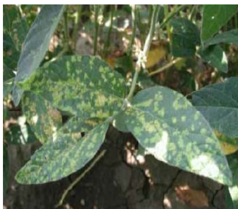
Slika 5. Plamenjača na listu soje

Dvije su se bolesti pojavile na obiteljskom poljoprivrednom gospodarstvu „Matinac Josip“ tijekom 2015. godine. Prva i u najvećoj mjeri je plamenjača ( Peronospora manshurica ) (Slika 5.), a druga bolest poznata je pod nazivom smeđa pjegavost ( Septoria glycines ).