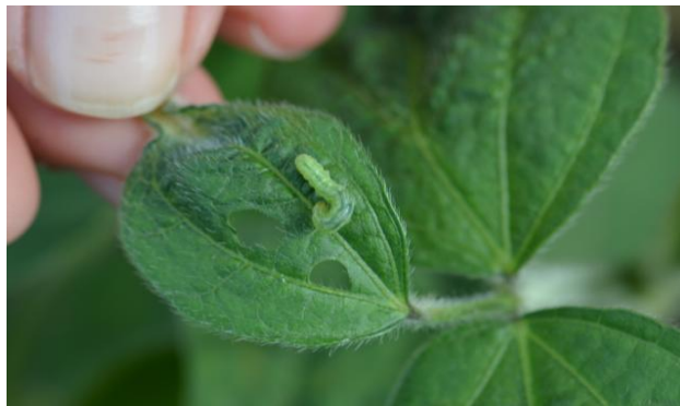
Slika 7. Lisne sovice na soji

Najveću štetu na soji mogu prouzročiti lucernina sovica, sovica gama, kupusna sovica, i druge vrste sovica (Pinova.com). Tijekom 2015. godine na obiteljskom poljoprivrednom gospodarstvu „Matinac Josip“, uočen je štetnik lisna sovica (Slika 7.) i obavljene su mjere suzbijanja. Za suzbijanje lisnih sovica koristio se insekticid „Nurelle D“ u koncentraciji 1-1,5 l/ha dana (17.08.2015.).