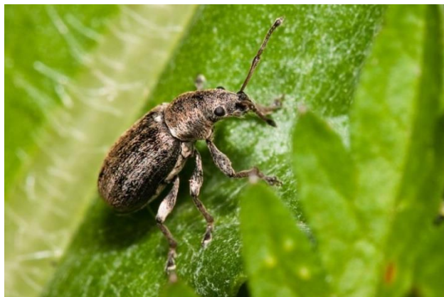
Slika 5. Pipa mahunarka

Prezimljuju odrasle pipe na površinama gdje su bile ili se još uvijek nalaze mahunarke, te u rano proljeće izlaze i izgrizaju lišće mahunarki te stvaraju polumjesečne ureze na listu. Štete su velike pošto odraslim oblicima treba dosta hrane kako bi spolno sazreli. Najčešće su to štete na grašku, grahu, lucerni, djetelini i drugim mahunarkama. Što je biljka mlađa, štete su veće. Ženka odlaže negdje oko tisuću jaja u tlo ili na biljku. Ličinke prodiru do korijenja i žive u bakterijskim kvržicama, a njihov razvoj traje od 30-45 dana. Kada je vrijeme toplije, ženka odlaže više jaja, a ličinke se intenzivnije hrane. Mlade pipe javljaju se potkraj kolovoza i u rujnu te odlaze na prezimljavanje (Maceljski i Igrc-Baričić, 1999). Imaju jedno pokoljenje godišnje.