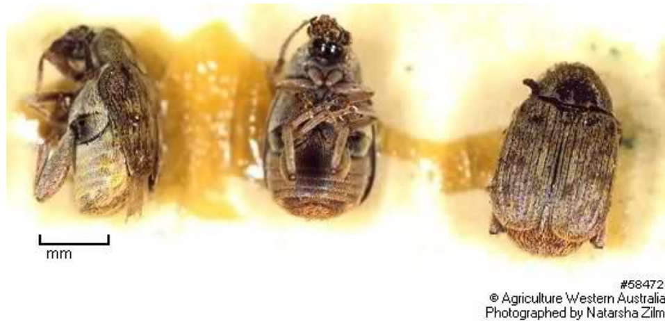
Slika 6. Grahov žižak (izgled odraslog kukca)

Isto tako zarazu se može potpuno uništiti i zagrijavanjem na oko 65^{\circ}\text{C} tijekom 4 sata.