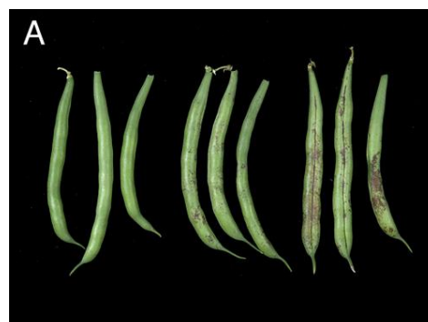
Slika 13. Alternaria alternata na mahunama