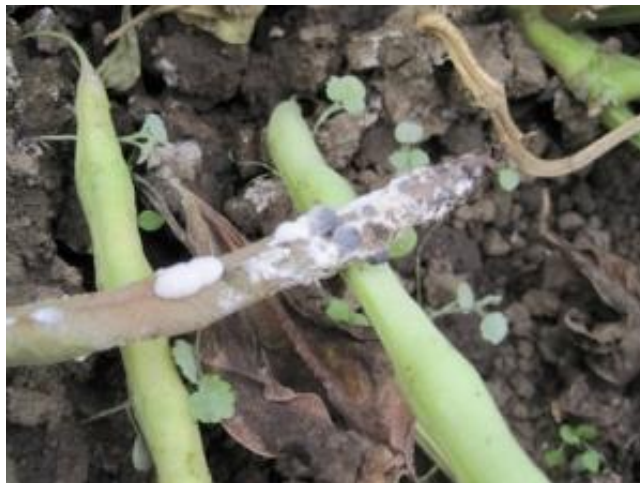
Slika 12. Bijela trulež graha

Preventivno djelovati što se tiče plodoreda i upotrebe zdravog (tretiranog) sjemena. Ne sijati pregusto. Prskati sistemčnim fungicidima.