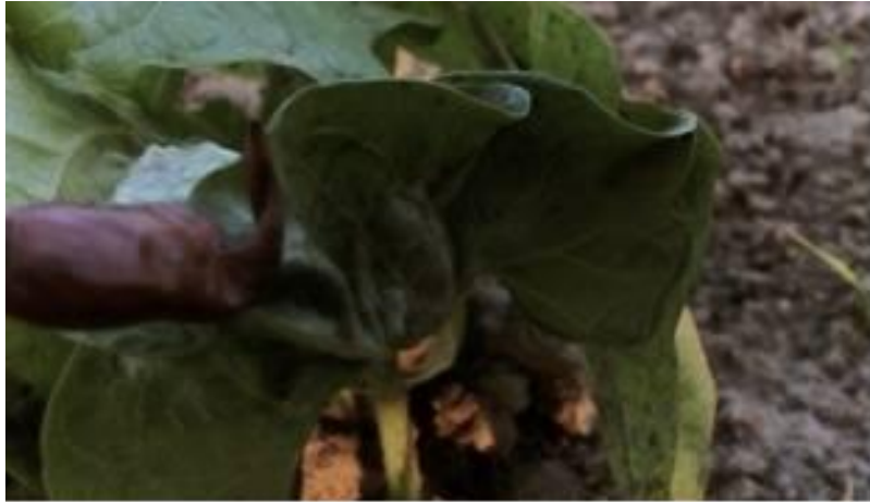
Slika 18. Kovrčavost listova