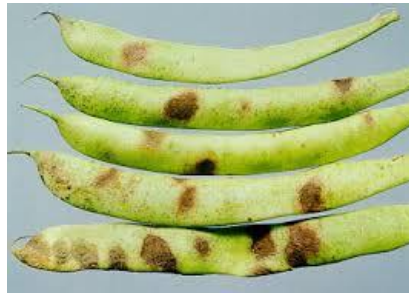
Slika 11. Uglata pjegavost mahune