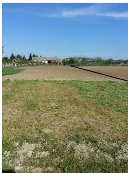
Slika 17. Obradiva površina u 2016. godini

Nakon što se grah posušio sjemenke smo izvadili iz mahuna te ručno prebirali one koje su zdrave. Te smo ga stavili na duboko zamrzavanje.