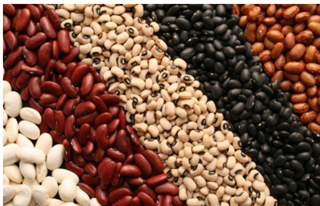
Slika 1. Sjemenka graha

Grah je vrlo ljekovita biljka, smatra se da štiti od raka, smanjuje količinu šećera u krvi i mokraći, jača imunitet, regulira krvni tlak itd.