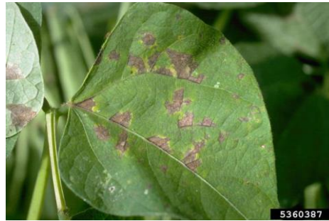
Slika 10. Uglata pjegavost lista

Koristiti sjeme koje ne sadrži patogene i sjeme koje je otpornije na ovu bolest. Plodosmjena svake 2 godine, saditi sjeme u dobro drenirana tla na kojima se prethodno obavilo dubinsko zaoravanje biljnih ostataka i na kojima su spaljeni i uništeni biljni ostaci.