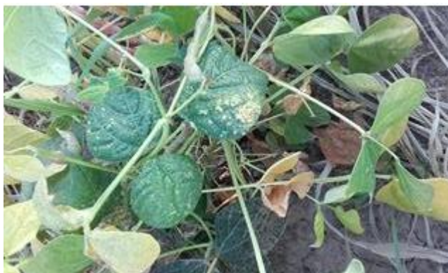
Slika 16. Grah zaražen virusom običnog mozaika

Najvažnija je sjetva zdravog sjemena, odnosno sjeme koje ne sadrži ovaj virus, također je važno koristiti otporne kultivare. Prilagoditi vrijeme sadnje graha kako bi se smanjila pojava lisnih ušiju. Sijati dalje od biljnih vrsta koji su domaćini tog virusa (bob, crnookica, gladiola i dr.). Uništiti sve zaražene biljke.