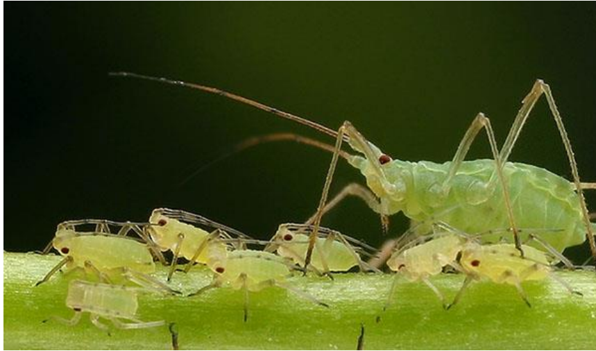
Slika 4. Zelena graškova lisna uš (žutozelena)

Tijelo zelene graškove uši je bez pjega i ima vrlo duge sifone i ticala. Polifag je, no većinom napada leprinjače. Kod nas se masovno javljaju na grašku, bobu, leći, grahu, djetelini i lucerni. Izravne štete nanosi sisanjem biljnih sokova te kod jačeg napada izaziva velike štete. Neizravne štete kao i sve biljne uši nanosi prenošenjem virusnih bolesti. Prenosi više od 30 perzistentnih i neperzistentnih virusa (Maceljčki i Igrc-Baričić, 1999).