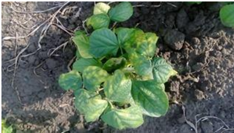
Slika 19. Bakterijska prstenasta pjegavost