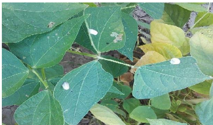
Slika 7. Puževi na grahu (Foto: Beti, A. 2016).