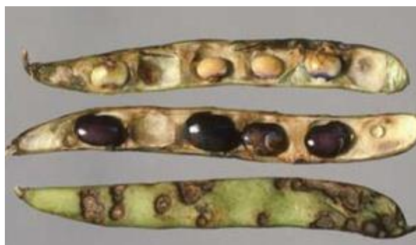
Slika 9. Antraknoza u mahuni

Koristiti sjeme koje nije zaraženo te koristiti sjeme koje je otpornije ako ga ima. Dozvoljeni fungicidi u nas ne daju sigurne rezultate, zato bi nakon žetve trebalo spaliti biljne ostatke, te trebalo bi uvesti dvogodišnji ili trogodišnji plodored. U sjemenskim usjevima treba se tretirati tri puta, početkom cvatnje, u punoj cvatnji i u vrijeme punjenja mahuna.