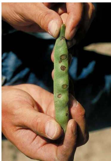
Slika 15. Mahuna zaražena bakterijom Pseudomonas syringae pv. phaseolicola

Preventivno djelovati koristeći sjeme koje je zdravo i koje je kemijski tretirano. Prskati sredstvima na bazi bakra svaki tjedan nakon što se pojave prvi simptomi bolesti, osobito kada je vrijeme pogodno za širenje i razvoj bolesti.