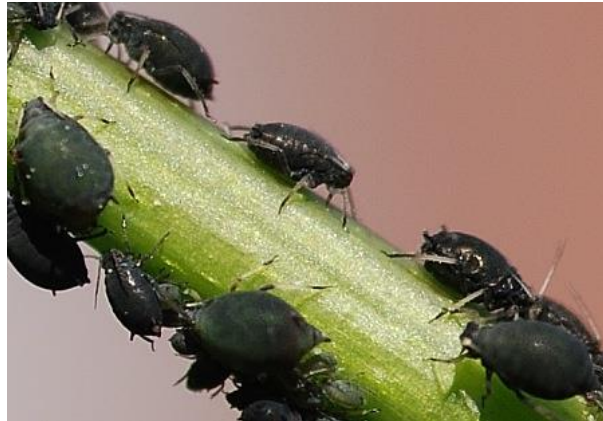
Slika 3. Crna bobova uš na stabljici

Determinacija je vrlo teška i ovisi o većem broju morfoloških karakteristika (Maceljski i Igrc-Baričić, 1999).