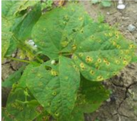
Slika 8. Hrđa graha