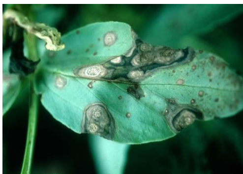
Slika 14. Koncentrične lezije na listu