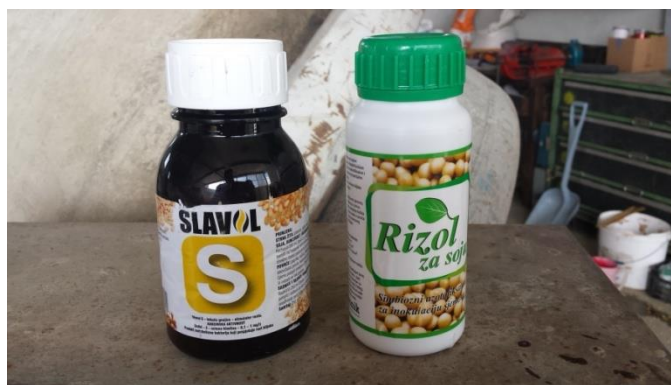
Slika 3. Poboljšivači za inokulaciju sjemena (Izvor: Marin Garac)

Za uspjeh bakterizacije važno je da što veći broj bakterija preživi na inokuliranom sjemenu dok sjeme ne pusti korjenčić na koji će se one naseliti. O bakterizaciji ovisi puno faktora kao što su: sam postupak izvođenja bakterizacije i sjetve, pH tla, opskrba tla hranivima, agrotehnika, biološka svojstva sorte, problem nematoda, primjena pesticida, gnojidba mikro i makroelementima. Biljke soje na kojima su dobro razvijene kvržice sposobne su za dobro razvijanje listova zelene do tamnozeleno boje.