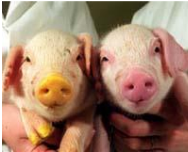
Slika 1. Transgene svinje za uzgoj pluća

na svinje, to će osigurati visoko učinkovitost i jednostavan način proizvodnje. ICSI-posredovana metoda može biti od velike koristi za kombiniranje gena korištenjem in vitro sazrelih (IVM) jajnih stanica, jer to bi uvelike smanjilo troškove i pojednostavilo proceduru. Ako je moguća, povećana dostupnost svinjskog transgena olakšati će širenje praktične vrijednosti transgenih svinja. Transgeneza od ICSI metode nudi nove tehnološke mogućnosti u transgenih svinja u svinjogojstvu.