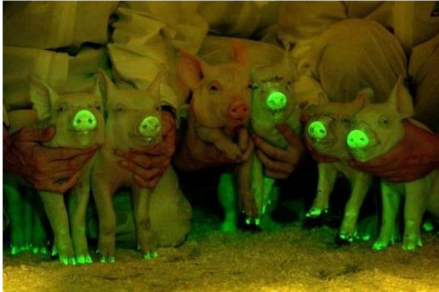
Slika 3. Svinje kod kojih je izražen multi-fluorescentni gen ( http://www.buzzfeed.com/alisonvingiano/scientists-in-china-made-glow-in-the-dark-pigs#.aeJ4Oqw9z )