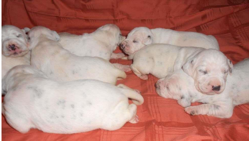
Slika 6. Štenci dalmatinskog psa