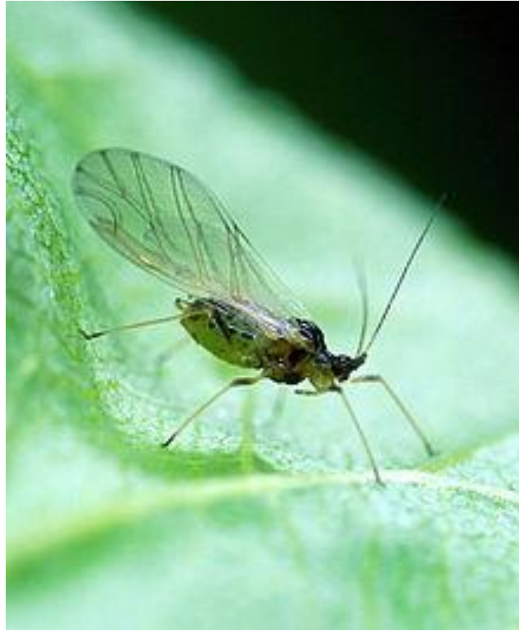
Slika 7. Lisna uš

Lisne uši su polifagni štetnici te napadaju veliki broj različitih biljaka između ostalog i rajčicu. Uši su žutozelene do maslinastozelene boje, duljine 1,2-2,3 mm (Slika 7.) (Maceljski, 2002). Nalaze se na listu gdje sišu biljne sokove. Lisne uši su vektori brojnih virusa te kao takve mogu pričiniti velike štete. U zatvorenim prostorima preporučuje se biološko suzbijanje predatorima i parazitima, te bioinsekticidima.