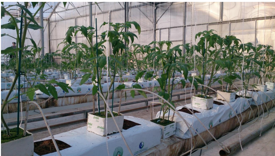
Slika 17. Sadnice rajčice u kockama kamene vune (foto original)

Pokus je bio postavljen u plasteniku za hidroponski uzgoj na OPG Vidaković u dvije varijante. Varijanta LED se sastojala od 40 biljaka (4 ponavljanja x 10 biljaka) koje su bile dodatno osvijetljene LED lampama u periodu od 12.1.2015. do 4.5.2015. Uz prirodnu dužinu dana, isti je bio produljen na maksimalno ukupno 16 sati tijekom cijelog istraživanja (16 sati dan, 8 sati noć). Varijanta NO LED se sastojala od 40 biljaka (4 ponavljanja x 10 biljaka) koje nisu bile dodatno osvijetljene. Kod obje varijante broj plodova na prve tri etaže je reduciran na pet plodova po cvjetnoj grani. Lampe proizvode 120 000 lumena svjetlosne energije pri maksimalnoj snazi. Opremljene su plavim i crvenim diodama a spektar im je 440 - 460 nm (plavo), i 650- 670 nm (crveno). Prosječna potrošnja im je 0,4 kW/h električne energije.