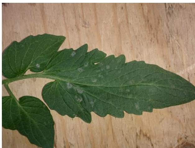
Slika 9. Simptomi pepelnice na listu rajčice

Prvi simptomi zaraze javljaju se u obliku žućkastih pjega na gornjoj strani listova. Na mjestu pjega mogu se pojaviti prljavo bijele prevlake – konidije (Slika 9). Kod jačeg napada lišće žuti i uvija se, nakon čega se suši, kod paprike otpada, a kod rajčice ostaje visjeti na biljci. Jak napad negativno utječe na razvoj plodova, pojavu sunčanih pržotina i značajno umanjuje prinos. Razvoju bolesti pogoduje visoka temperatura (25 - 26°C) i visoka vlaga zraka (52-72 %). Bolest je najopasnija krajem ljeta i početkom jeseni posebno u plasteničkoj proizvodnji, ali se može javiti i na otvorenom polju (Maceljski, 2004).