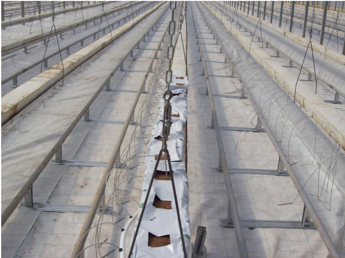
Slika 14. Bijela folija na podu plastenika u hidroponskoj proizvodnji

Količina svjetla u stakleniku ovisi o građevinskim elementima samog staklenika. Ako su tanji, zakrivljeni, uz veći razmak, manje zasjenjuju površinu. Dnevne oscilacije zasjenjenosti plastenika su beznačajne ako se koriste folije s difuznim karakteristikama, jer one daju difuzno svjetlo koje ravnomjerno osvjetljava cijelu površinu. U hidroponskoj proizvodnji se postavlja bijela, reflektirajuća folija na pod kako bi se što više svjetla odbilo nazad do biljaka ( Slika 14).