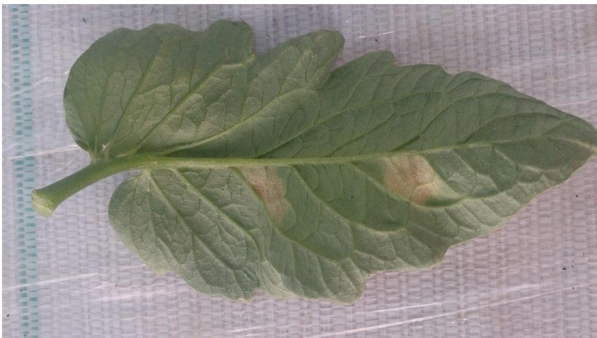
Slika 10. Baršunasta plijesan ( foto original )

Ova bolest javlja se u zaštićenim prostorima na osjetljivim sortama rajčice. Obično se javi u niskim plastenicima za vrijeme kišnog vremena, kada je teško regulirati vlagu, a temperatura u objektu bude 20-22°C. Napad bolesti počinje od donjih najstarijih listova i širi se prema vrhu biljke. Na licu lista javljaju se nekroze, a sa donje strane maslinasto zelene baršunaste prevlake (Slika 10). Ako gljiva napadne čitav list on se deformira i osuši. Zaraza se može proširiti na cvjetove koji otpadaju, a rjeđe zahvaća i plod. Bolest preživljava u tlu na zaraženim biljnim ostatcima ili na armaturi plastenika. Izvor zaraze može biti zaraženo sjeme. Za razvoj gljive potrebna je temperatura 10-32°C (optimalna 22°C). Bolest se razvija samo pri visokoj relativnoj vlazi zraka (>85%) (Maceljski, 2004).