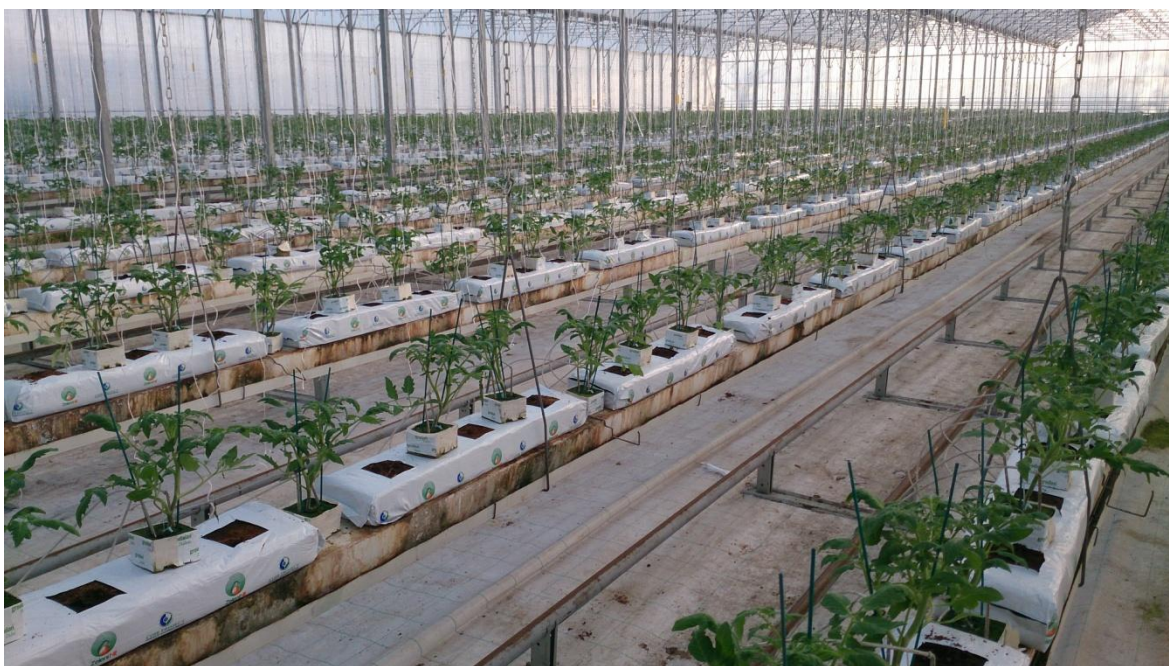
Slika 16. Sadnice rajčice za hidroponski uzgoj (foto original)

Presadnice su cijepljene na podlogu Maxifort te imaju dvije glavne provodne grane po jednoj biljci (V uzgoj). Pošto se radi o hidroponskoj proizvodnji, analiza vode i receptura za fertilizaciju su izrađene u Austriji te ovdje neće biti prikazana. Biljke su posađene u supstrat od kokosovih vlakana a sklop je bio 3 biljke/m 2 .