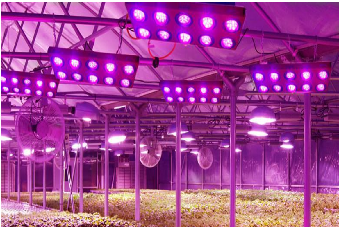
Slika 15. LED osvjetljenje u proizvodnji presadnica

Potaknut napretkom tehnologije (Morrow, 2008) je istražio prednosti i nedostatke te mogućnost upotrebe LED osvjetljenja u hortikulturi, odnosno proizvodnji povrća i cvijeća u zaštićenim prostorima. Ugradnja LED rasvjete u svrhu dodatnog osvjetljenja predstavlja prelazak na potpuno drugačiju tehnologiju osvjetljenja u odnosu na dotada korištene lampe. Mogućnosti poput mijenjanja spektra svjetlosti i reguliranja intenziteta u kombinaciji s niskim intenzitetom zračenja topline (Morrow, 2008) predstavljaju najveće prednosti za upotrebu u hortikulturi. Uvođenje LED lampi je najnovije postignuće u dodatnom osvjetljenju još od razvoja HID (High intensity discharge) lampi. LED lampe se počinju istraživati 1990-ih (Barta 1991; Bula 1991), a prva istraživanja su provedena na salati, špinatu i rajčici.