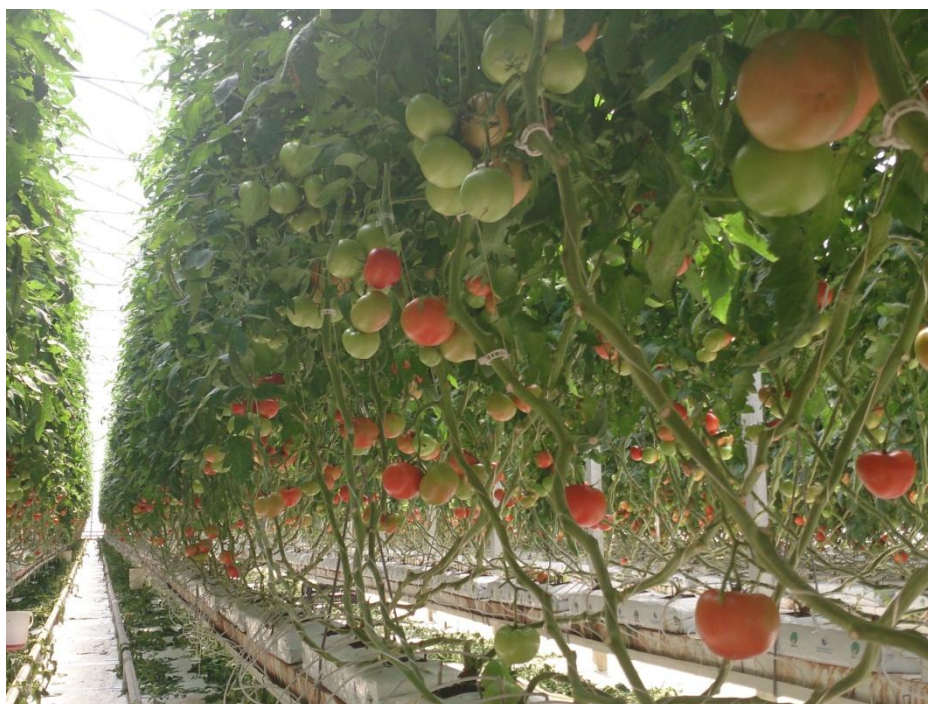
Slika 4. Hidroponski uzgoj rajčice na OPG Vidaković Krasanka d.o.o.

Dugogodišnja eksploatacija tla nepoštivanjem plodoreda u plastenicima dovelo je do gubitka kvalitete tla, loše strukture, stvaranja nepropusnog sloja, visokog sadržaja hraniva i soli, pojava štetnika i bolesti te smanjenja prinosa. Iskustva razvijenih zemalja govore da je najbolje rješenje uvođenje hidroponskog načina uzgoja povrća. Riječ hidropon dolazi od grč. Hydor - voda i ponos – rad, a predstavlja uzgoj biljaka na inertnim supstratima ili bez njih u hranjivoj otopini (Slika 4) (Parađiković, 2008). Hidroponska tehnologija uzima zamah sredinom 20. stoljeća. Trenutačni lider u hidroponiji je Nizozemska koja je prije 15 g imala čak 40% zaštićenih prostora s takvom proizvodnjom. Hrvatska je još uvijek na početku te su površine pod hidroponskom proizvodnjom zanemarive.