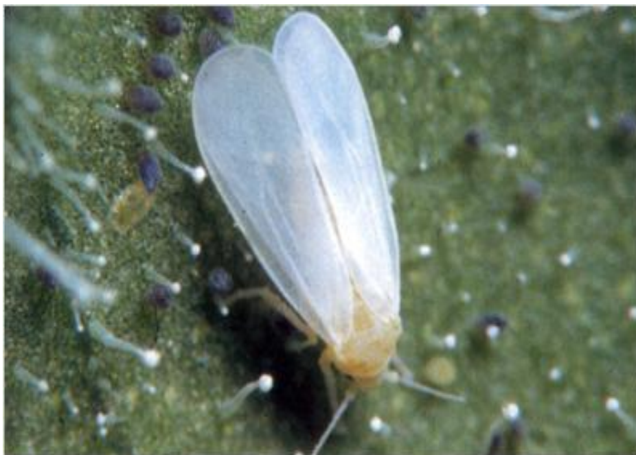
Slika 6. Napad cvjetnog štitastog moljca

Cvjetni štitasti moljac mali je, bijeli, vrlo živahni "leptirić", dug oko 2 mm (Slika 6). Zbog toga se uobičajeno naziva i bijela mušica. Tipičan simptom zaraze biljaka tim štetnikom u početku je medna rosa po plodovima i listovima, a kasnije se na ljepljivim naslagama razvijaju gljive čađavice. Svi razvojni stadiji štetnika nalaze se na naličju listova. Odrasli oblici "leptirići" i jaja nalaze se masovno uvijek na vršnim listovima, a ličinke i kukuljice nalaze se na listovima donjih etaža. Početne zaraze odraslim oblicima teško se uočavaju jer se nalaze na naličju listova. Za pravovremeno izvođenje zaštitnih mjera od velike je važnosti uočavanje tih ranih zaraza. Od plodovitog povrća najviše strada rajčica. Njezin prirodni broj može biti smanjen do 40 %. To je vrlo visok postotak za vrlo skupu stakleničku proizvodnju (Maceljski, 2002).