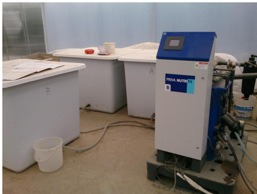
Slika 5. Kompjuterska jedinica za navodnjavanje (foto original)

makroelemenata periodički se tijekom dana 12-24 puta dozira ovisno o radijaciji putem kapaljki i mikroprocesora odnosno kompjuterski (Slika 5).