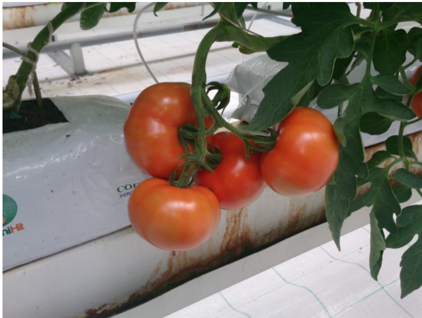
Slika 3. Plod rajčice (foto original)