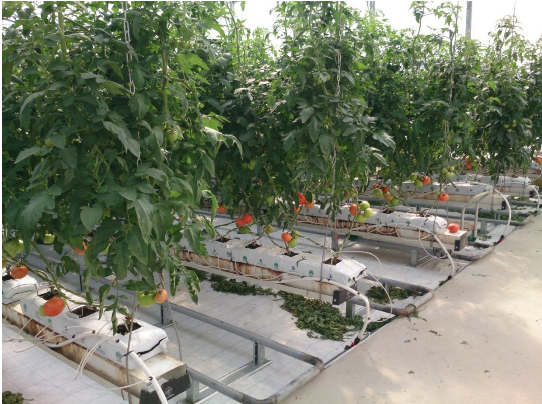
Slika 2. Rajčica Amaneta na OPG Vidaković Krasanka d.o.o. (foto original)