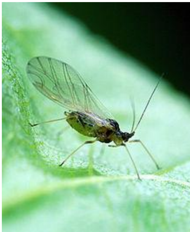
Slika 7. Lisna uš

Lisne uši su polifagni štetnici te napadaju veliki broj različitih biljaka između ostalog i rajčicu. Uši su žutozelene do maslinastozelene boje, duljine 1,2-2,3 mm (Slika 7.) (Maceljski, 2002). Nalaze se na listu gdje sišu biljne sokove. Lisne uši su vektori brojnih virusa te kao takve mogu pričiniti velike štete. U zatvorenim prostorima preporučuje se biološko suzbijanje predatorima i parazitima, te bioinsekticidima.