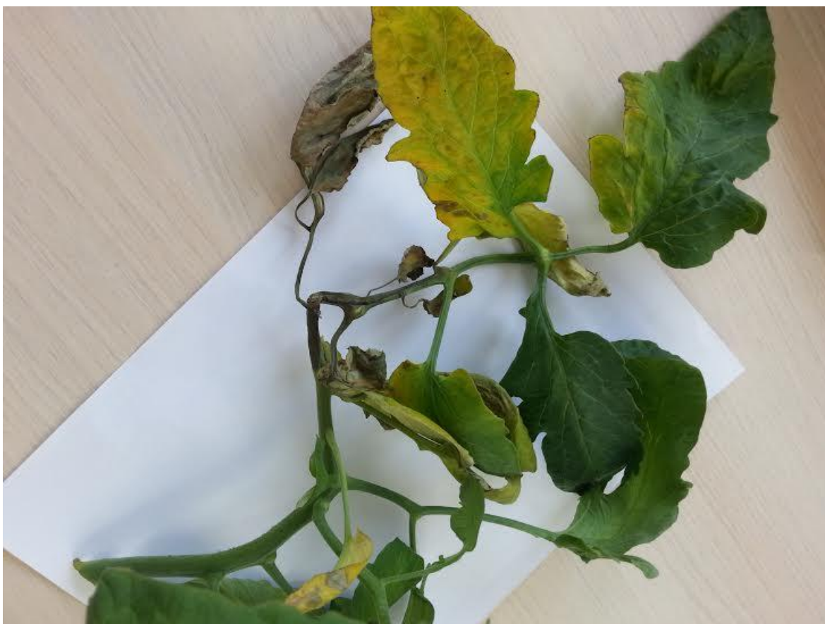
Slika 12. Simptomi fuzarioze na listu rajčice ( foto original )

Gljiva može preživjeti dugi niz godina u tlu u obliku hlamidospora. Može preživjeti u tlu i na 90 cm dubine. Za razvoj zahtjeva visoke temperature tla (optimalne 26 do 28 C). U zoni korjenovog vrata se razvijaju konidije i hlamidospore odakle se vodom za navodnjavanje šire od biljke do biljke.