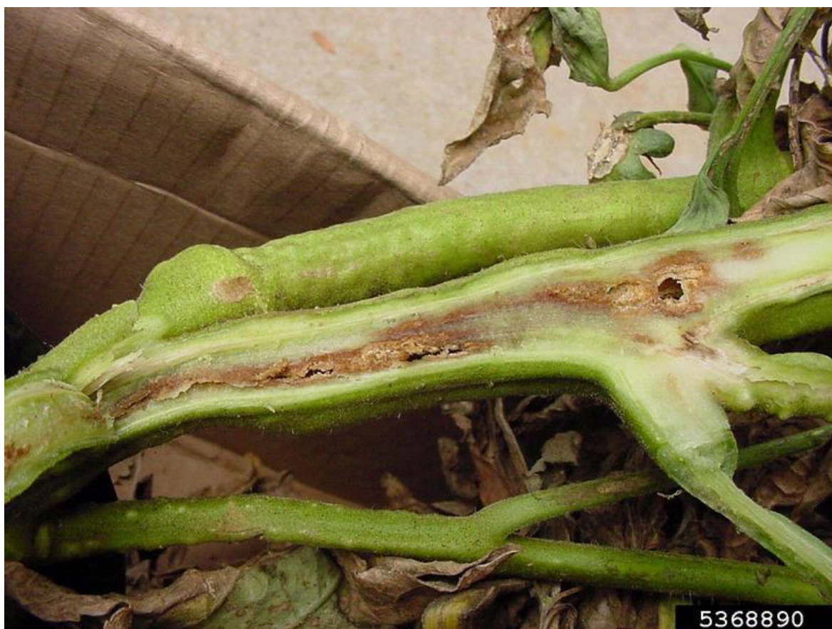
Slika 11. Presjek zaražene biljke ( Clavibacter michiganensis subsp. Michiganensis )

Uzročnik bakterijskog venuća rajčice. Gubitci mogu biti i veći od 70%. Simptomi se pojavljuju na listovima, peteljkama listova i cvjetova, stabljikama i plodovima. Pjege su na listovima koji žute, venu, suše se. Na stabljikama i peteljkama nastaju dublje ranice u obliku malih pukotina, može biti zaražen dio biljke ili cijela biljka. Za vlažnog i toplog vremena stvara se iscjedak (eksudat), na plodovima nastaju žutobijele pjege s bradavičastom smeđom sredinom. Ako je plod zaražen kroz peteljku nema vanjskih simptoma, ali je unutrašnjost razmekšana i žućkaste boje. Izvor zaraze su sjeme (presadnice) i zaraženi biljni ostatci (bakterija u njima preživi do 3 godine). Zaraze nastaju kroz oštećenja na biljci, eksudat je također izvor novih zaraza.