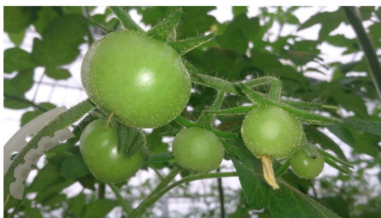
Slika 19. Reducirane cvjetne grane na pet plodova (foto original)