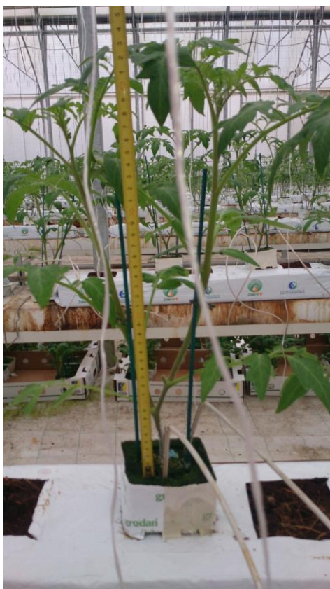
Slika 20. Mjerenje visine stabljike