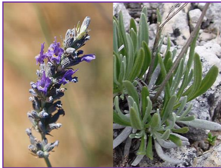
Slika 9. Širokolisna lavanda

Najčešće se primjenjuje u kozmetičkoj industriji zbog svog blagotvornog djelovanja na kožu. Iako se mnoge vrste lavandi koriste kod blažih opekotina, za širokolisnu lavandu se smatra da je najdjelotvornija.