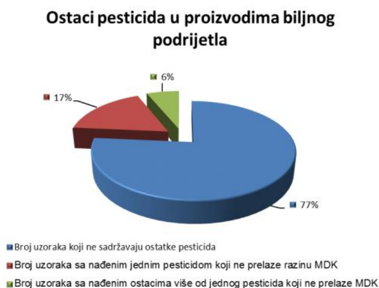
Grafikon 1. Ostaci pesticida u proizvodima biljnog podrijetla 2013.g. u RH

Metabolizam aktivnih tvari u organizmu domaćih životinja pomaže njihovu izmjenu strukture i toksikoloških svojstava što znači da u nekim slučajevima SZB mogu pokazati otrovne učinke na životinje tek kada ih životinjski metabolizam promijeni u reaktivniju tvar. Unos ostataka sredstava za zaštitu bilja u ljudski organizam prehranom ovisi o razini ostataka u/na hrani te o količini hrane koja se konzumira. Zbog slabije razvijenog metabolizma i drugačije prehrane (povišena konzumacija mlijeka, kašice od jabuke ili ostalog voća) veća je mogućnost izloženosti ostacima kod djece nego kod odraslih osoba. Također, ako se računa količina unesenih ostatak prehranom po kilogramu tjelesne mase ona će biti veća kod djece nego kod odraslih osoba (Bokulić i sur., 2015.).