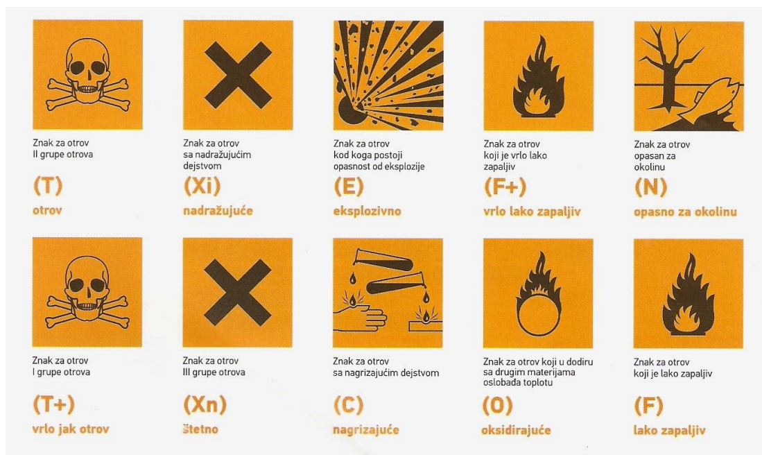
Slika 5. Oznake upozorenja na sredstvima za zaštitu biljaka

Registracijom sredstava za zaštitu bilja određeni su opasnosti i rizici uporabe SZB. Ključni čimbenici koji utječu na procjenu opasnosti sredstava su: spektar djelovanja, učestalost i vremenski period primjena, svojstva i sastav SZB, ostaci, utjecaj na okoliš i neciljane organizme i niz drugih. Pod opasnošću smatra se moguće štetno djelovanje sredstva kod uobičajene primjene kao što su primjerice otrovnost, sklonost ispiranju u rijeke i jezera ili sklonost u nakupljanju masti životinja i čovjeka. Vjerojatnost da se određena opasnost ostvari naziva se rizikom. Njega je moguće izraziti brojčanim vrijednostima, te se pomoću propisane metodologije može izračunati u različitim slučajevima. Mjerama za smanjenje rizika djelovanje sredstava za zaštitu biljaka može se svesti na prihvatljivu razinu, a ako su mjere navedene na etiketi (Slika 5.) proizvoda njih se potrebno strogo pridržavati, kao što su na primjer zabrana primjene na lakim tlima, ograničenje plodoreda, propisana osobna zaštita i dr. (Bokulić i sur., 2015.).