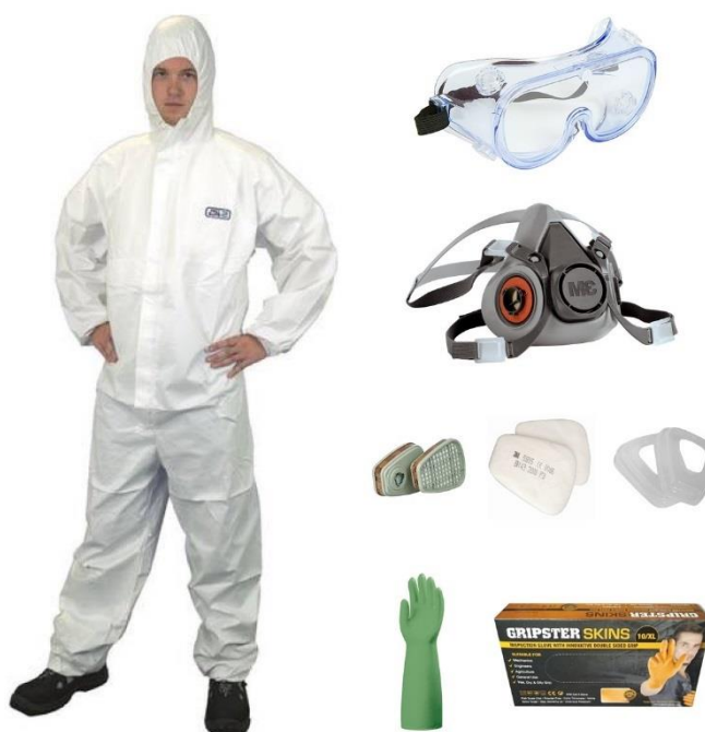
Slika 4. Zaštitna oprema prilikom upotrebe sredstava za zaštitu biljaka

Unutar pakiranja SZB nalazi se uputa za pripremu i primjenu. Važno je pročitati i proučiti dobivene upute, kojih se potrebno strogo pridržavati. U uputama za primjenu točno su određene količine za ratarske, povrćarske i cvjetne kulture najčešće izražene u gramima ili l/ha. Najosjetljivija faza rukovanja je priprema SZB jer se radi o koncentriranim pripravcima gdje je potreban veliki oprez i točnost (Slika 4.). Mjerni instrumenti kao što su male kapaljke ili menzure za tekuća te vage za čvrsta sredstva koriste se kako bi se točno odmjerila količina sredstva za primjenu. Takva odmjerena količina sredstva stavlja se u posudu s malo vode nakon čega se takva pripremljena otopina stavlja u spremnik prskalice, a potom se spremnik puni ostatkom vode. Prilikom miješanja dva ili više sredstva, ako nema potrebnih uputa važno je pridržavati se pravila da se uvijek miješaju istovrsne formulacije, pridržavati se redoslijeda miješanja kod različitih formulacija i paziti da se ostala sredstva dodaju u spremnik prskalice posljednja (Poljoprivredna savjetodavna služba, 2012.).