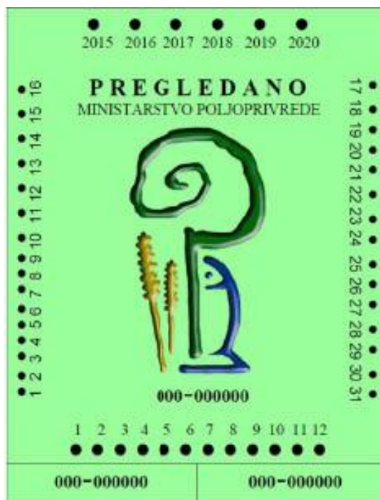
Slika 7. Znak o obavljenom pregledu prskalica i raspršivača