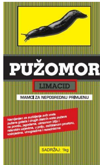
Slika 2. Limacidi u poljoprivrednim ljekarnama