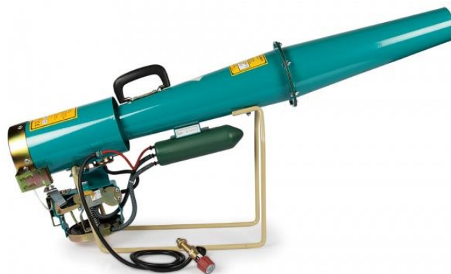
Slika 3. Plinski top za plašenje i odbijanje ptica

Korvifugi su SZB koja služe odbijanju ptica. U Hrvatskoj trenutno ne postoji niti jedno sredstvo registrirano za ubijanje ptica. Zakonom su mnoge vrste zaštićene, a uporabom korvifuga te bi vrste mogle biti ugrožene. Za ptice se mogu koristiti alternativne mjere zaštite kao što su plinski topovi (Slika 3.) čija je uloga odbiti i uplašiti ptice ili zaštitne mreže koje sprječavaju ptice da se hrane usjevom (Bokulić i sur., 2015.).