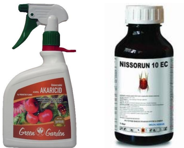
Slika 1. Akaricidi u poljoprivrednim ljekarnama

Akaricidi (Slika 1.) su kemijska sredstva koja svojim djelovanjem suzbijaju grinje. U njihovoj podjeli nailazimo na insekticide i fungicide koji svojim djelovanjem utječu na sve stadije grinja dok selektivni akaricidi prvenstveno djeluju na pokretne stadije grinja (Tablica 2.). U nekim slučajevima selektivni akaricidi mogu djelovati i na odrasle grinje (Raspudić i sur., 2014.).