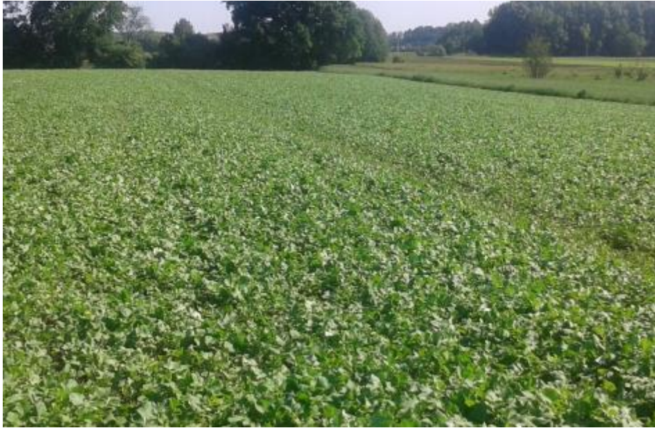
Slika 11. Rauola u borbi protiv korova