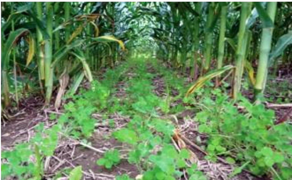
Slika 5. Međuusjev djeteline u polju kukuruza

Živi malč može biti grahorica u kukuruza (Slika 5.), djetelina u “no-till” povrću, različite trave ili leguminoze u voćnjacima i vinogradima.