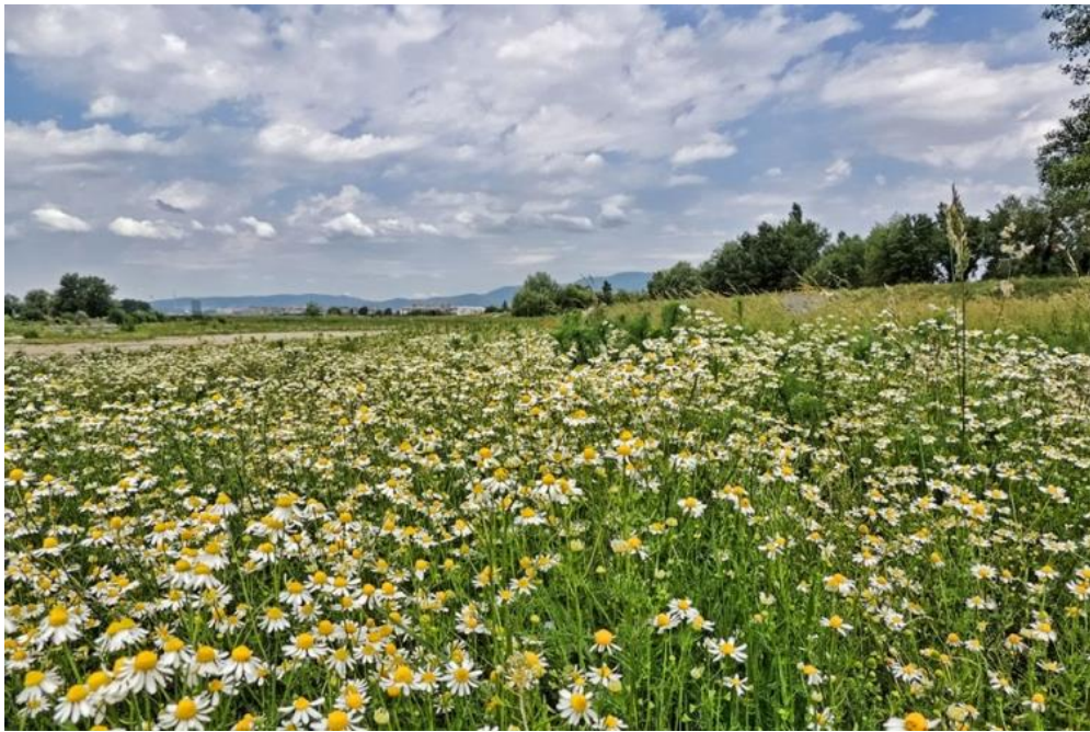
Slika 12. Kamilica