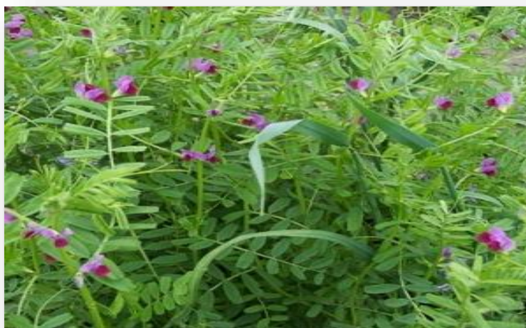
Slika 1. Grahorica

Siju se u kasno ljeto ili u jesen u svrhu pokrivanja tla, a sijati se mogu u postojeći glavni usjev u fazi dozrijevanja ili neposredno nakon žetve ili berbe glavnog usjeva. Od zimskih pokrovnih usjeva često se koriste različite leguminoze kao što su razne djeteline, grahorice i dr. (Slika 1.), ali to može biti i raž (Slika 2.) pa čak i mješavina, raži, ječma i pšenice ili neka druga žitarica koja dobro podnosi zimske uvjete uzgoja (Sullivan, 2003.).