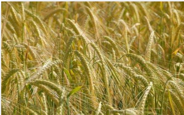
Slika 2. Raž