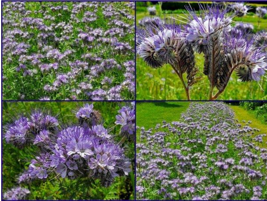
Slika 9. Facelija