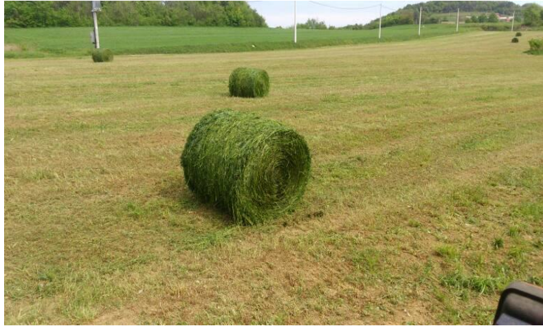
Slika 7. Sijeno lucerne