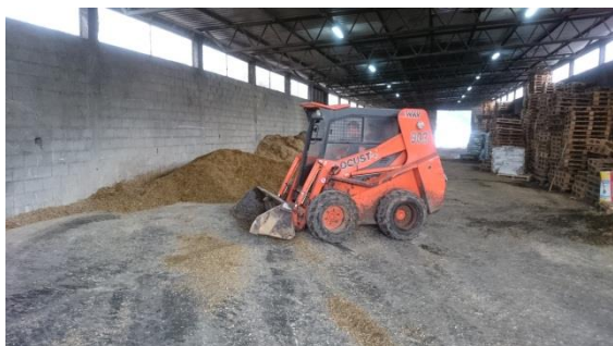
Slika 5. bager utovarivač

Gospodarstvo posjeduje sve mehanizacijske i priključne strojeve za obradu zemlje i proizvodnju hrane. Imaju 4 traktora marke: CASE IH, JOHN DEERE sa prednjim utovarivačem, JOHN DEERE koji vuče miksericu i TORPEDO TD 9006 A. Imaju više prikolica marke ZMAJ 10t. Za obradu zemlje imaju trobrazne i peterobrazne plugove. Od ostalih priključnih strojeva imaju sijačicu, tanjuraču, sjetvospremač, drljaču, kosačicu i ostalo. Vršidba se izvodi kombajnom marke CASE. Sijeno se sprema pomoću rolo prese CLAAS i omotača bala CLAAS. Silaža se priprema pomoću silokombajna CASE. Stajnjak se utovara pomoću bager utovarivača, a odvozi s traktorom JOHN DEERE i prikolicom nosivosti 3.5 tone.