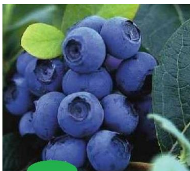
Slika 6. Spartan

( http://www.limburgplant.nl/assortiment/fruit/VACSPART )