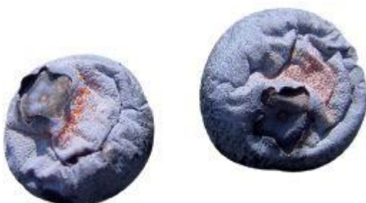
Slika 13. Antraknoza - Colletotrichum gleosporioides

Vrlo osjetljivo razdoblje rasta i razvoja američkih borovnica traje od otvaranja pupova, tijekom cvatnje do stadija zelenih razvijenih plodova. U ta dva mjeseca voda, hranjiva i temperatura imaju najveći izravan utjecaj na količinu i kakvoću godišnjeg uroda, a navedeni čimbenici određuju uravnoteženi rast i zdravstveno stanje borovnica.