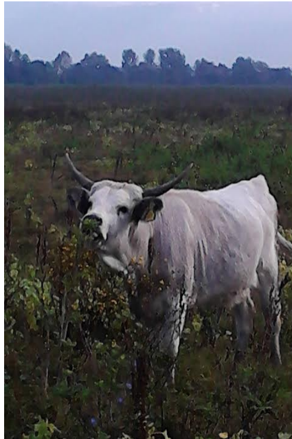
Slika 6: Podolac u ispaši na pašnjaku Gajna

U sklopu brojnih projekata, na Gajni su nabavljeni primjerci hrvatskih autohtonih pasmina: slavonsko-srijemsko podolsko govedo, crna slavonska svinja i posavski konj. Također se na Gajni mogu vidjeti hrvatski ovčari koji su nezaobilazni element ravničarskih područja.