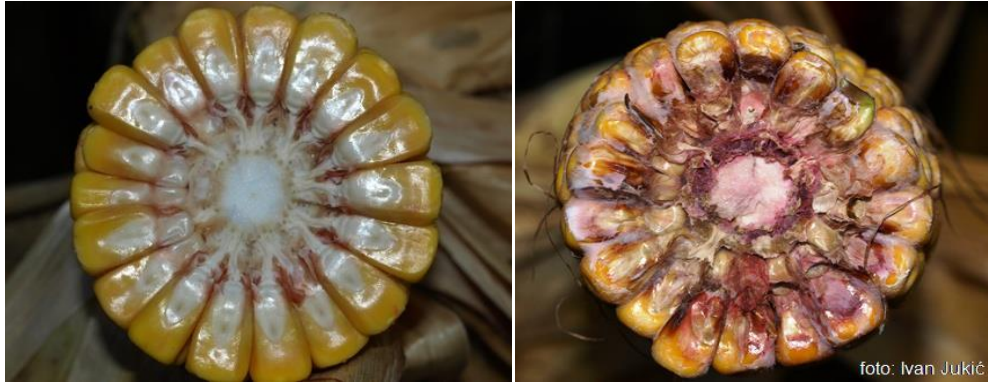
Slika 6. Presjek zdravog i fuzarioznim plijesnima zahvaćenog kukuruza