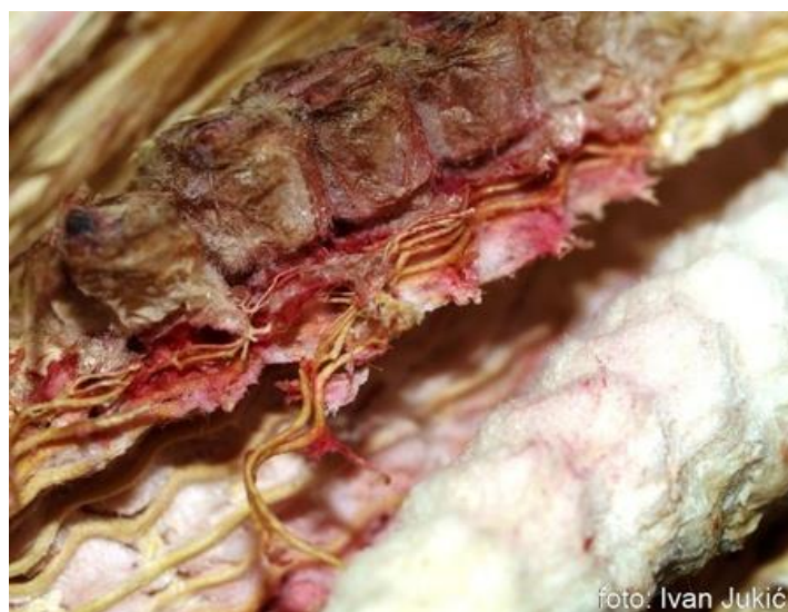
Slika 5. Detalji klipa razorenog fuzarioznim plijesnima