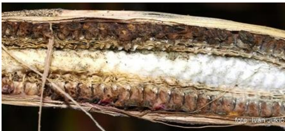
Slika 4. Klip razoren fuzarioznim plijesnima