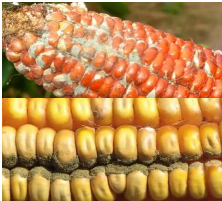
Slika 3. Aflatoksin utvrđen u kukuruzu