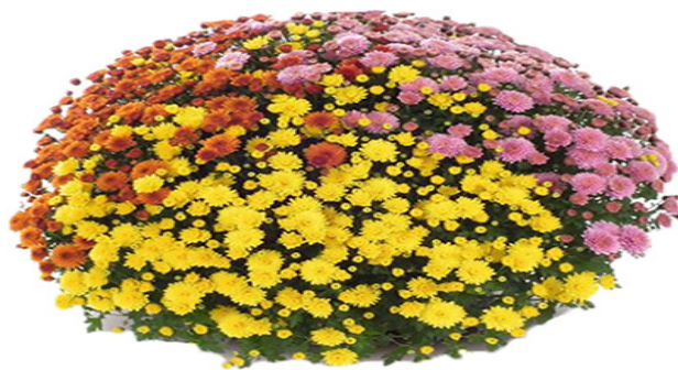
Slika 9. Krizantema Multiflora