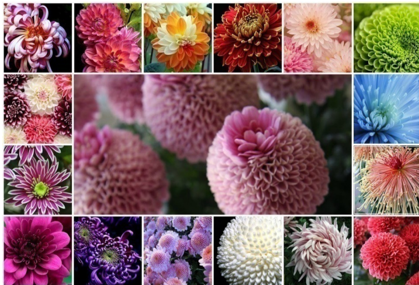
Slika 2. Podjela krizantema