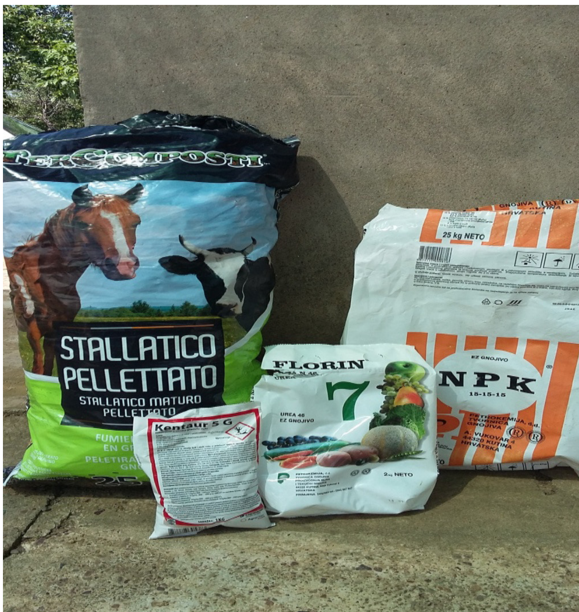
Slika 16. Organska gnojiva, NPK gnojiva i zemljišni insekticid