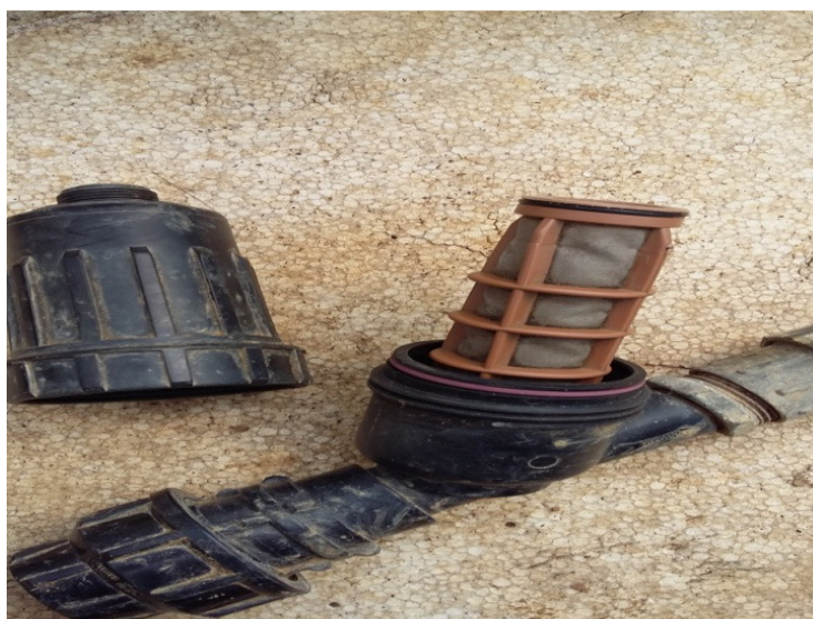
Slika 18. Mrežasti filter za vodu

Na alkatenskoj cijevi se nalazi mrežasti filter (slika 18) koji sprječava ulazak nečistoća u sistem za navodnjavanje i štiti od začepljenja cijevi.