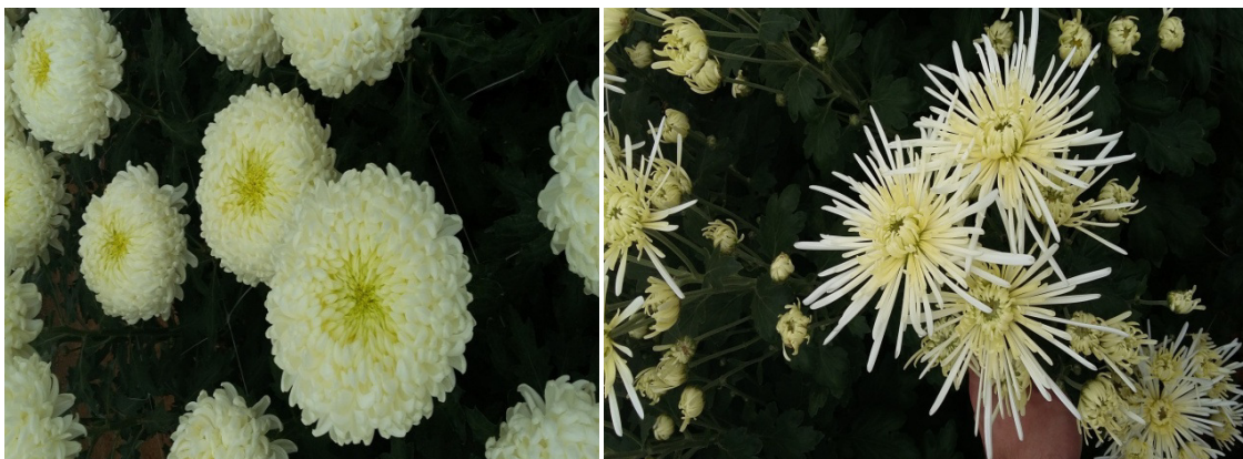
Slika 3 .Bijela lopta „Shoesmith“

„White Spider“ , 10 tjedni kultivar srednje brzog rasta. Glavice su zrakaste (slika 4)