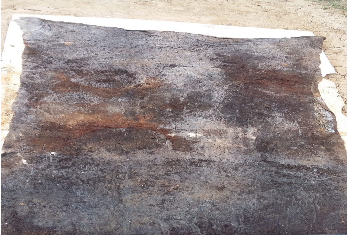
Slika 25. Postavljanje filca u red

Filc se postavljan na stiropor duž reda(slika 25), filc zadržava vlagu i štiti krizanteme u loncima od isušivanja i sprječava prodiranje korijena na stiropor.