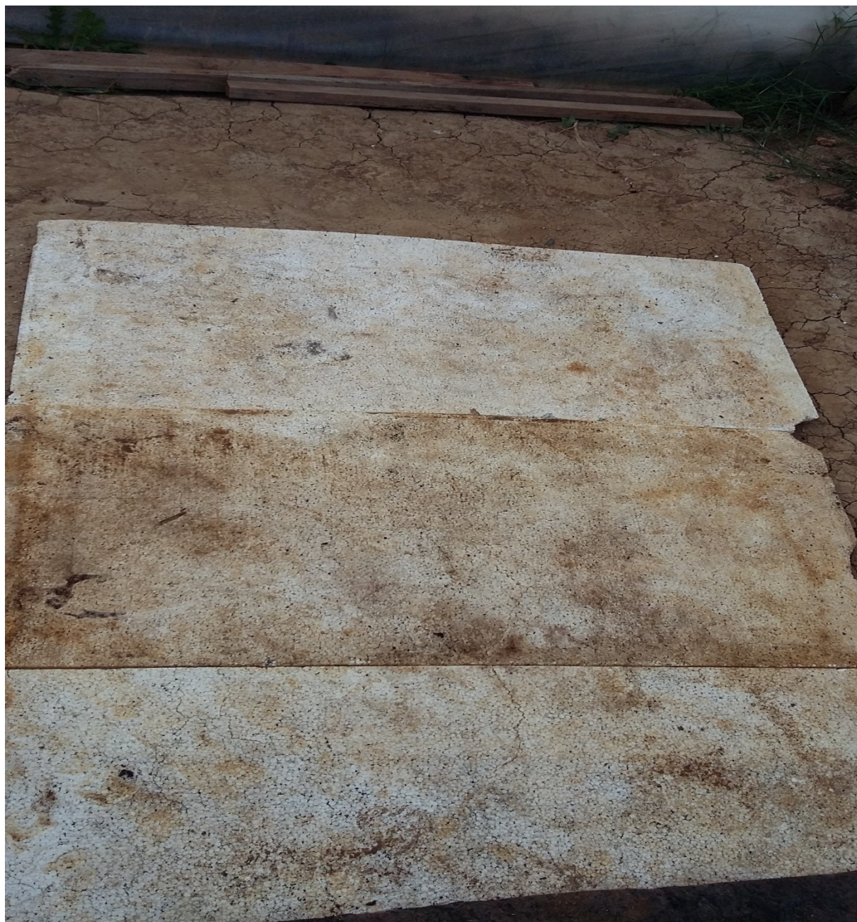
Slika 24. Postavljanje stiropora u red

Stiropor (slika 24) se postavlja na zemljanu podlogu u redove duž plastenika. Debljina jednog stiropora je 2 cm dužina 100cm a širina 50cm. Postavljanje se vrši da krizanteme u loncima ne bi bile na zemlji, stiropor zadržava toplinu a ujedno i štiti lonce od prljavštine.