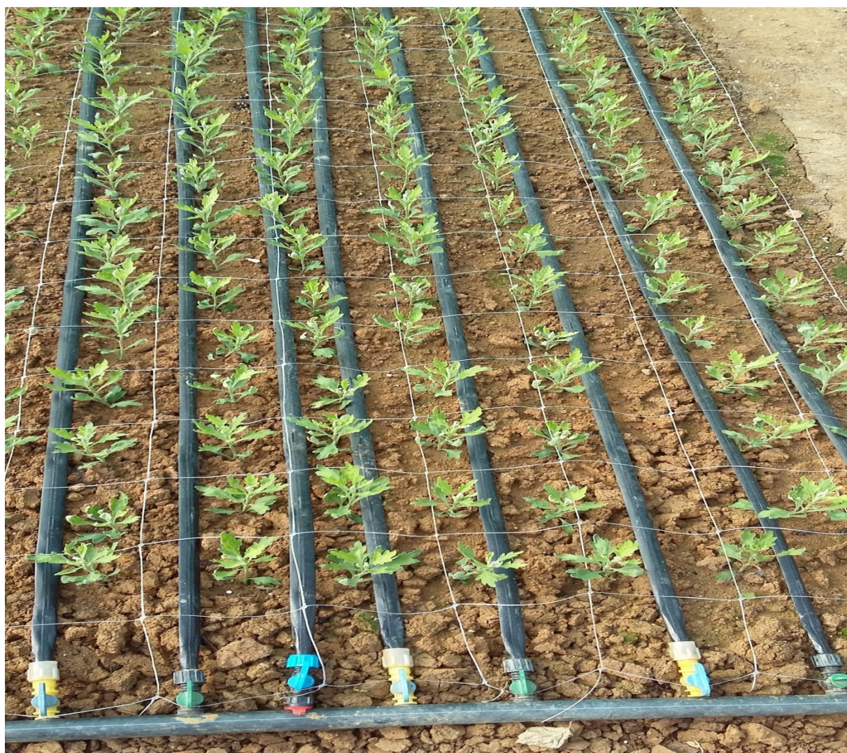
Slika 22. Sadnja krizantema za rez

mjesta je 8 do 10 cm zbog toga što je krizantema za rez biljka plitkog korijena i ne treba ju duboko saditi, nakon sadnje krizanteme potrebno je što obilnije zaliti da zemljište i krizanteme upiju dovoljnu količinu vode. Navodnjavanje se vrši iz montažnih cisterni putem hidropaka koji vuče vodu iz cisterni i putem alkatenskih cijevi ju dovodi do sistema za navodnjavanje kap po kap. Ako krizanteme u startu ne prime dovoljno vode može doći do zaostatka u razvoju ili do propadanja same biljke. Krizanteme se sade početkom srpnja i treba im omogućiti dovoljnu količinu vode tokom ljetnih mjeseci.