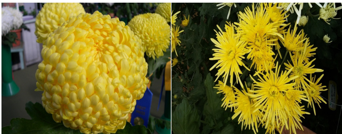
Slika 5. Žuta lopta “Shoeshmit“

“Golden Spider“ , 10 tjedni kultivar srednje brzog rasta(slika 6).