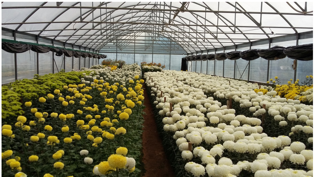
Slika 1. Krizanteme za rez

Domovina krizantema je istočna Kina. U Kini je krizantema simbola dugog života, a u Japanu je nacionalni cvijet. Europljani su krizanteme upoznali s oslikanih svilenih kimona. Tek koncem 17. st. došli su prvi vrtni oblici krizantema no oni se nisu zadržali. Od tada je prošlo stotinu godina od početka širenja krizantema u Europu. Poticaj su dali prvi kultivari izloženi 1796. god. u Engleskoj. Nakon toga se povećava uvođenje krizantema u Europu, a od polovice 19. st. Počinje i oplemenjivanje.