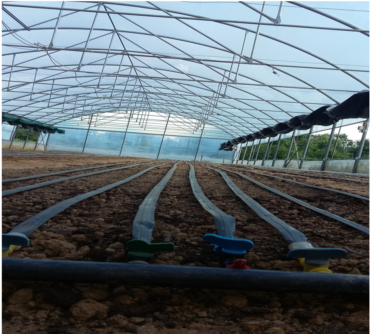
Slika 19. Alkatenska cijev sa spojnicama na kojima se nalaze višegodišnje cijevi