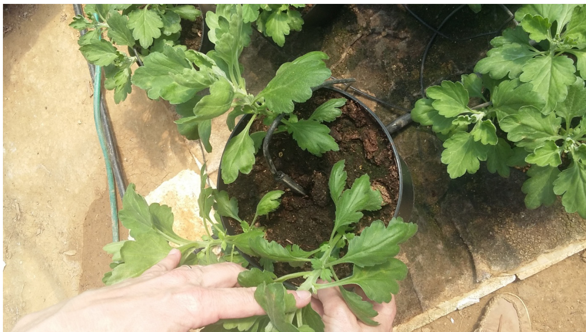
Slika 28. Postavljanje streličaste kapaljke u sredinu lonca

Navodnjavanje krizantema u loncima se vrši iz cisterni pomoću hidropak (slika 29), hidropaka vuče vodu iz cisterni i raspoređuje ih po alkatenskoj cijevi.