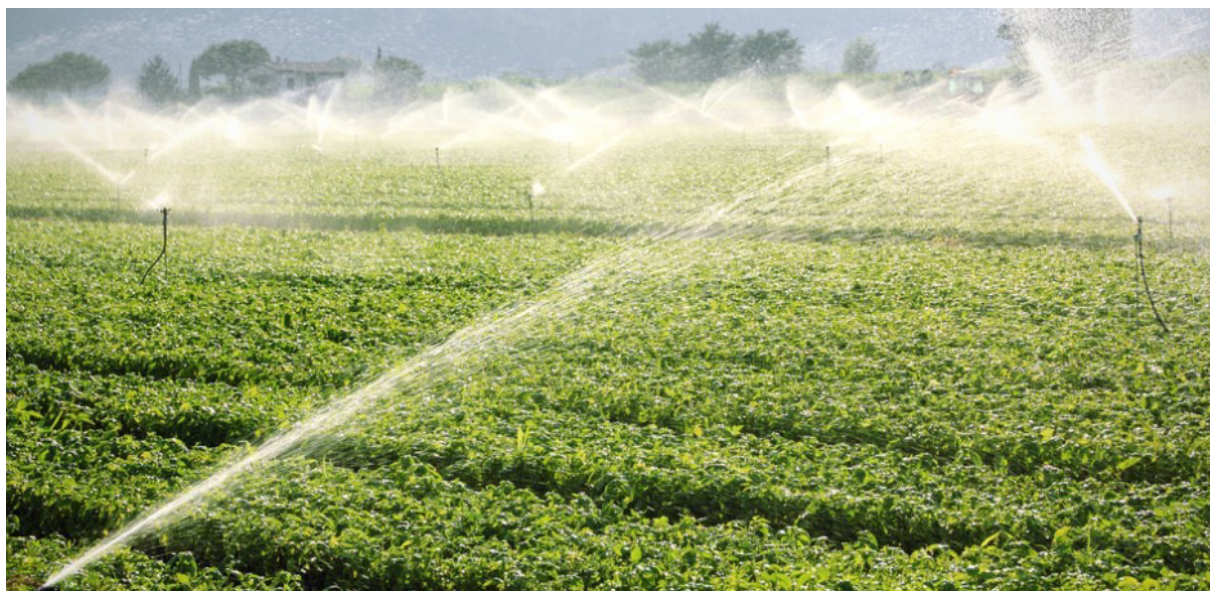
Slika 10. Navodnjavanje poljoprivrednih kultura

U Hrvatskoj se navodnjava 9.264 hektara što čini 0.86% naših obradivih površina i što je jako malo u odnosu na naša prirodna bogatstva rijeka i jezera. Svrha navodnjavanja kao melioracijske mjere je nadoknaditi nedostatak vode koji se javlja pri uzgoju poljoprivrednih kultura kako bi se osigurao sto veći biološki potencijal. Širom svijeta navodnjavaju se poljoprivredne površine u svim klimatskim područjima. Ono je danas postalo univerzalna melioracijska mjera i simbol razvijenoga društva.