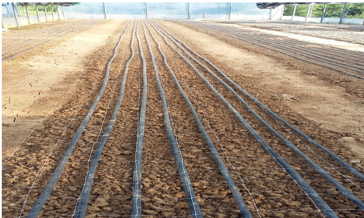
Slika 20. Mreže za krizanteme