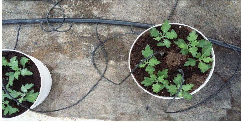
Slika 26. Posađene lončane krizanteme