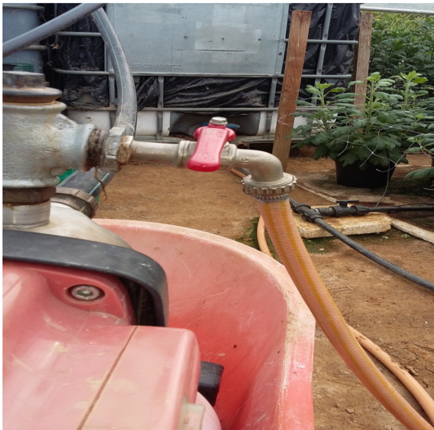
Slika 30. Zatvarač i otvarač protoka vode

Protok vode za navodnjavanje krizantema u loncu se regulira zatvaračem i otvaračem vode (slika 30), koji se nalazi na hidropaku.