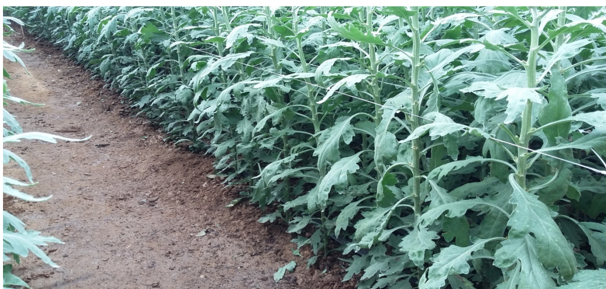
Slika 21. Podizanje mreže na krizantemama za rez