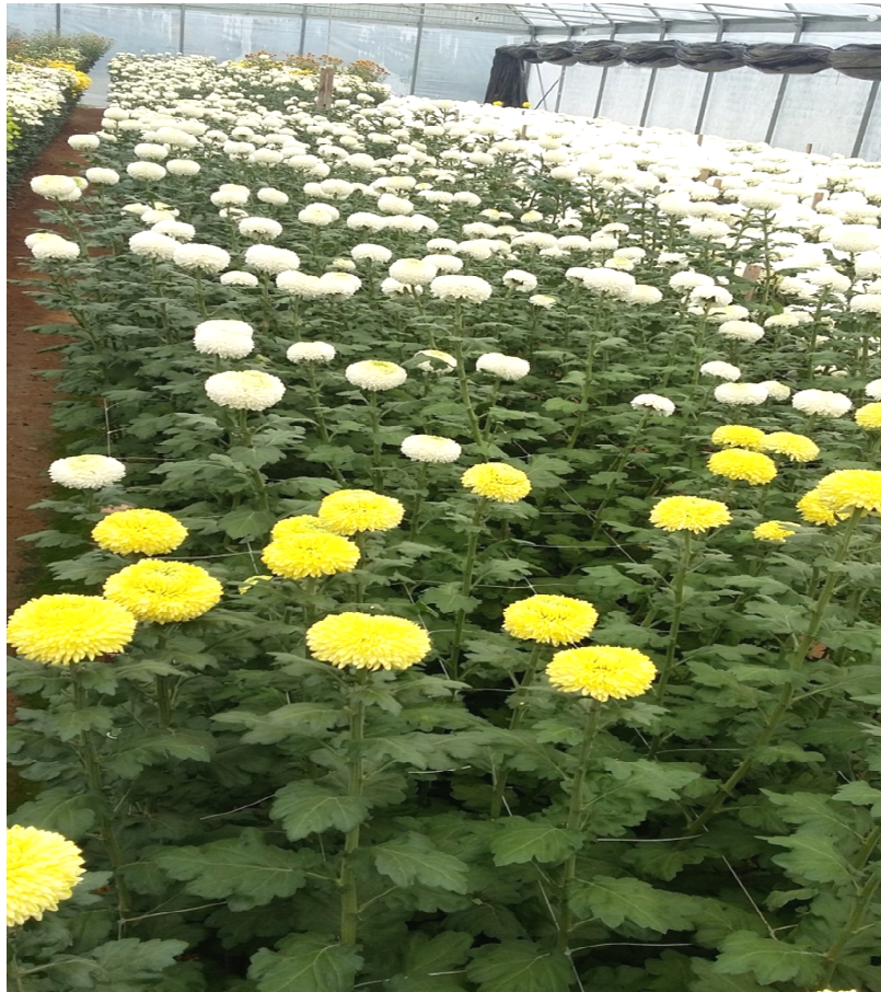
Slika 7. Bijeli i žuti “Boris Becker“

“Boris Becker yellow“, 9 tjedni kultivar brzog rasta sa čvrstom glavom( slika7).