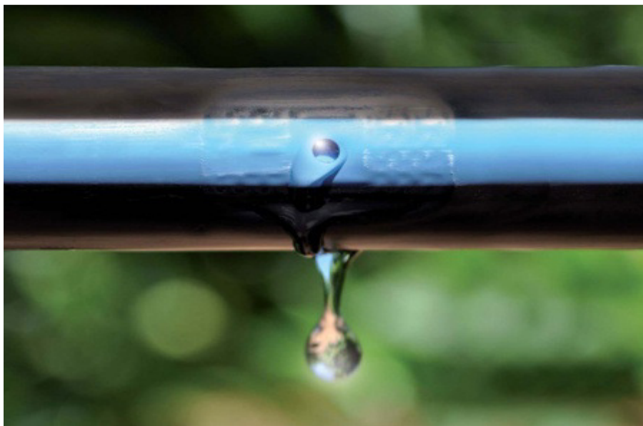
Slika 11. Navodnjavanje kap po kap

-Lokalizirano navodnjavanje čini vrlo moderna i sofisticirana oprema kojom se voda dovodi do svake biljke vrlo precizno i ekonomično Metode lokaliziranog navodnjavanja, navodnjavanje kapanjem (kap po kap), navodnjavanje mini rasprskivačima (mali rasprskivači). Navodnjavanje kapanjem (slika 11), umjetno dodavanje vode, potpuno su automatizirani, programirani te tokom svog rada ne zahtijevaju prisutnost čovjeka. Ovaj sustav štedi vodu, te se minimalnom količinom vode postiže maksimalni učinci u biljnoj proizvodnji. Navodnjavanje mini rasprskivačima novijeg je datuma, danas se sve više koriste u poljskim uvjetima, naročito za uzgoj voćarskih i povrćarskih kultura. Mini rasprskivači su slični sustavima kapanja a glavana je razlika što su kapaljke zamijenjene mini rasprskivačima.