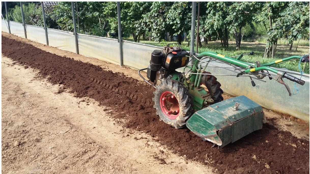
Slika 15. Frezanje i dodavanje organskog supstrata KLASMAN TS-3

Frezanje se obavlja zbog toga što tlo mora biti rahlo i fine sitne strukture bez velikih busa zemlje. Krizanteme su biljke plitkog korijena koje zahtijevaju plitku obradu, frezanje se vrši do 20 cm dubine tla. Svaka gredica se freza po dva puta zbog što bolje strukture tla i da tlo za sadnju bude što rahlije. Ako je tlo istrošeno dodaje se organski supstrat koji poboljšava kvalitetu tla.