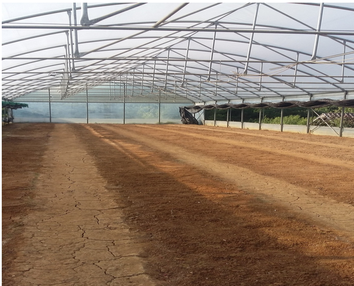
Slika 23. Očišćeni plastenik; foto Zečević B.

Čišćenje plastenika od travnih korova se radi zbog sprečavanja širenja korova na proizvodne površine koje prilikom sadnje moraju biti čiste (slika 23), čišćenje se obavlja sa malim motičicama i čišćenje rukama.