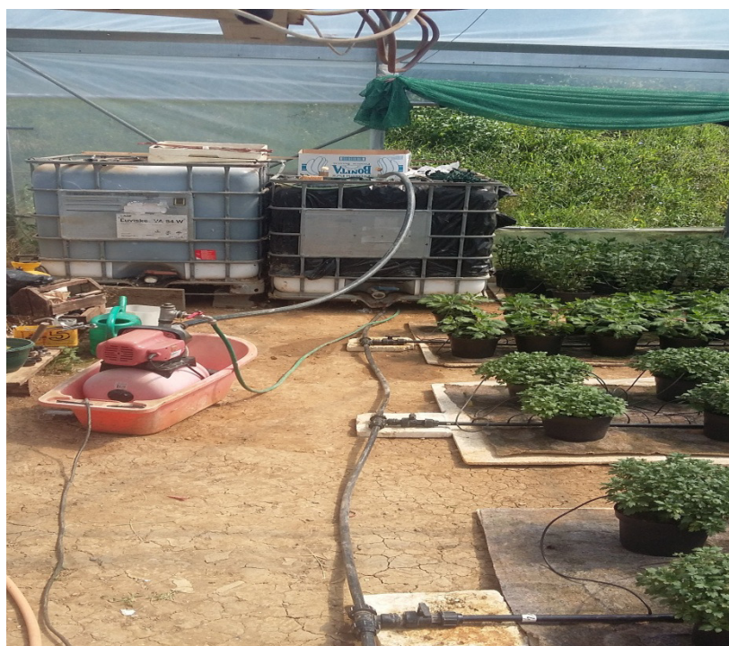
Slika 29. Hidropak , cisterne i alkatenska cijev za navodnjavanje

Navodnjavanje krizantema u loncima se vrši iz cisterni pomoću hidropak (slika 29), hidropaka vuče vodu iz cisterni i raspoređuje ih po alkatenskoj cijevi.