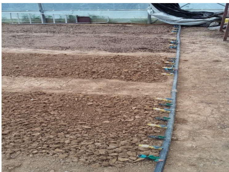
Slika 17. Alkatenska cijev sa spojnicama ;foto Zečević B.

Na alkatenskoj cijevi se nalazi mrežasti filter (slika 18) koji sprječava ulazak nečistoća u sistem za navodnjavanje i štiti od začepljenja cijevi.