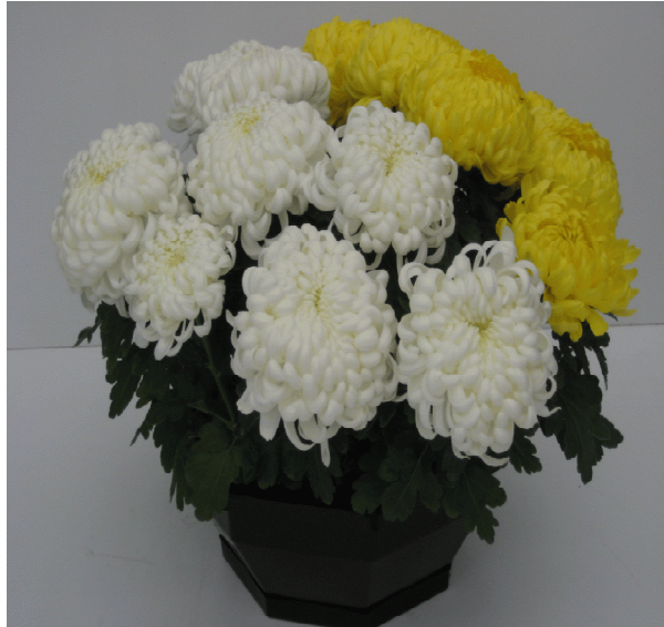
Slika 8. Krizanteme u loncima ( velikocvijetne )

Krizanteme Multiflore tvore kuglast oblik, imaju čvrstu stabljiku narastu 40 do 50 cm imaju listovi su im maleni, cvjetovi su okruglasti različite boje bijele, crvene, žute, ljubičaste, roza (slika 9).