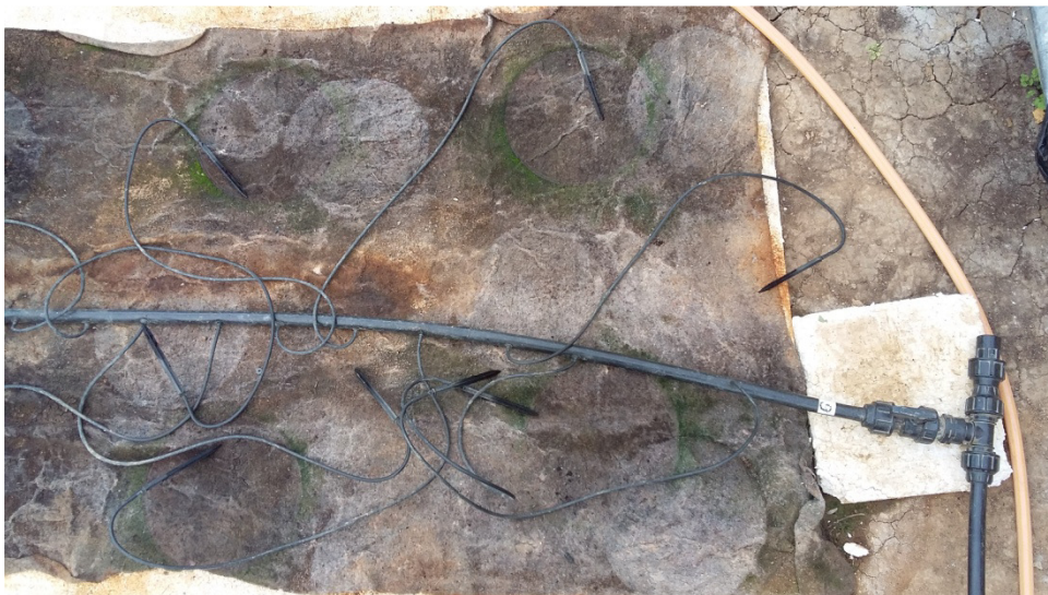
Slika 27. Sistem za navodnjavanje sa streličastim kapaljka

Prilikom postavljanja sistema za navodnjavanje prvo se postavlja alkatenska cijev sa spojnicama, na spojnice se postavlja cijev sa streličastim kapaljka, cijev sa kapaljka ide duž sredine reda za navodnjavanje (slika 27)