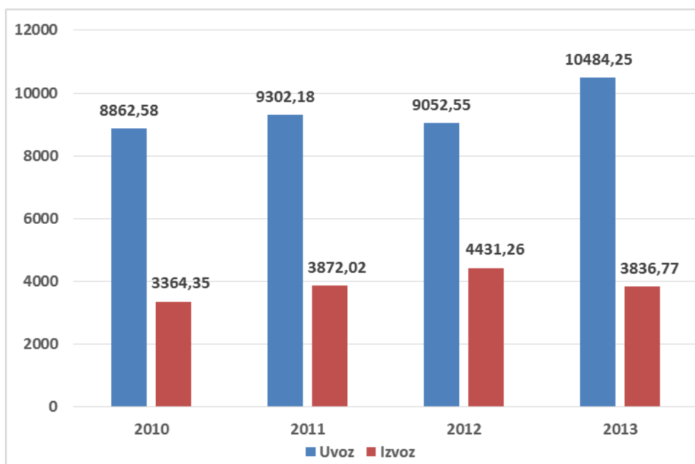
Grafikon 1. Usporedba ukupnog izvoza i uvoza Republike Hrvatske