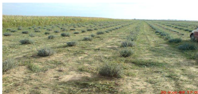
Slika 1. Lavanada godinu dana nakon sjetve

biljka veća, ima i veću cijenu. Presadnice lavandina za proljetnu sadnju imaju i do 30 % nižu cijenu u odnosu na one namijenjene za sadnju u jesen. Na OPG-u Sabadoš sadnice su nabavili su od OPG-u Vera Trampus iz Belišća koji se bavi uzgojem sadnica. Cijena presadnica je bila 5 kn po komadu (srednje razvijene sadnice). Hibridna lavanda se sadi na razmak među redovima 180 ili 200 cm, a unutar reda 50 – 60 cm, uz sklop 9.200 – 10.000 sadnica po hektaru.