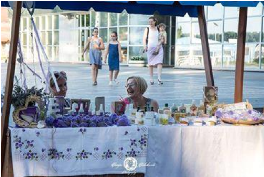
Slika 11. Događaj "Čekam te na korzu" u Vukovar