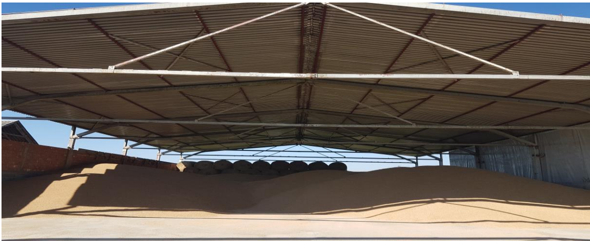
Slika 3. Prikaz skladišta žitarica