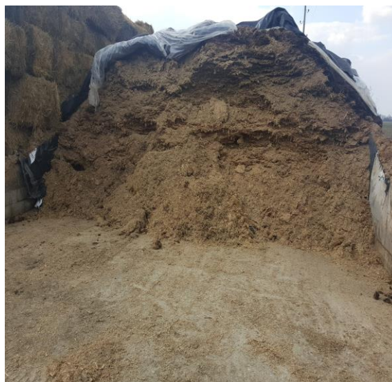
Slika 6. Prikaz silaže koja se koristi u hranidbi