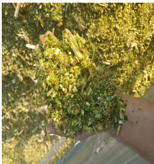
Slika 5. Prikaz silaže u toku siliranja

Silaža se odvija silo kombajnom koji kukuruznu stabljiku siječe na dužinu od 2 cm. Te se ista sprema u silo trapove, a mogu i u tzv. bagove. Silaža mora biti kvalitetno pripravljena i dobro uskladištena što znači da mora prilikom punjenja trapa biti dobro ugažena i mora biti istisnuti sav zrak kako ne bi došlo do kvarenja i razvoja plijesni. Kada se trap počne puniti treba održati kontinuitet do zatvaranja kako isto ne bi došlo do kvarenja, po završetku silaža se pokriva prvo podfolijom zatim silofolijom te se najlon pričvrsti vrećama ili gumama. Da bi se silaža mogla konzumirati treba proći oko 30-tak dana kako bi vrenje odradilo svoje tek tada silaža se normalno koristi u hranidbi goveda kao glavno kabasto krmivo u koje se dodaju dodaci. Na gospodarstvu Bokun siliramo oko 70 ha kako bi zadovoljili potrebe za silažom tokom cijele godine, a samo siliranje traje 10ak dana. Nastojimo što kvalitetnije pripremiti hranu kako bi se rezultati vidjeli na stočarskoj proizvodnji.