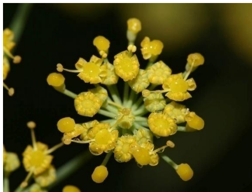
Slika 4. Cvijet komorača

Cvjetovi komorača su peterodijelni, sitni, mirisni, žuto-zelene boje. Cvjetovi komorača skupljeni su u ravno, gusto složene štitaste cvati, koje su smještene na vrhovima izboja i grana. Promjer cvati može iznositi do 15 cm (Slika 4).