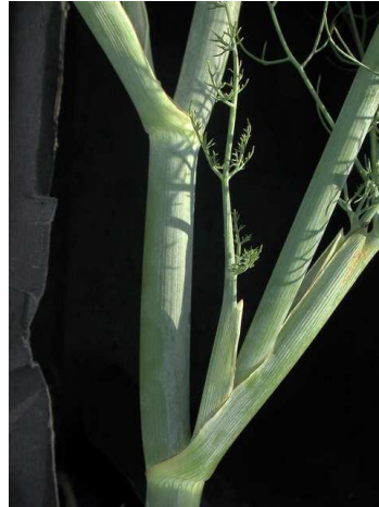
Slika 2. Stabljika komorača

Iz korijena komorača razvija se veći broj zeljastih, uspravnih i razgranatih stabljika modrozeline boje cilindričnog oblika (Slika 2). Površina stabljike je glatka, pri poprečnom presjeku je neispunjena, te može narasti od 1,5 do 2 m u visinu (Kišgeci, 2008.).