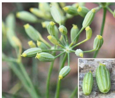
Slika 5. Plod komorača

Plod komorača je kalavac (šizokarpijum), sive do žuto-zelene boje ovalnog oblika (Slika 5). Na površini ploda nalazi se više uzdužnih rebara, u kojima se nalazi eterično ulje. Zrelost ploda očituje se pojavom sivo-žutih rebara. Plod komorača sastoji se od dvije sjemenke, dužine od 6 do 10 mm, a širine od 2 do 4 mm. Težina 1000 sjemenki iznosi od 4 do 8 g. sjeme komorača ima visoku klijavost ( od 90 do 100 % ), koja se zadržava od 2 do 3 godine (Kišgeci, 2008.).