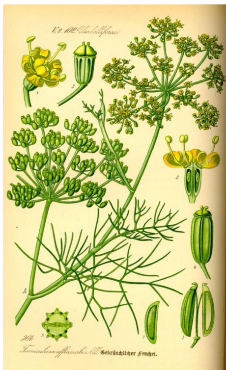
Slika 1. Komorač ( Foeniculum vulgare Mill.)