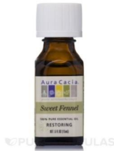
Slika 7. Eterično ulje komorača