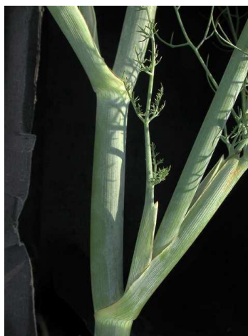
Slika 2. Stabljika komorača

Iz korijena komorača razvija se veći broj zeljastih, uspravnih i razgranatih stabljika modrozeline boje cilindričnog oblika (Slika 2). Površina stabljike je glatka, pri poprečnom presjeku je neispunjena, te može narasti od 1,5 do 2 m u visinu (Kišgeci, 2008.).