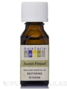
Slika 7. Eterično ulje komorača