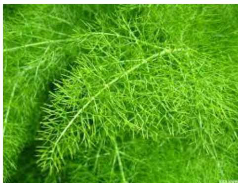
Slika 3. List komorača

Listovi komorača su modrozeline boje, višestruko perasto podijeljeni, sazdani od mnoštva uskih liski (Slika 3). Duljina listova može doseći do 40 cm. Listovi su mekani, glatki i mirisni, smješteni na dugim peteljčkama koje uz pomoć lisnih rukavaca obuhvaćaju stabljiku. Peteljke prizemnih listova su dulje, od peteljki listova smještenih na sredini stabljike. Vršni listovi mogu biti sjedeći (Šilješ i sur., 1992.).