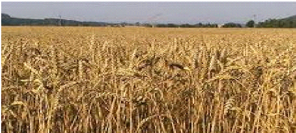
Slika 5. Pšenica u fazi zriobe na PG „MARIO LUČIĆ“

Za visoke urode i visoku kvalitetu koristimo dva tretiranja fungicidima. Prvo tretiranje obavljamo u fazi 1-2 koljenca, a drugo u fazi klasanja, pred cvatnju.