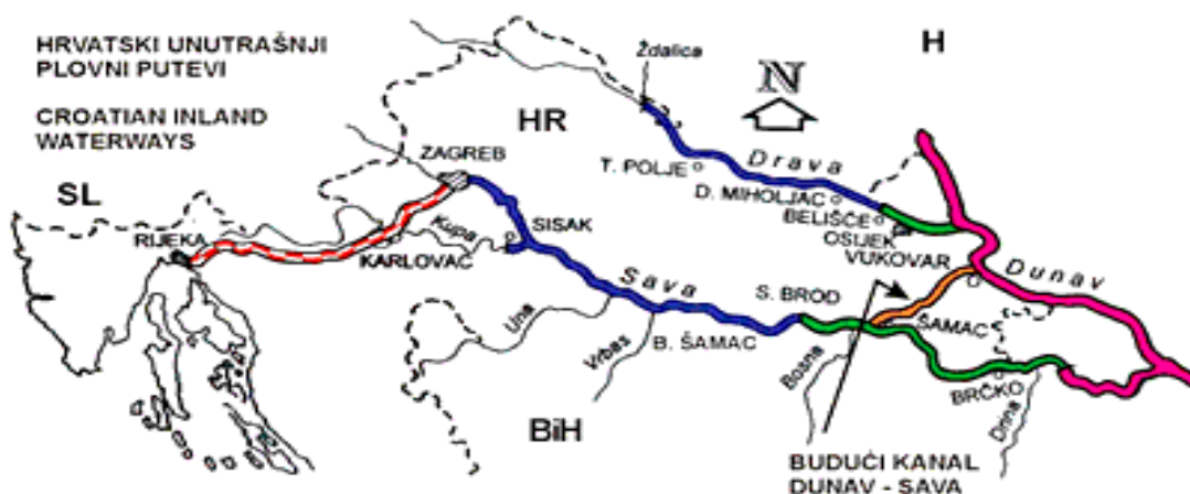
Slika 15. Trasa budućeg kanala Dunav-Sava

Č. DUNDOVIĆ, S. VILKE: Izgradnja višenamjenskog kanala Dunav – Sava... Pomorstvo, god. 23, br. 2 (2009), str. 589-608. Predvidivi značaj planiranog Višenamjenskog kanala Dunav-Sava (VKDS) je višestruk. Kanal Dunav-Sava, od Vukovara do Šamca, kada bude dovršen služiti će poljoprivredi, prometu i vodnom gospodarstvu. Njegove su tri glavne funkcije i zadaće: navodnjavanje poljoprivrednog zemljišta, poboljšanje postojeće odvodnje slivova rijeka Bida, Bosuta i Vuke, te mogućnost plovidbe. Nadalje, Kanal je najkraća plovna veza u smjeru zapadne i istočne Europe. Njime se skraćuje plovni put za 417 km u smjeru zapada i 85 km u smjeru istoka (Slika 15).