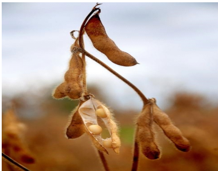
Slika 12: Soja u fazi zriobe i žetve

veće količine istih često uzrokuju veću ili manju fitotoksičnost. Realno nema 100 % garancije uspjeha djelotvornosti ovakvih herbicida, stoga kombinacijom ovih herbicida i herbicida za korekciju pronalazimo najučinkovitije rješenje. Osim obavezne zaštite od korova, zaštita od drugih štetočina provodimo se po potrebi. U sušnim godinama štetu nam na OPG-u zna pričinjavati crveni pauk. Prva žarišta javljaju se uz rubne dijelove, obično u srpnju, a manifestiraju se gubitkom boje zdrave zelene mase koja podsjeća na zriobu.