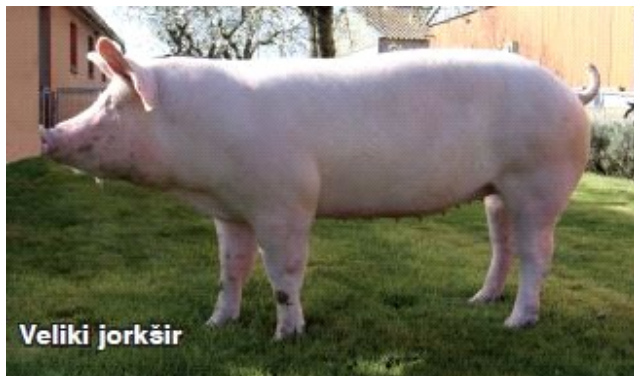
Slika 1: Krmača veliki jorkšir

Veliki jorkšir ili velika bijela (engl. Large White) je bijela pasmina svinja velikog formata koja je sudjelovala u postanku većine europskih plemenitih bijelih pasmina svinja. Nastala je u 19. stoljeću u engleskoj grofoviji Yorkshire, prema kojoj je i dobila ime. U stvaranju velikog jorkšira su sudjelovale domaće engleske svinje te mali i srednji jorkšir. Pasma se vrlo brzo proširila po cijeloj Engleskoj, a ubrzo je postala i jedna od najraširenijih pasmina svinja u svijetu. Glava velikog jorkšira je srednje duga i široka, što je jedan od znakova oplemenjenosti pasmine. U čeonom dijelu ima blago ugnuti profil i stršeće uši po čemu se razlikuje od ostalih bijelih pasmina iz skupine landrasa. Trup je dug i dubok, te povijen u leđnom dijelu. Životinje su široke u prsima, a butovi su dobro obrasli mišićjem koji se penju visoko na leđa. Noviji selekcionirani tipovi jorkšira imaju srednje visoke noge snažnih kostiju. Duž trbušne linije veliki jorkšir ima šest do sedam pari pravilno raspoređenih sisa. Svinje ove pasmine imaju tanku i nepigmentiranu kožu koja je prekrivena bijelom i rijetkom čekinjom. U zreloj dobi krmače su teške i do 250 kg, a nerasti 350 i više kg. Veličina legla u