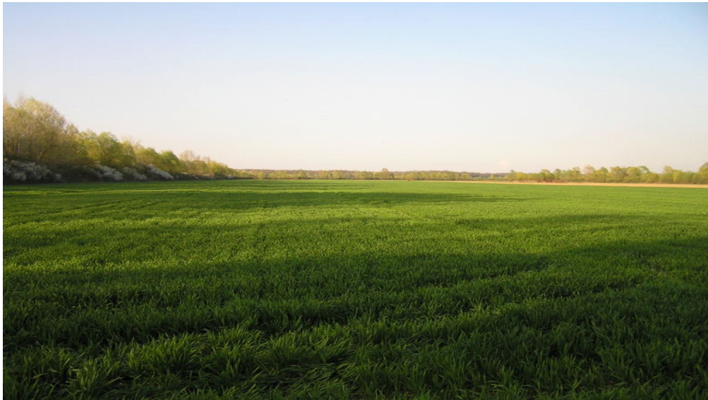
Slika 4. Pšenica u fazi vlatanja na PG „MARIO LUČIĆ“

Za visoke urode i visoku kvalitetu koristimo dva tretiranja fungicidima. Prvo tretiranje obavljamo u fazi 1-2 koljenca, a drugo u fazi klasanja, pred cvatnju.