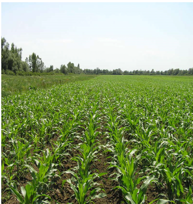
Slika 8. Kukuruz nakon kultivacije i prihrane na polju PG „Mario Lučić“