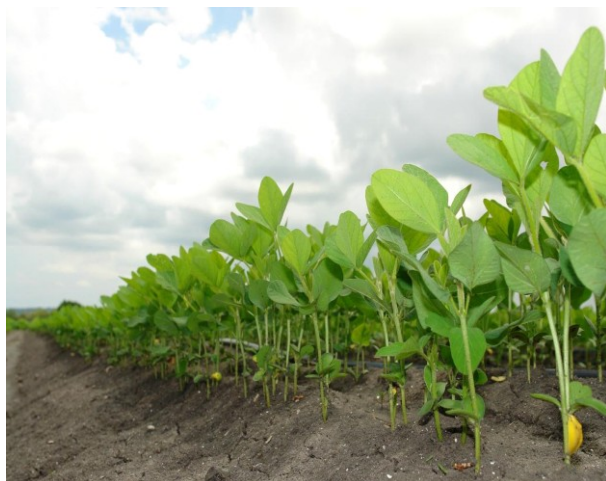
Slika 10. Soja nakon nicanja

Valja istaknuti i određene trenutačne specifičnosti ove kulturne vrste. Jedna od globalnih karakteristika proizvodnje soje je i to da je ona najviše zastupljena kulturna vrsta u postotku genetskih preinačenih organizama u odnosu na ukupnu svjetsku proizvodnju. Smatra se da oko 90 % ukupne svjetske proizvodnje soje potječe od genetski preinačene soje, a kao takva najviše dominira na područjima širom cijele Amerike. U RH takva proizvodnja nije dozvoljena i kao takva može imati veliku proizvodnu perspektivu. Soja je trenutno treća kultura po proizvodnoj zastupljenosti u RH, lani se sijala na oko 90 tisuća ha, a glavni razlog buma proizvodnje, jer je povećanje gotovo dvostruko veće od uobičajenog, su ostvarivanje potpora uvjetovanih obvezom poštivanja zelenih plaćanja od prošle godine.