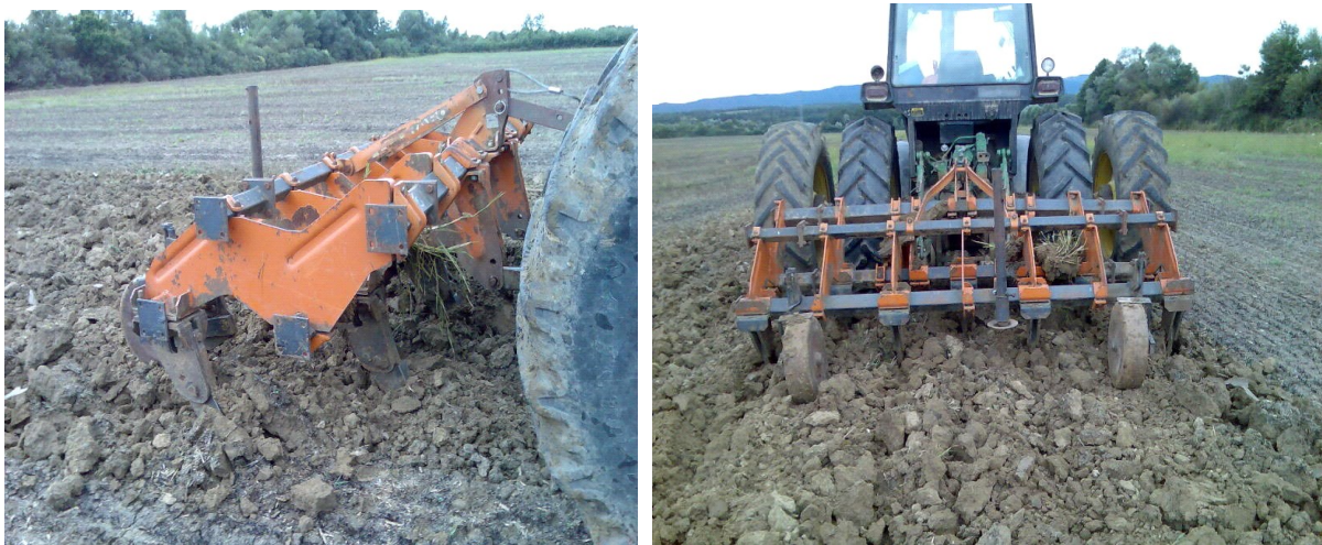
Slika 16. Podrivanje tla na PG „Mario Lučić“

Podrivanje tla značajna je agrotehnička operacija i jedna od mogućnosti unaprjeđenja ratarske proizvodnje na PG „Mario Lučić“. U današnjoj modernoj poljoprivredi uslijed korištenja i upotrebe sve težih strojeva i opreme, te izostavljanjem unošenja organske tvari u tlo, dolazi do bržeg i jačeg zbijanja tla. Negativne posljedice na rizosferu biljke očituju se kroz otežani rast i razvoj, a najveći dio korijena nalazi se u oraničnom sloju tla. Nadalje, smanjena su propusna svojstva tla, suvišna oborinska voda dugo ostaje na površini što u konačnici dovodi do pada očekivanog, odnosno, potencijalnog prinosa (Slika 16).