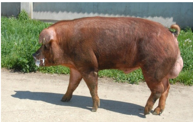
Slika 3: Nerast durok

Durok je američka pasmina svinja nastala u 19. stoljeću crvenkasto smeđe boje dlake dobrih tovnih i klaoničkih svojstava, dobre otpornosti na stres te dobre kakvoće mesa koja se očituje prvenstveno visokim udjelom intramuskularne masti. Glava ove pasmine je nešto teža, s poluklopavim ušima. Noge su u pravilu snažne i dosta duge, što omogućuje dobro kretanje na