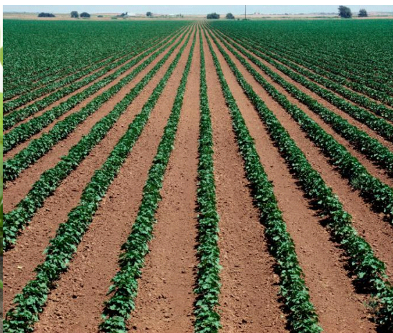
Slika 11. Soja nakon prihrane i kultivacije