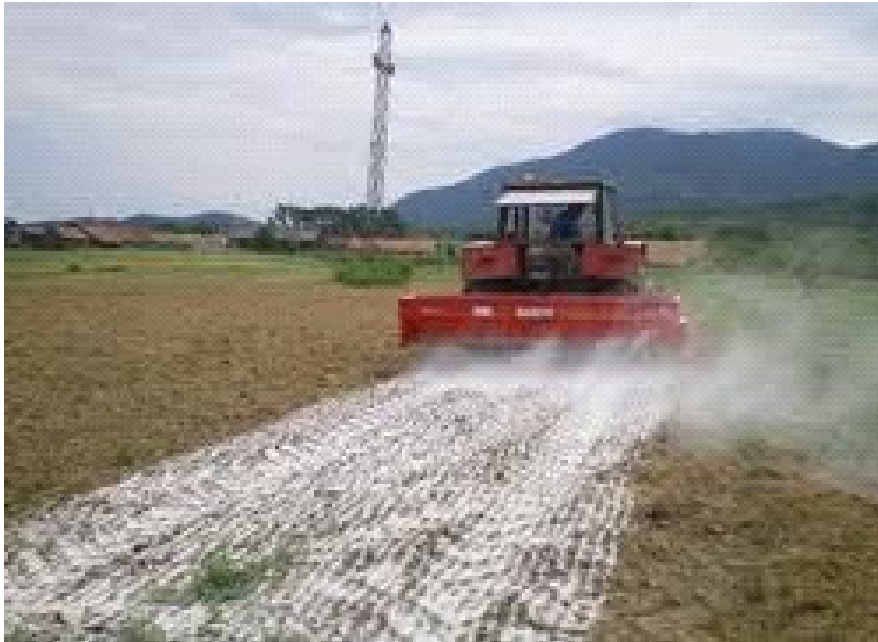
Slika 17. Kalcizacija tla na PG Mario Lučić

Mogućnost unaprjeđenja ratarske proizvodnje na PG „Mario Lučić“, a koja proizlazi iz podataka i kemijske analize tla, je kalcizacija. Ovisno o izvoru i vrsti materijala za kalcizaciju, ovisiti će i distribucija na njivi, a ljetni period i prašenje strništa, zatim pravo oranje garancija su najboljeg rasporeda i najbrže aktivacije unutar cijelog oraničnog sloja (Slika 17).