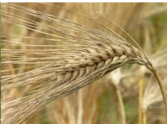
Slika 7. Klas ječma u fazi zriobe na PG