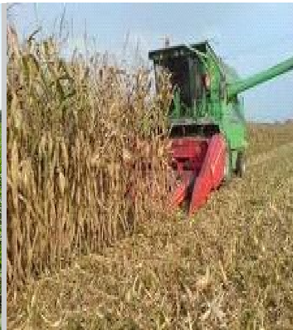
Slika 9. Žetva kukuruza na PG „Mario Lučić“

Na PG „MARIO LUČIĆ“ osim sjetvom merkaltilnog kukuruza za potrebe pri tovu svinja također se bavimo i sjetvom pokusnih hibrida za tvrtku PIONEER. Zastupljeni hibridi i ostvareni prinosi vidljivi su u Tablici 7.