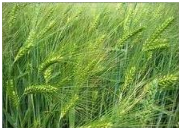
Slika 6. Ječam u fazi nalijevanja zrna na PG

Zadnjih godina sinonim za sjetvu ozimog ječma je pivarski ječam, međutim još uvijek značajno veće površine koje se siju u jesen imaju cilj i namjenu u ishrani stoke. Ove dvije spomenute primjene i jesu najvažniji razlozi uzgoja ozimog ječma.