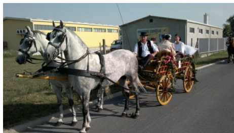
Slika 11. Vožnja fijakerom

Posebno iskustvo je sjediti u fijakeru, slušati topot konja i voziti se kroz šumu, polja ili selo. Kako se živjelo nekoć tajanstvena je i gotovo zaboravljena stvar u mnogim dijelovima svijeta, no u ovom našem kutku i nije neka prevelika tajna. Vožnja fijakerom daje poseban ugođaj i opušta. Vraća u vremena kad su konji bili od velikog značaja po pitanju prijevoza i radne snage.