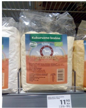
Slika 2. Gotov proizvod, kukuruzno brašno