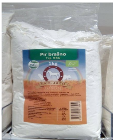
Slika 4. Gotov proizvod, pir brašno