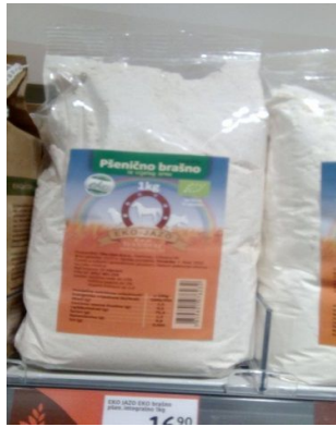
Slika 3. Gotov proizvod, pšenično brašno