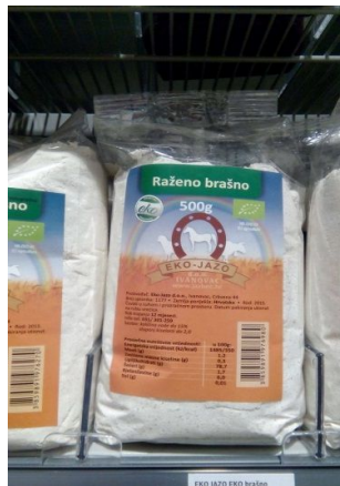
Slika 7. Gotov proizvod, raženo brašno