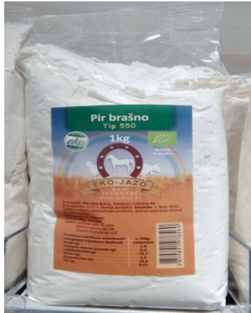
Slika 4. Gotov proizvod, pir brašno