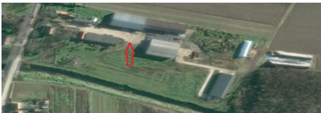
Slika 3. Satelitski prikaz OPG-a