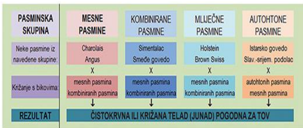
Slika 2. Različite pasmine u tovu junadi

Svakako kada govorimo o tovu junadi i proizvodnji mesa moramo spomenuti i kombinirane pasmine ( Simentalska pasmina , Smeđe govedo , Sivo govedo ) koje su selekcionirane na proizvodnju i mlijeka i mesa (Jakopović, 2007.; Ferizbegović i sur., 2009.; Senčić i sur., 2010.; Kralik i sur., 2011.). Kombinirane pasmine, premda nemaju najbolje toвне predispozicije, mogu dati izvrsne priraste i kvalitetu mesa. Na tovilištima se često mogu zateći križanci, uglavnom mesnih pasmina goveda, koji postižu dobru dinamiku rasta i povoljnu kvalitetu mesa (Slika 2.).