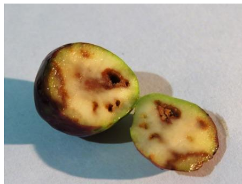
Slika 1. Oštećenja od maslinove muhe

Maslinina muha suzbija se najviše kemijskim putem. U Hrvatskoj su za ovu godinu dopuštena sredstva: Decis 2,5 EC, Rogor 40, Eco-Trap, Perfekthion i dr. Insekticidima se može tretirati čitav maslinik, no dodavanjem atraktanata insekticidima, može se tretirati samo jedan dio nasada. Način suzbijanja određuje se prema praćenju leta muhe. Za praćenje leta koriste se lovne posude (Tephri-trap lovke). U tim posudama nalazi se otopina olfaktornog