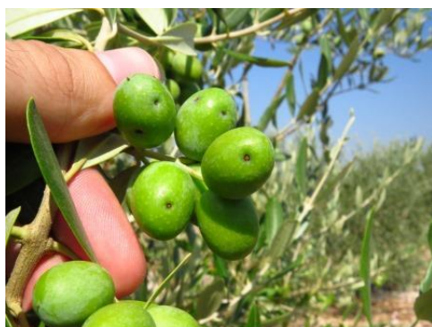
Slika 4. Šteta od svrdlaša na plodu masline

Za suzbijanje svrdlaša, u Republici Hrvatskoj dopušteno je sredstvo Rogor 40.