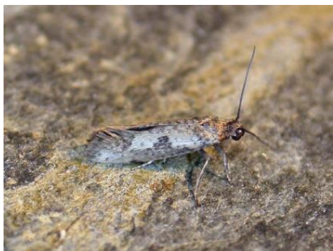
Slika 2. Leptir maslininog moljca

Maslinin moljac prezimljuje u obliku gusjenice, koja se tijekom ožujka kukulji. U periodu pojave cvjetnih resa, iz kukuljice izlijeće leptir (Slika 2.) čija ženka nakon kopulacije odlaze jaja na čašicu cvijeta, prije početka otvaranja cvijeta. Izlaskom iz jajeta, gusjenica se ubušuje u cvjetni pup, gdje se hrani. Gusjenica izlazi i počinje se hraniti izvan cvijeta prelazeći s jednog na drugi, ostavljajući zapredotine. Odrasla gusjenica kukulji se u cvjetnom zapretku ili u suhom lišću na tlu i u lipnju iz kukuljice izlijeće leptir, čije ženke nakon kopulacije odlože i do 120 jaja na čašicu ploda. Nakon tjedan dana izlaze gusjenice, koje se ubušuju u mlade plodove. Gusjenica prestaje s razvojem i napušta plod, koji krajem kolovoza i početkom rujna otpada. Nakon kukuljenja koje je najčešće u tlu, javlja se treća generacija maslinina moljca koja pravi štete na listu. Štete čini gusjenica, koja se po izlasku iz jaja izravno ubušuje u listu tu se hrani lisnim tkivom. Krajem svoga razvoja započinje uništavati list s donje strane, ne dodirujući gornju opnu, tj. epidermu lista. To je ujedno znak kako se u nasadu nalazi maslinin moljac. Gusjenica ove posljednje generacije kukulji se između listova, koje zapreda ili u pukotinama grana i grančica. Suzbijanje se provodi u razdoblju od polaganja jaja pa sve do cvatnje masline (Barbarić i sur., 2014.). Za ovu godinu u Republici Hrvatskoj dopuštena su ova sredstva: Perfekthion, Rogor 40, Baturad WP i drugi.