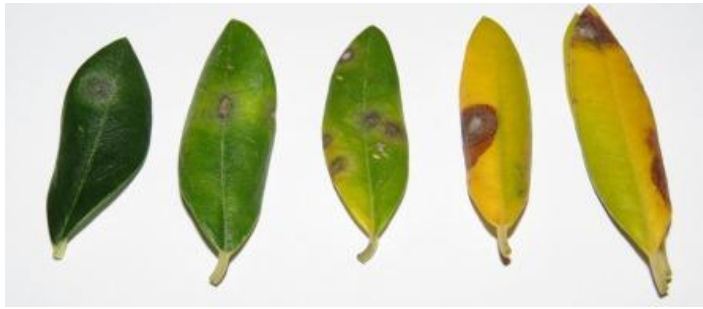
Slika 6. Paunovo oko na listu masline, (autor: Miroslav Filipović)

Iako je gljiva prisutna tijekom cijele godine u masliniku, ipak kroz zimsko razdoblje rijetko se može dijagnosticirati zaraza. Za rano otkrivanje prisutnosti paunovog oka, može se koristiti metoda „rane dijagnoze“ pomoću otopine NaOH ili KOH. Postupak obavljamo tako što mlađe listove potopimo u odabranu otopinu, pri sobnoj temperaturi na 20-23 minute. S pojavom crnih mrlja potvrđena je prisutnost patogena (Cvjetković i Vončina, 2012).