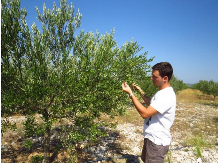
Slika 9. Vizualni pregled, (autor: Miroslav Filipović)

Promatrani maslinici nalaze se na brdovitom području, okruženi šumom i šikarom što doprinosi pojavi štetnika, osobito pipa. Ovisno o štetniku koji se kontrolira, vrši se pregled određenog biljnog organa.