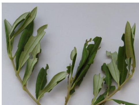
Slika 5. Grizotine od pipe na lišću masline

Maslinina pipa je crne boje, veličine 10-12mm. Štete radi na listovima u vidu grizotina na rubovima. Hrani se noću, a danju je skrivena u zemlji ili pod kamenom. Pri jačoj pojavi može smanjiti rast mladih izboja. Najčešće stradaju masline koje su u fazi obnove zbog starosti ili požara. Ličinke žive u tlu i hrane se korijenjem različitog bilja. Pipe se mogu mehanički odstraniti ili postaviti lovni pojasevi na deblo, budući da pipe ne lete (Maceljski, 2002.).