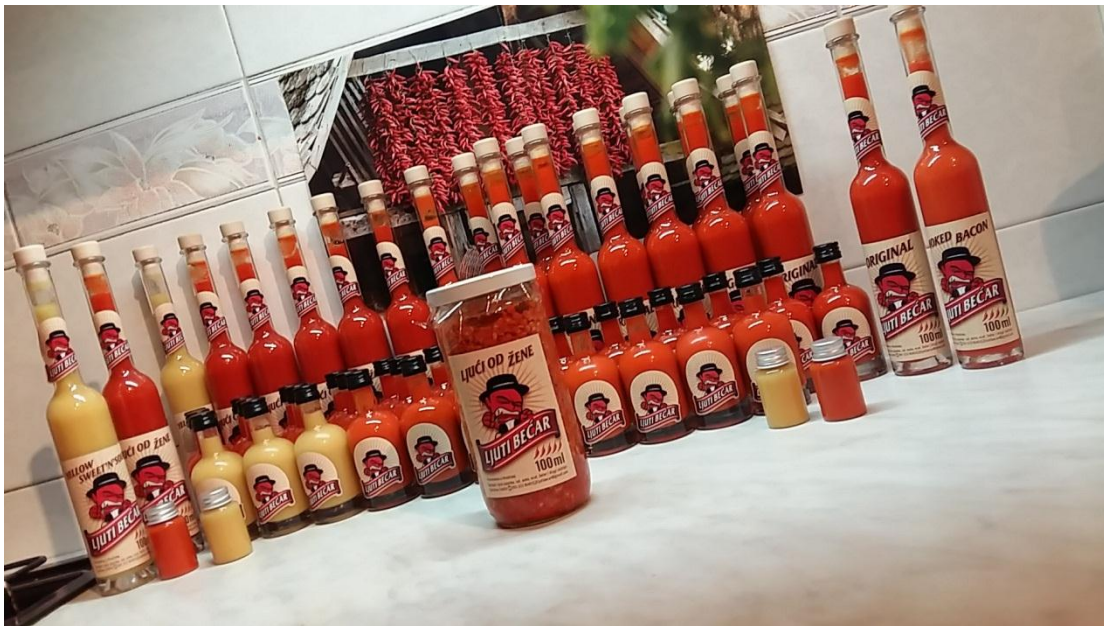
Slika 8. Vlastiti proizvodi, umaci i ajvar