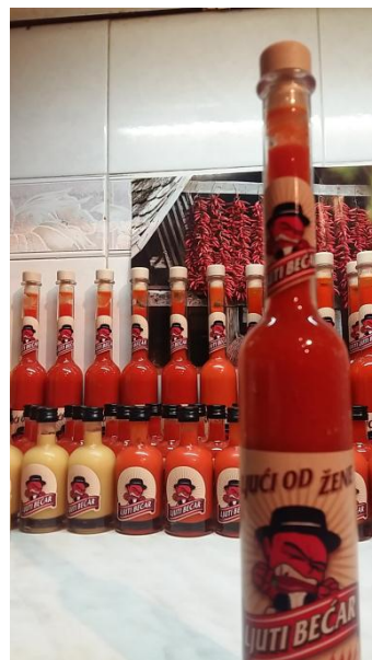
Slika 9. Vlastiti proizvod – umak "Ljući od žene"