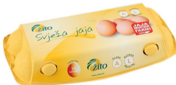
Slika 5: Jaja A klase tvrtke Žito d.o.o. (Konzum, 2016.)

Oznake otisnute na jajima i stavljene na pakiranje moraju biti jasno vidljive i čitljive. Boja koja se koristi za označavanje jaja mora udovoljavati odredbama posebnog propisa kojim se uređuje uporaba boja za korištenje u hrani namijenjenoj prehrani ljudi. Jaja »A« klase moraju u trenutku pakiranja ispunjavati najmanje sljedeće uvjete: