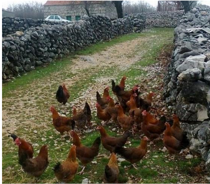
Slika 8: Ekološki uzgoj kokoši Hrvatica (Agroklub, 2015.)

ljudi. Temelji se na zakonskoj regulativi relativno novijeg datuma, koja je u zemljama Europske Unije donesena 1999. godine, a u našoj zemlji 2002. godine (Gudelj – Velaga, 2004). Ekološkim stočarstvom danas se u svijetu bavi razmjerno mali broj ljudi, iako se broj gospodarstava s takvim načinom uzgoja životinja neprekidno povećava (Senčić, 2004). To isto vrijedi za našu zemlju, pri čemu proizvođači poseban interes iskazuju za ekološkim uzgojem peradi.