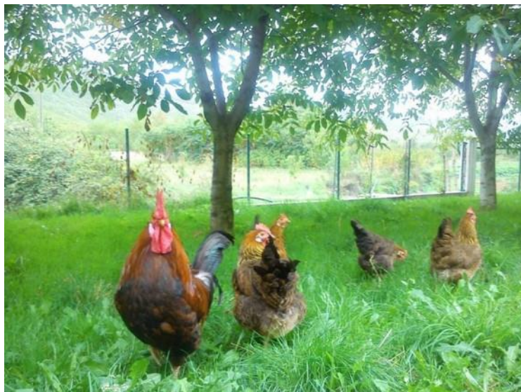
Slika 7: Koke nesilice iz eko uzgoja

Još do prije dvadesetak godina, u sklopu gotovo svakog seoskog gospodarstva, nalazile su se i životinje. Gospodarstva bez životinja bila su rijetkost. No, ondašnja gospodarstva nisu imala samo jednu vrstu životinja, krave npr., već su se tu obično nalazile i mnoge druge životinje, poput svinja, konja, magaraca, mazgi, kokošiju (slika 7, 8), purana, pataka, gusaka, ovaca, koza, pčela, pasa, mačaka, kunića, pa čak i pauna.