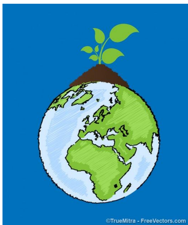
Slika 1: Ekologija u svijetu

j) njegovanju razumijevanja za prirodu, njenih ritmova i zakona; očuvanju i suradnji s prirodom, te njegovanju estetike i smisla za dobro i lijepo (Znaor, 1996.).