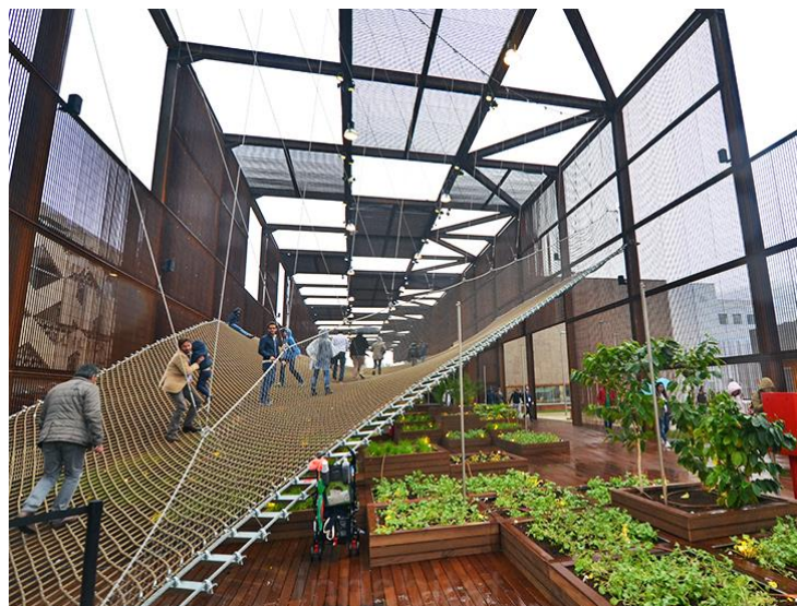
Slika 2: EXPO u Milanu, 2015. godine (Inhabitat, 2015.)

Impresivan uvid u istraživanja o kvaliteti ekološki uzgojenih namirnica ilustriramo studijom Francuske agencije za sigurnost hrane koja je provela evaluaciju nutritivne i zdravstvene kvalitete ekološke hrane, čiji je zaključak da ekološki proizvodi sadrže više minerala kao što su željezo i magnezij te više antioksidativnih mikronutrijenata poput fenola i salicilne kiseline (Biovega, 2016.).