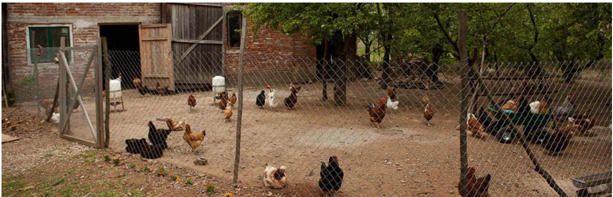
Slika 12 : Ekološki uzgoj kokoši (Linatura, 2016.)