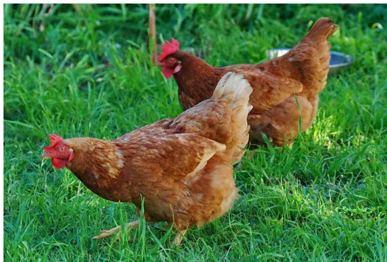
Slika 10: Hibrid Lohman Brown (PBase, 2010.)

Od komercijalnih hibrida to su: Hisex Ranger , Lohmann Tradition (slika 10) i Bovans Goldine , te pasmine New Hampshire , Plimutrok , Australop , te Hrvatica (Senčić Đ., 2011.).