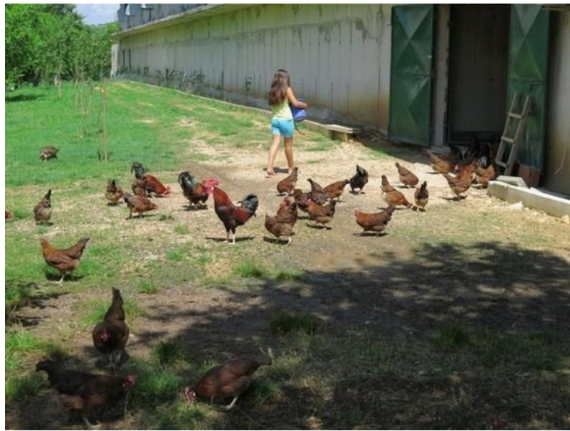
Slika 11: Uzgoj kokoši na otvorenom u Postinju Donjem. (Agroklub, 2015.)