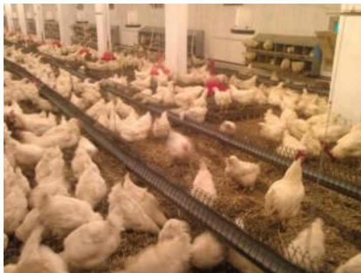
Slika 9: Ravne hranilice (Sremske novine, 2011.)