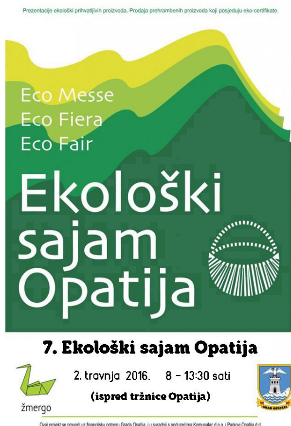
Slika 3: Ekološki sajam u Opatiji, 2016. godine (Zmergo, 2016.)