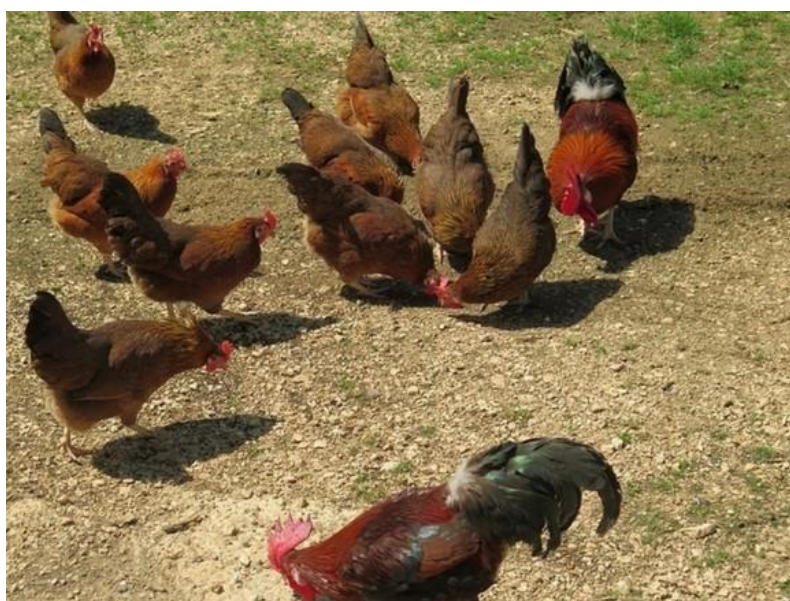
Slika 13: Ekološki uzgoj kokoši Hrvatice 2 (Eko poduzetnik, 2016.)

Polazeći od činjenice kako se proizvodnja konzumnih jaja na obiteljskim gospodarstvima u Hrvatskoj odvija na tradicionalan način , bez korištenja novih spoznaja koje doprinose dugoročno većoj i boljoj proizvodnosti te automatski i ostvarivanju povoljnijih financijskih rezultata; Janječić (2011) proveo je istraživanje s ciljem pronalaženja najboljeg rješenja u tehnologiji proizvodnje peradi na alternativne načine. Ističe da su jaja proizvedena alternativnim držanjem peradi, proizvod koji ima svoje mjesto na europskom tržištu, a time i na domaćem tržištu sve više kupaca pokazuju interes za takav proizvod. Također ističe kako je važan značaj hrvatske izvorne pasmine kokoši Hrvatice (slika 13) i to radi njene vrijednosti i jedinstvenosti gena, adaptabilnosti i otpornosti, proizvodnje jaja i mesa visoke kakvoće, održavanja prepoznavanja ruralnih sredina i funkcije u očuvanju staništa.