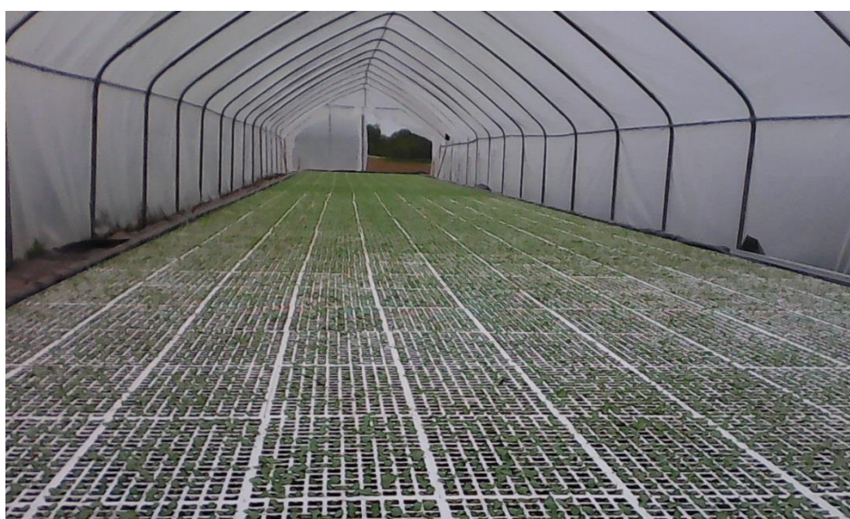
Slika 6. Kontejnerske presadnice na vodi, OPG Vuković

Na slikama 6, 7, 8 i 9 prikazana je proizvodnja presadnica u plastenicima, a na slikama 10, 11, 12, 13, 14, 15, 16 i 17 proizvodnja duhana na polju.