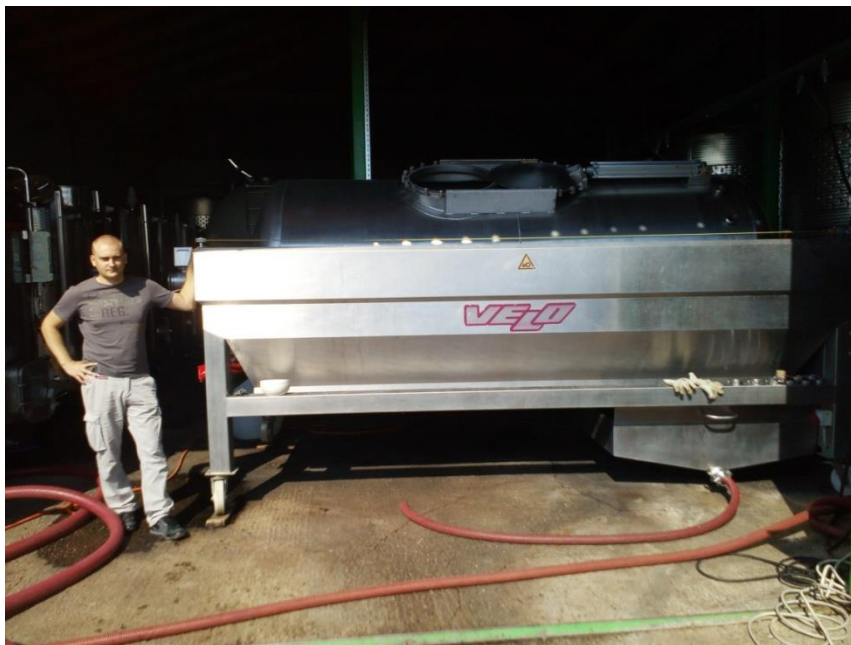
Slika 8. Pneumatska preša zapremine 5 270 l u vinariji Josić

Na kvalitetu prešavine utječe više čimbenika kao kvaliteta same sirovine, uvjeti punjenja preše i tijekom prešanja, pritisak i broj ciklusa prešanja. Može se reći da vina prešavina imaju veću koncentraciju svih sastojaka osim alkohola.