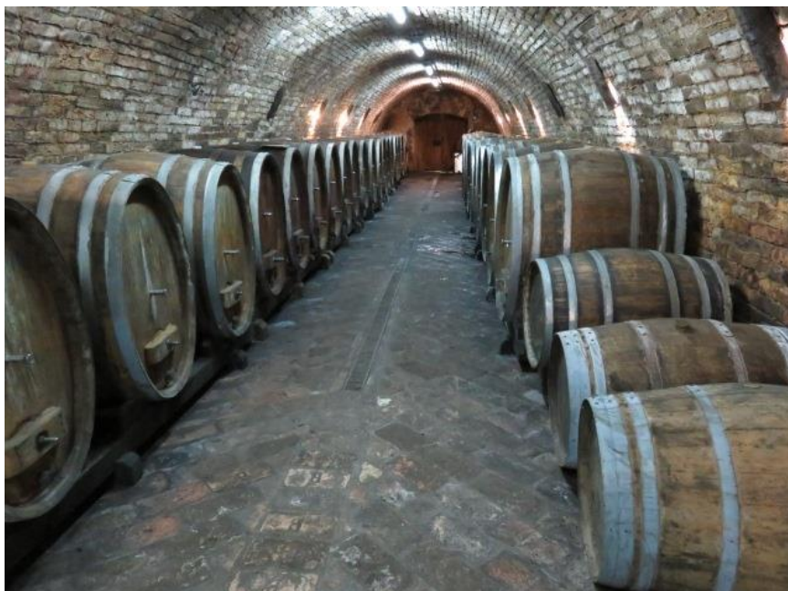
Slika 2. Podrum s drvenim bačvama u vinariji Josić

plijesnivu bačvu. Da do toga ne bi došlo, potrebno je poduzeti niz mjera. Čim se bačva isprazni prvo ju je potrebno oprati čistom, hladnom vodom, a zatim vreloom. Nakon što se bačva valjanjem ohladi, potrebno je ispustiti vodu, zatim ponovno dobro isprati hladnom vodom. Kod posljednjeg ispiranja na svakih 30 l vode preporučljivo je staviti po 50 grama vinske kiseline. Bačvu je potrebno ocijediti, osušiti te suhu sumporiti. Bačva se sumpori suha jer sumporni dioksid u doticaju s vodom prelazi u sumpornu kiselinu koja u vinu nije poželjna. Na volumen bačve od 300 litara dovoljna je jedna sumporna traka. Ukoliko se bačvu neće koristiti za držanje vina, tada se postupak sumporenja treba ponoviti svakih pet do šest tjedana. To je tzv. suhi postupak sumporenja bačve. Ako se bačve nalaze u suviše suhim prostorijama, preporučuje se mokro konzerviranje bačava. Ono je potrebno da se bačve ne bi rasušile.