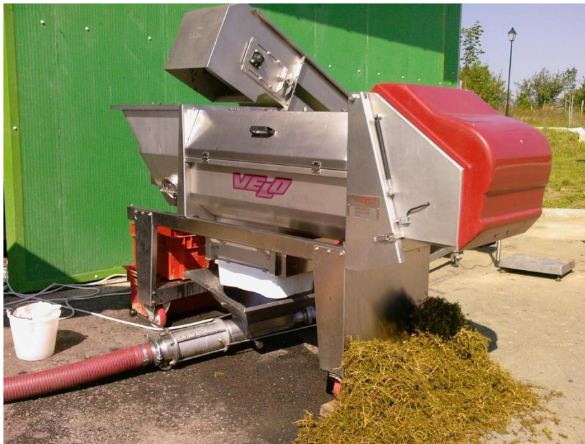
Slika 5. Runjača - muljača u vinariji Josić

Iz tablice 2. može se vidjeti da je najveća količina antocijana dobijena maceracijom s pokožicom, a najmanja maceracijom s peteljkom (posljedica apsorpcije krutih dijelova grozda). S druge strane sadržaj tanina i fenolnih sastojaka najmanji je u varijanti mošt i pokožica, a najveći u varijanti maceracije s peteljka. Zato u nekim slučajevima to može biti i koristan način prerade i faktor kvalitete (npr. u slučajevima kad želimo vina jake strukture koja će dugo vremena odležavati - sazrijevati).