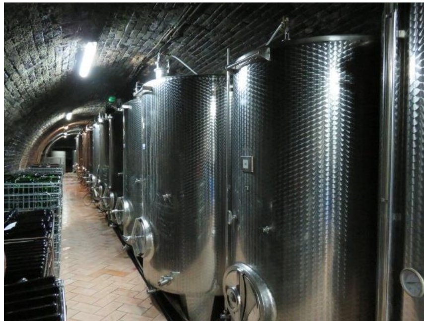
Slika 1. Podrum s inox tankovima u vinariji Josić

U podrumu je vrlo važna toplinska izolacija kako bi se održavala što jednoličnija temperatura i zimi i ljeti. Za bijela vina, primjerice, preporučena je temperatura od 8-10°C, a za crna od 10-12°C. Velike temperaturne promjene mogu naškoditi vinu. Preporučljivo je osigurati takve uvjete da variranja u dnevnim temperaturama ne odstupaju više od 2%. Kod previsoke temperature vino prebrzo sazrije i time gubi svoje kvalitete, jer se nije uspjelo dovoljno razviti. Preniska temperatura usporit će sazrijevanje vina. Vlaga zraka treba biti između 70 i 80%. Prevelika vlaga u podrumu smanjuje vijek trajanja bačvi zbog povećanog razmnožavanja raznih vrsta gljivica i plijesni, a premalena vlaga i viša temperatura dovode do bržeg hlapljenja vina iz drvenih bačvi te treba češće kontrolirati jesu li bačve pune do vrha. Zbog toga podrum treba imati dobru ventilaciju, kao i dobru kanalizaciju za odvod vode iz podruma. Vrlo je važno imati i mogućnost zagrijavanja podrumskih prostorija, odnosno vrionice.