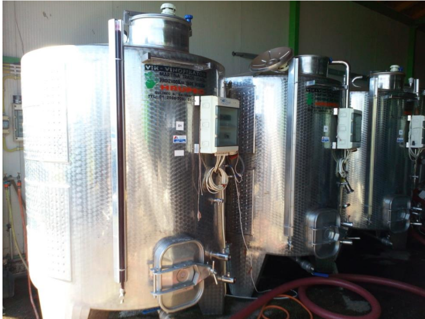
Slika 6. Vinifikatori zapremine 3 000 l u vinariji Josić