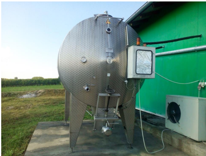
Slika 7. Veliki macerator zapremine 10 000 l u vinariji Josić