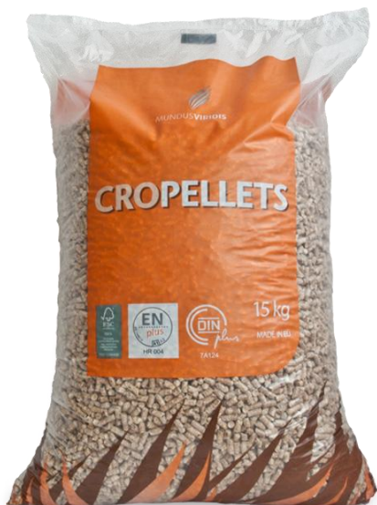
Slika 4. Pelet u ambalaži