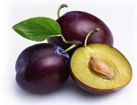
Slika 2. Plod šljive

Peletiranje je općenito definirano kao ukрупnjavanje praškastoga i sitnozrnatoga materijala u prisutnosti veziva u proizvod kuglasta oblika (pelet) upotrebljiv u kovinarstvu, rudarstvu, kem. tehnologiji i dr. ( natuknica „peletiranje“ na : http://www.hrleksikon.info/ ).