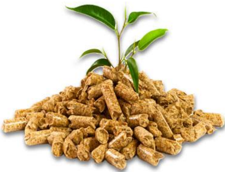
Slika 3. Pelet