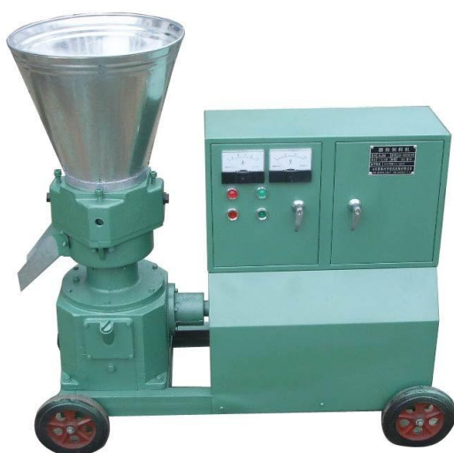
Slika 5. Stroj za peletiranje ( peletirka)