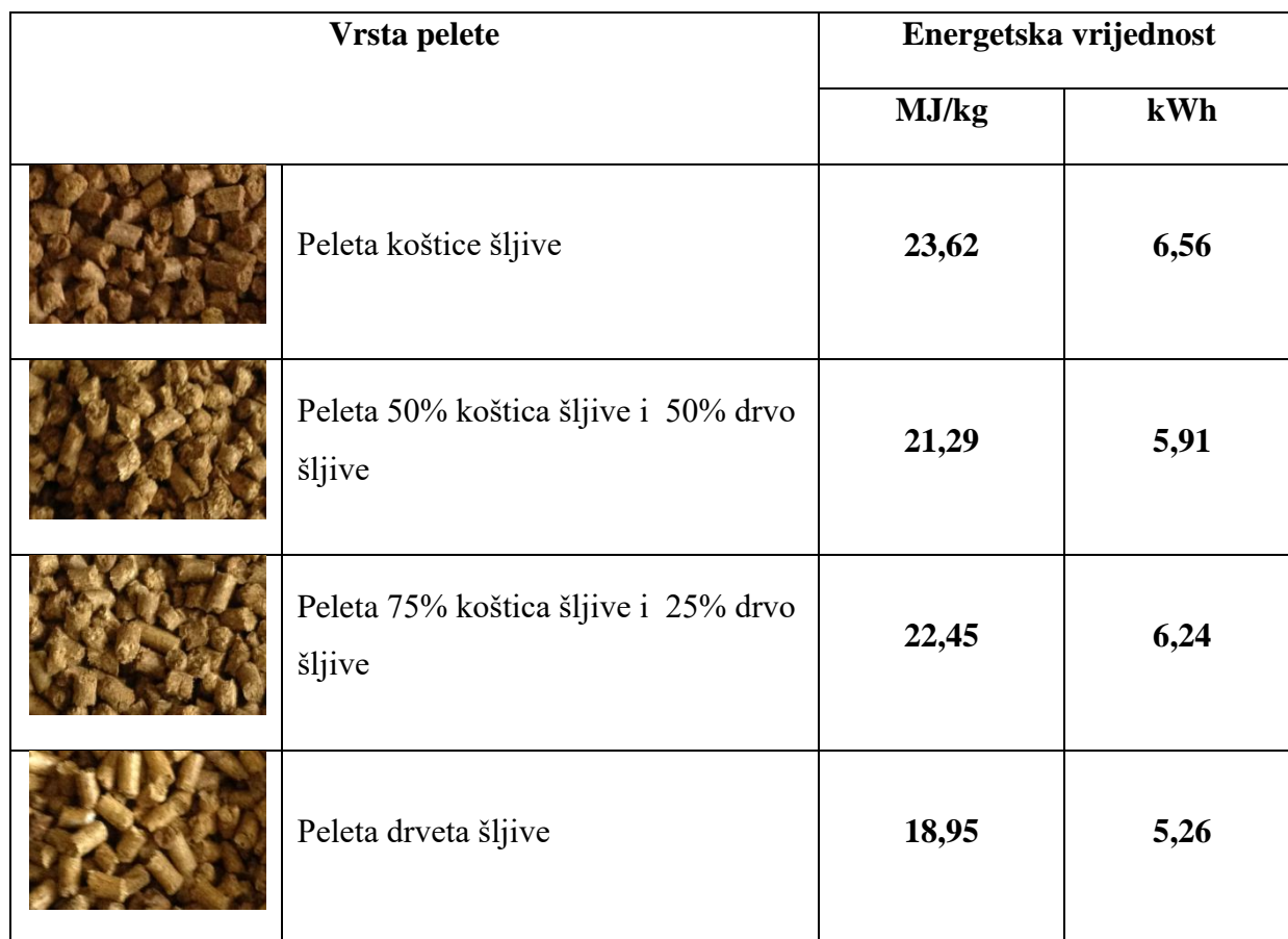
Tablica 4. Energetske vrijednosti proizvedenih peleta

Približne energetske vrijednosti koje odgovaraju peletama prikazane su u Tablici 5.