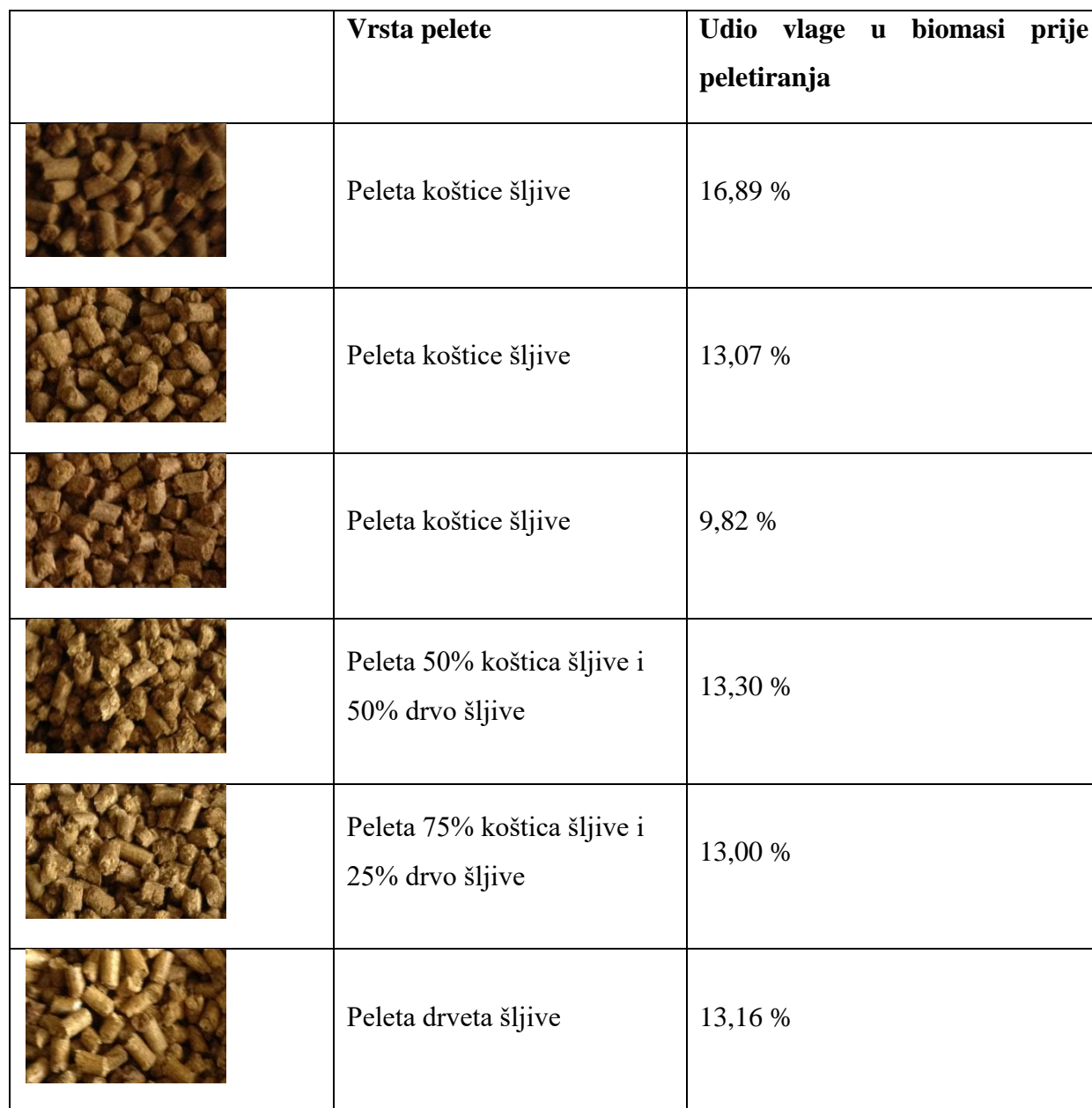
Tablica 3. Izgled proizvedenih peleta s obzirom na vrstu sirovine i udjela vlage.

Biomasa od same koštice nije se pokazala pogodna za proizvodnju peleta jer nemaju čvrstoće i lako se rune, te kao takve su nepovoljne za pakiranje i transport. Kombiniranjem drvne biomase u omjeru 25 % naprema 75% koštice nije u značajnijoj mjeri popravilo strukturu i tvrdoću proizvedenih peleta. Udio 50% :50% također nije značajnije poboljšao tvrdoću proizvedenih peleta. Poboljšanje tvrdoće peleta od koštica može se postići na dva načina: povećanjem udjela drvne biomase ili dodavanjem kalcija lignosulphonate koji povećava