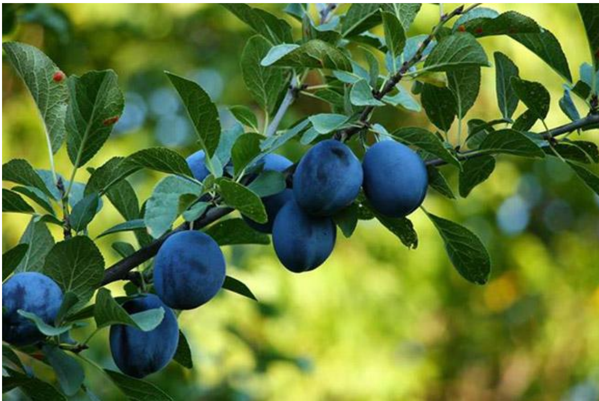
Slika 1. Šljiva