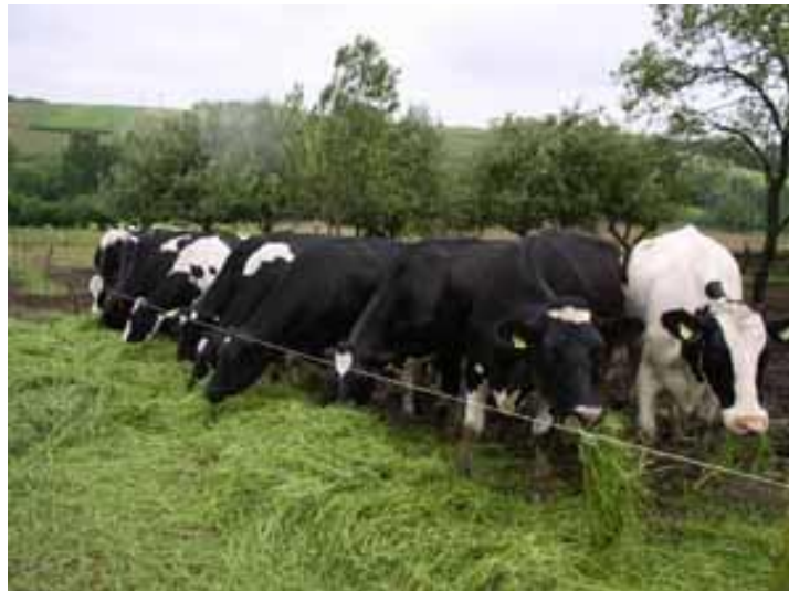
Slika 3. Ishrana stoke zelenom krmom

Kod nas se ipak još nedovoljno koriste postrni usjevi za zelenu hranidbu. Najveći dio površina je neobrađen te se na njima napasuje stoku ili ostavlja tlo tako neiskorišteno 9 od 10 mjeseci, ali za to vrijeme bi se mogla proizvesti velika količina stočne krme. Zelenu i svježnu krmu dobivamo od postrnih usjeva baš u ono vrijeme kada je nemamo od glavnih usjeva. To je od posebnog značaja u krajevima s malo dobrih pašnjaka, gdje može nestati krme u vrijeme prehrane stoke u stajama. Postrnim usjevima ćemo dobiti znatnu količinu krme te ćemo moći stoku bolje prehraniti preko zime a samim time dobiti više mlijeka.