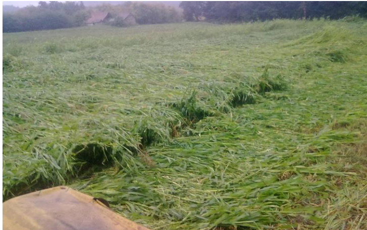
Slika 4. Sirak za zelenu krmu

Sirak – u hranidbi domaćih životinja koristi se zrno ili nadzemna masa (zelena krma, silaža, sijeno). Sirak je nešto hranjiviji od kukuruza, a i bolje podnosi sušu. Za silažu se sije u redove razmaka 40-50 cm, a za zelenu kosidbu nešto gušće 20-30cm. Za silažu se kosi 14 dana prije zriobe a za krmu pri visini oko 1-1,5 m. U silaži toksične količine HCN smanjujemo isparavanjem u tijeku vađenja i primjene silaže, a u sijenu tijekom sušenja. Možemo ga koristiti i do 2-3 puta tijekom vegetacije zbog visoke biološke regeneracije nadzemne mase. Prinos zelene mase se kreće oko 70-120 t/ha a zrna 5-8 t/ha.