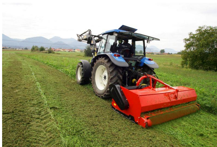
Slika 10. Malčiranje ( http://www.eistra.info/sadrzaj/trebam-ponudu-za-malciranje/11863_11 )

Količina biljne mase koju unesemo u tlo sideracijom kreće se oko 10 do 20 t/ha, uz količinu korijena 1-3 t/ha.