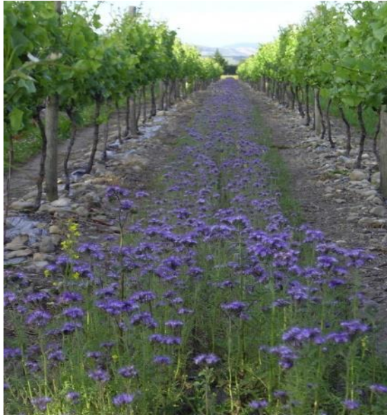
Slika 13. Fecelija

Engleski ljulj – Pogodan je za ispašu svih vrsta stoke, ali i za košnju. Također je pogodan za ukrasne travnjake i igrališta, te zaštitu od erozije, osobito u smjesama s drugim vrstama trava. Ozimog je tipa rasta, te podnosi mrazeve i duboki snježni pokrivač.