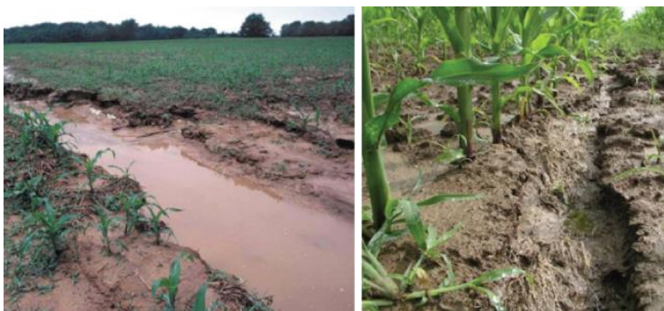
Slika 11. Erozija tla ( http://blog.agrivi.com/hr/post/erozija-tla )

Pod utjecajem vjetra i vode, dolazi do gubitaka površinskih čestica tla i to nazivamo erozijom. Ona uključuje tri različita djelovanja a to su: odvajanje tla, kretanje i taloženje. Može uzrokovati ozbiljan gubitak tla. Ozbiljna stanja degradacije tla koja mogu ubrzati proces erozije tla su: problem zbijenosti tla, niske količine organske tvari, gubitka strukture tla, loše unutarnje drenaže, salinizacije i kiselosti tla. Produktivnost poljoprivrednih površina se smanjuje erozijom tla te može doći do onečišćenja susjednih vodotokova, močvara i jezera. Odošenjem poljoprivrednog tla voda sa sobom nosi i zagađivače poput gnojiva i pesticida. Erozijom tla može doći do dugoročnih troškova gubitkom poljoprivredne proizvodnje, te uzrokuje i taloženje rijeka. Vjetar može otpuhati površinski sloj tla i tako izložiti sadnice ili ih ukopati preduboko. Do brže erozije vodom dolazi na nagnutim terenima, dok do erozije uzrokovane vjetrom dolazi na ravnijim područjima.