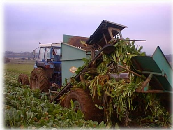
Slika 5. Vađenje korijena postrne repe (Antunović, 2015)

Postrna repa – najraširenija je postrna kultura. Osim kao stočna krma koristi se i u ljudskoj ishrani. Uzgaja se nakon žitarica, industrijskog graška ili ranih krmnih kultura. Za stočnu ishranu se koristi korijen (obično u zimskom razdoblju) i list (u svježem obliku ili za silažu). Njena je prednost što se razvija u prilično kratkom vremenu te vrlo dobro podnosi jesenske mrazove. Način sijanja je omaške ili sijačicom u redove što je i bolje. Razmak između redova se uzima 30-50 cm a u redu 15-20 cm. Sjeme je sitno pa ga treba sijati pliće na dubinu 1-2 cm. Prinos ovisi o klimatskim uvjetima a kreće se 20-40 t/ha lišća i oko 60 t/ha korijena. Optimalna temperatura za nicanje je 20°C a minimalna je 3-4°C. Sadrži nešto više vode od stočne repe pa je manje hranjiva. Što se tiče tla, najbolje uspijeva na lakšim, pjeskovitim tlima, bogatim humusom, neutralne ili blago kisele reakcije.