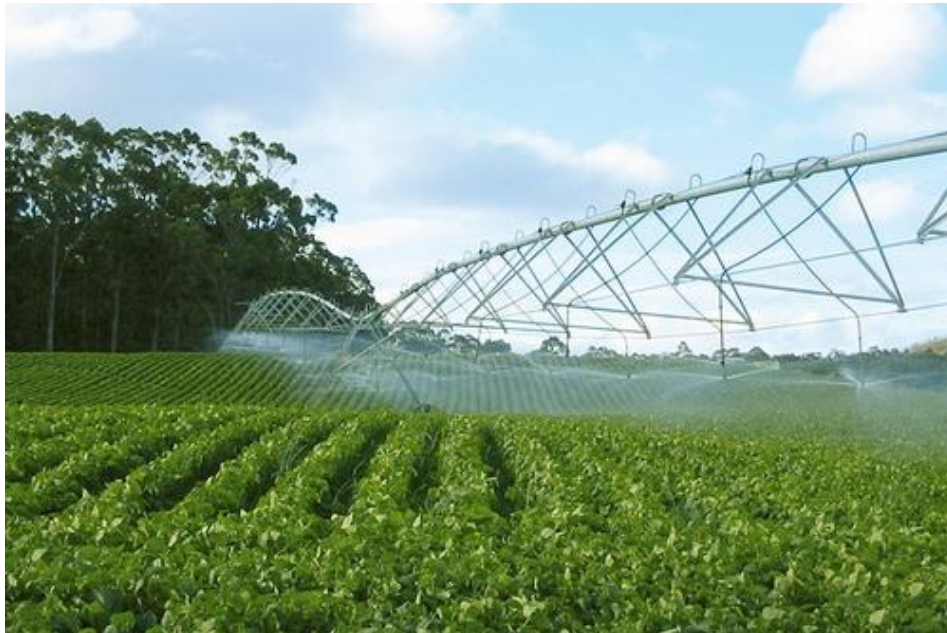
Slika 2. Sustav za navodnjavanje

Ako u uzgoju planiramo navodnjavanje najbolje je nakon sjetve ili u prohodu sa sjetvom obaviti oblikovanje zbijene i profilirane grube površine. Ako želimo smanjiti gubitak vlage i brzog nicanja usjeva, možemo primijeniti obradu tla i sjetvu u trake ili direktnu sjetvu.