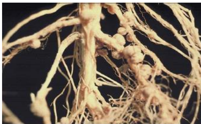
Slika 15. Rhizobium bakterije ( http://www.pfos.hr/upload/documents/Sideracija%20-%20Jug.pdf )

Pojedini usjevi sa dubokim korijenom dobre usisne moći pomažu pri očuvanju makroelemenata koji su skloni ispiranju putem vode. Kada ih usvoje, njihovim razlaganjem dolazi do oslobađanja hraniva u aktivnom dijelu zemljišnog profila. Leguminozne biljke putem kvržičnih bakterija utječu na bolje iskorištavanje fosfora. Lupine svojim korijenskim izlučevinama dovode fosfor u pristupačan oblik za druge biljke.