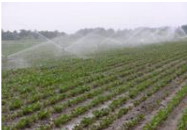
Slika 7. Navodnjavanje povrćarskih kultura

Navodnjavanje – kao što znamo povrćarske kulture zahtjevaju puno vode. Postrna proizvodnja ne može biti zasnovana ako nije osigurana voda za navodnjavanje, jer bi to bio prevelik rizik i financijski gubitak.