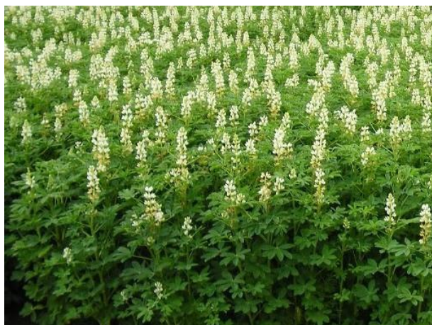
Slika 12. Bijela lupina ( http://www.ekopoduzetnik.com/tekstovi/sve-prednosti-zelene-gnojidbe-20685/ )

Sije se kao glavni i postrni usjev. Bijela slatka lupina se može sijati za silažu u smijesi sa silažnim kukuruzom, sirkom i sudanskom travom. Za zelenu gnojidbu lupinu zaoravamo krajem cvatnje ili početkom zametanja sitnih bobica. Usjev treba povaljati i isjeckati tanjuračem.