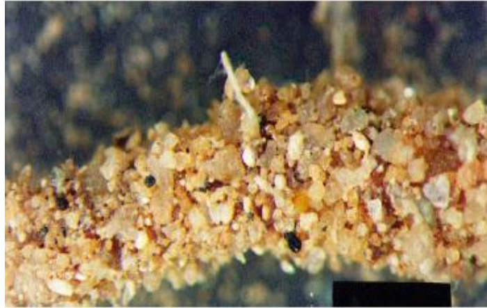
Slika 9. Mikorizne gljive