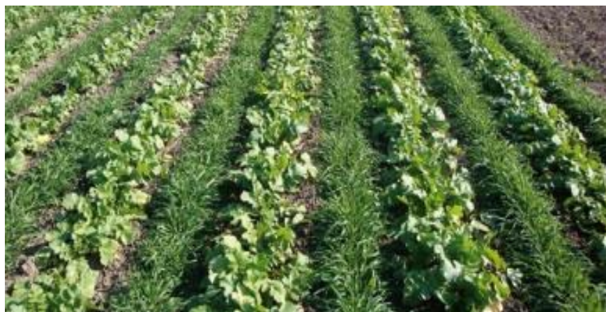
Slika 14. Usjev rotkvice s raži kao pokrovnim usjevom

Živi malč - smjese postrnih usjeva mogu koristiti kao malč koji sprječava korove u početnim fazama rasta glavnog usjeva. Malč je potrebno ukloniti nakon razvoja glavnog usjeva. Koristimo ga najčešće kod povrtlarskih biljaka, zajedno sa određenim jarim usjevima kao što su zrnene leguminoze. Nakon žetve glavnog usjeva, dolazi do brzog porasta postrnih usjeva te tako suzbijaju korove u kasnim ljetnim mjesecima. To je od velikog značaja za ozime usjeve.