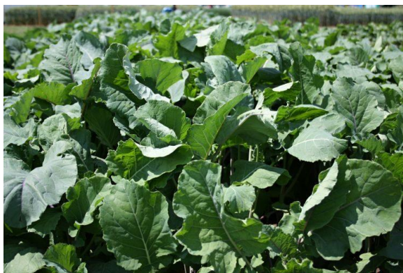
Slika 6. Krmni kelj

Krmni kelj – dvogodišnja je krma koja se koristi u prvoj godini uzgoja. Koristi se u hranidbi domaćih životinja i peradi. Razlikuje se od običnog kelja u tome što ne stvara glavice, nego izrasta stabljika, na kojoj se stvara puno lišća. Povoljniji su krajevi s više oborina, ali dobro uspijeva i u našim istočnim krajevima. Prednost mu je što je otporan prema zimi. Bere se postepeno ili od jednom. Ako ga beremo postepeno onda kidamo samo donje lišće. Lišće se daje stoci pomiješano sa sijenom ili slamom.