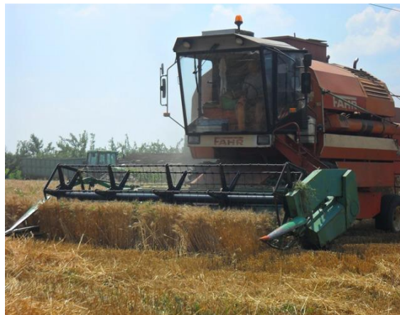
Slika 5. Žetva pšenice

Na Obiteljskom poljoprivrednom gospodarstvu Pero Barišić – Jaman 2014./2015. godine žetva je bila obavljena od 1. do 3. 7. 2015. godine. U narednoj vegetaciji, 2015./2016. godine, žetva je obavljena pomoću kombajna Deutz Fahr 1600 s klasičnim pšeničnim hederom 30. 6. 2016. godine (Slika 5.). Tijekom žetve na lijevoj strani hedera došlo je do osipanja zrna pšenice što svakako treba spriječiti kako bi se smanjili direktni gubici (Slika 6.). Odmah nakon žetve vlasnik gospodarstva je odvezio prikolice sa pšenicom i istovario u Žito d.o.o. Gorjani (Slika 7.).