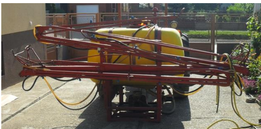
Slika 4. Nošena traktorska prskalica RAUL

U vegetaciji 2015./2016. godine zaštita protiv korova izvršena je identičnim herbicidima i dozama, a obavljena je na sorti Illico 6. 11. 2015 i na sorti Ingenio 28. 11. 2015, a protiv biljnih bolesti obavljena su tri tretiranja fungicidima. Prvi tretman protiv biljnih bolesti izvršen je 7. 4. 2016. godine uz upotrebu Amistara ekstra 0,5 l + Artea plus 0,3 l. Drugi tretman obavljen je 26. 4. 2016. godine uz upotrebu Amistara ekstra 0,5 l. Treći tretman je izvršen za sortu Illico 11. 5. 2016 godine, a za sortu Ingenio 16. 5. 2016. godine uz upotrebu fungicida Amistara ekstra 0,6 l + Magnele 0,5 l (Tablica 12.). Primjena sredstava za zaštitu bilja izvođena je traktorom IMT – 533 za koji je bila agregatirana nošena traktorska prskalica RAUL 600 litara (Slika 4.). Također, zaštita protiv štetnika nije se obavljala kao i prethodne godine jer nije zabilježen napad štetnika iznad praga štetnosti.