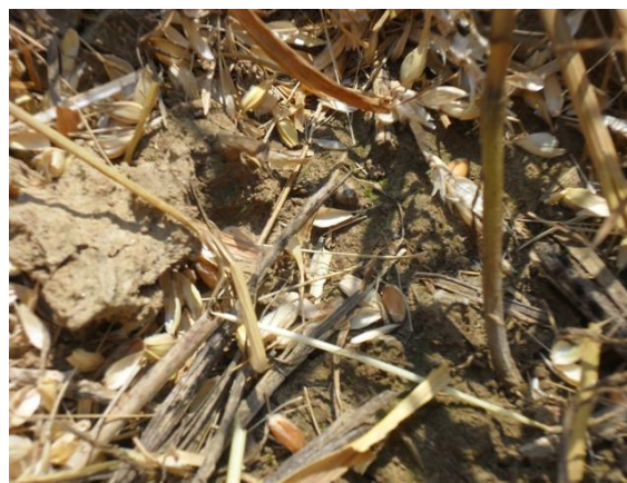
Slika 6. Osipanje zrna pšenice