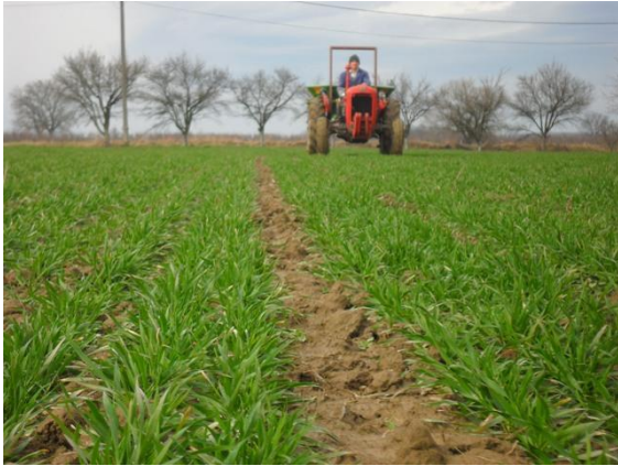
Slika 2. Prva prihrana pšenice