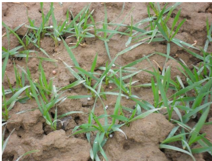
Slika 1. Granule KAN-a na tlu nakon primjene