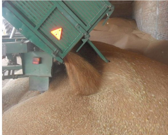
Slika 7. Istovar pšenice