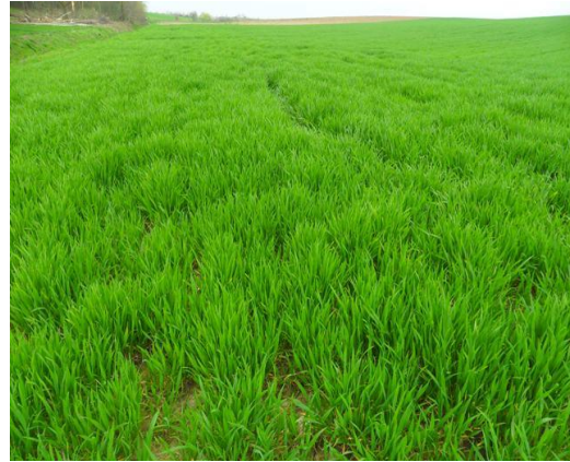
Slika 3. Druga prihrana pšenice