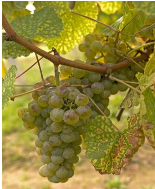
Slika 9. Silvanac zeleni

Ova sorta potječe iz Austrije i jedan je od najpoznatijih kultivara srednje i zapadne Europe. Najviše se uzgaja u Austriji, Slovačkoj, Njemačkoj, Francuskoj, Sloveniji i drugdje, a u novije vrijeme i u prekomorskim zemljama. U nas čistih nasada silvanca zelenog najviše ima u Podravini. Dozrijeva u II. razdoblju. Oplodnja je uglavnom dobra, malo je osjetljiv u cvatnji pri nepovoljnim prilikama. Srednje je otporan na niske zimske temperature, a u proljeće kasno kreće. Osjetljiv je na gljivične bolesti, ponajprije botritis. Prikladna su plodna tla, brežuljkastih prozračnih položaja. Prirodi su redoviti. U dobrim godinama postiže visoku kakvoću. Daje vina nadprosječne vrsnosti, skladno, fina mirisa i okusa, svijetlozelenkaste boje.