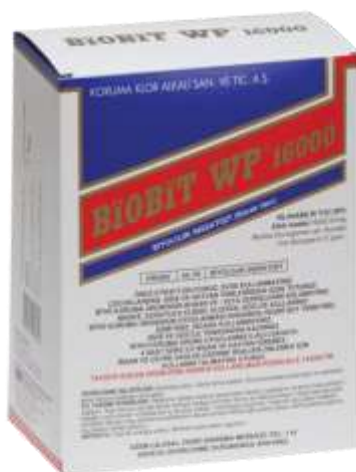
Slika 24. Bioinsekticid Biobit WP