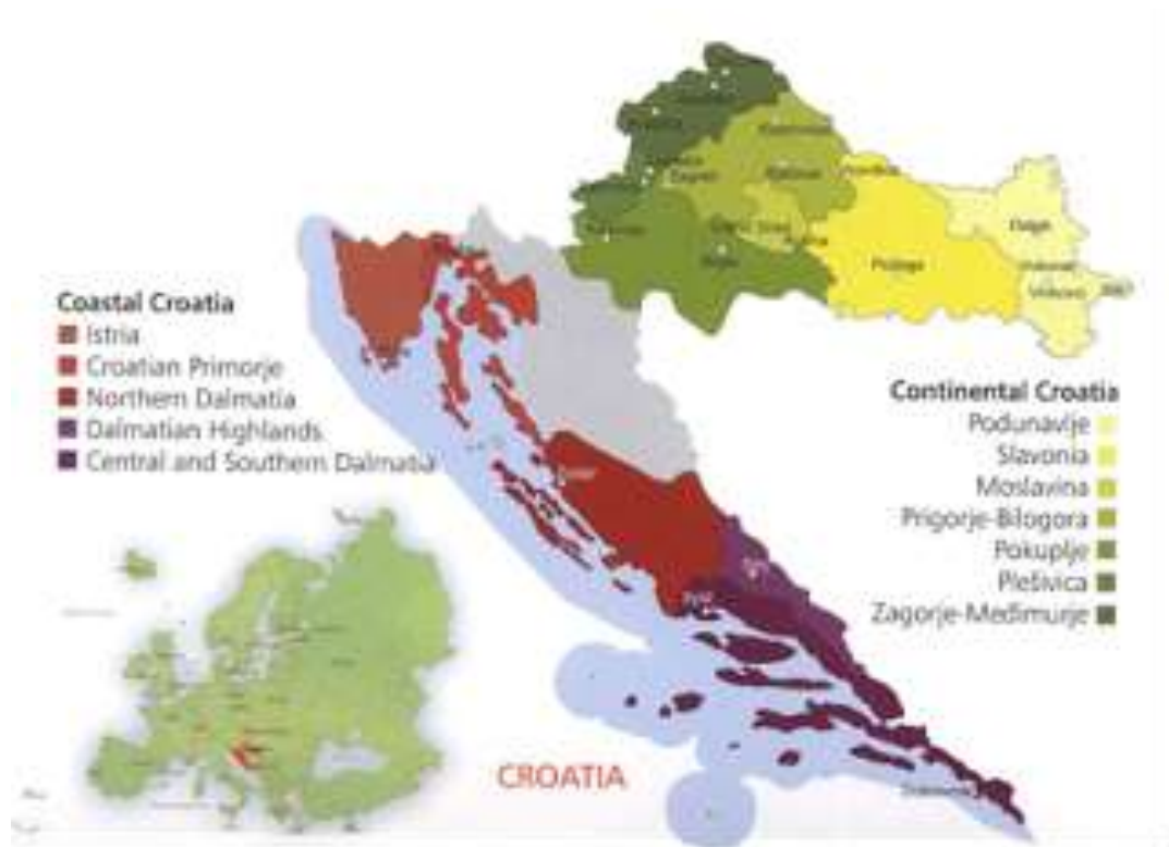
Slika 1. Vinogradarske podregije u Republici Hrvatskoj