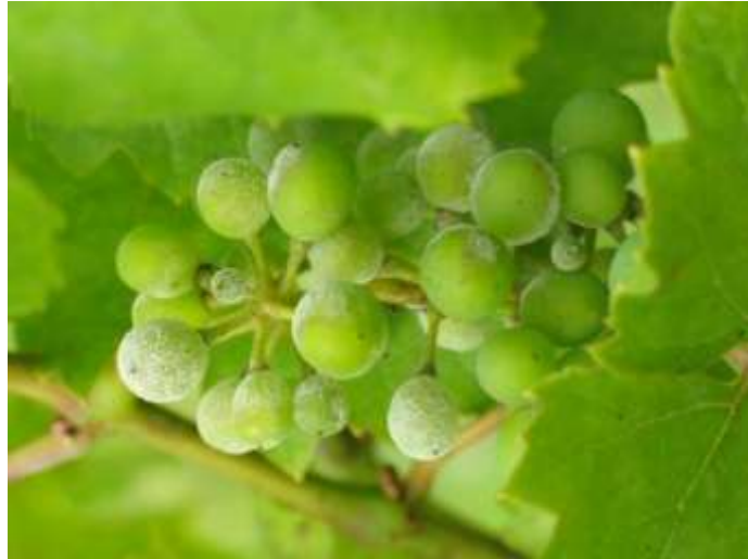
Slika 17. Pepelnica na grozdiću