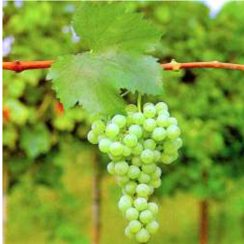
Slika 6. Malvazija istarska bijela

Izvor: http://www.krizevci.net/vinograd/slike/sorte/sorte06_malvazija_istarska_bijela.jpg