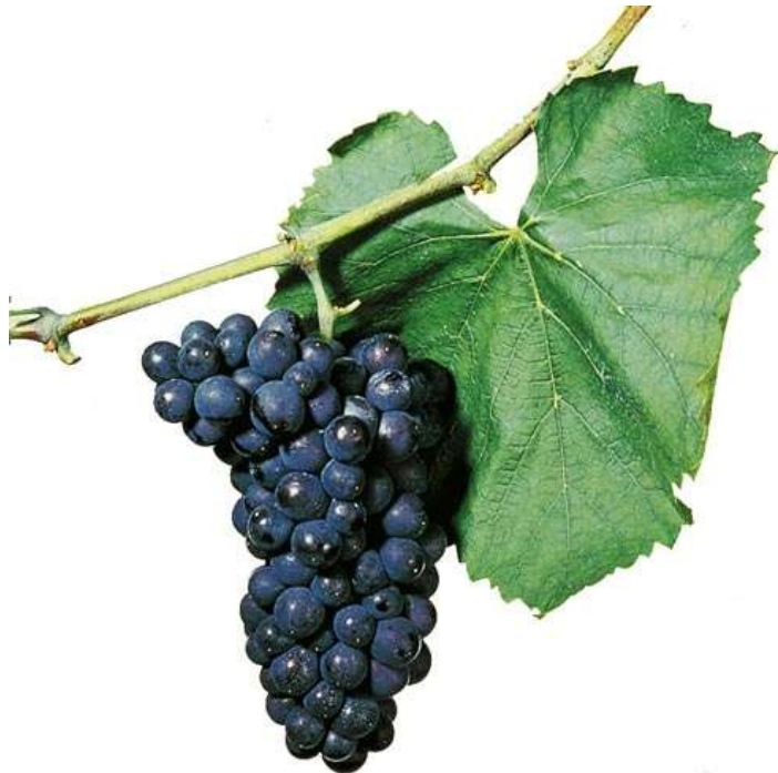
Slika 12. Pinot crni

Aroma ovog vina uvelike ovisi o području sa kojeg dolazi, a najpoznatija vina dolaze sa područja Burgundije. Vino je pogodno za čuvanje.