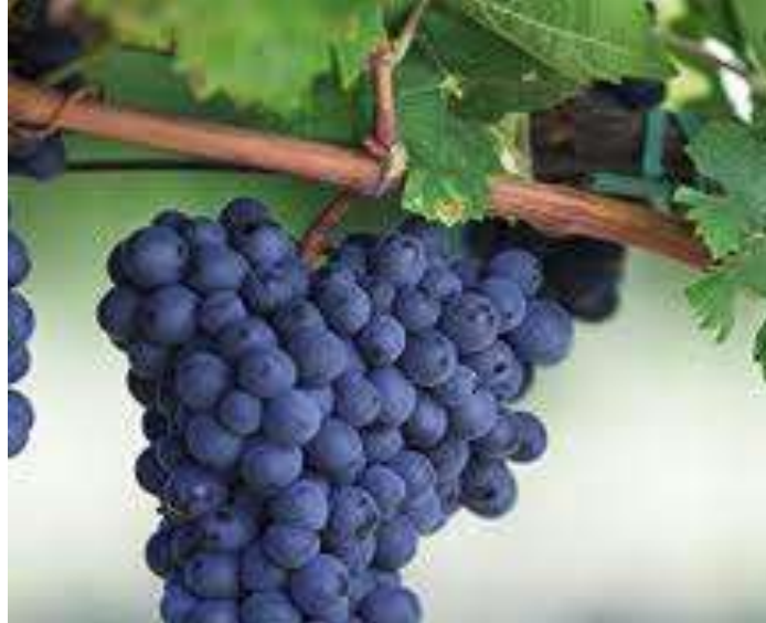
Slika 14. Teran crni

oboljenja, naročito na botritis. Vino je pitko, svjež, naglašene kiselosti i okusa svojevrsnog sorti.