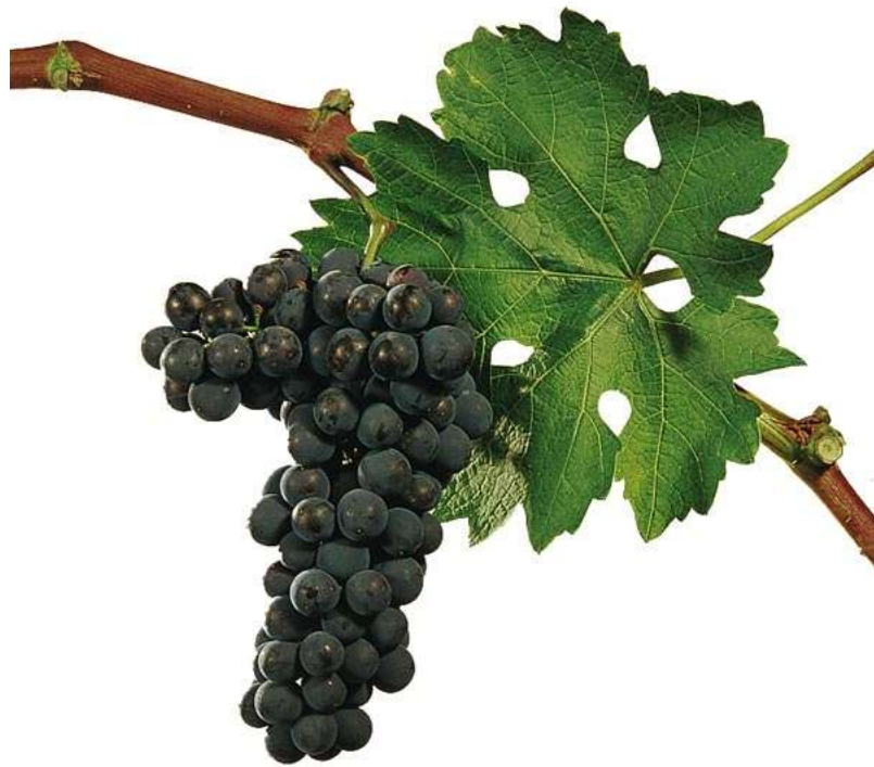
Slika 13. Cabernet sauvignon

suho i harmonično. Alkohol u vinu kreće se od 10 do 13 vol%/l. Vina su prikladna za dugo čuvanje.