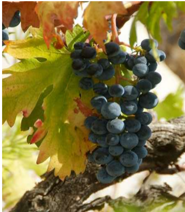
Slika 10. Plavac mali

Plavac mali je najpoznatija i najznačajnija autohtona sorta u Republici Hrvatskoj. Sorta potječe iz Dalmacije, a najpoznatije vinogorje gdje se uzgaja jest poluotok Pelješac. Ključici loze Plavac mali u 19. stoljeću uzeti su u bečkoj carskoj botaničkoj kolekciji i preneseni u SAD. Prvi cijepovi sorte Plavac mali u SAD su zasađeni na otoku Long Island, odakle su se proširili do Kalifornije. U Kaliforniji se Plavac mali uzgaja na oko 20 000 ha pod kalifornijskim imenom Zinfandel. Rodnost većine klonova ovog kultivara redovita je i obilna, a otpornost na gljivične bolesti dobra. Najbolji plavci u Hrvatskoj nastaju na položajima: Dingač, Postup i Hvarska plaža, pa se prodaju pod imenima tih položaja.