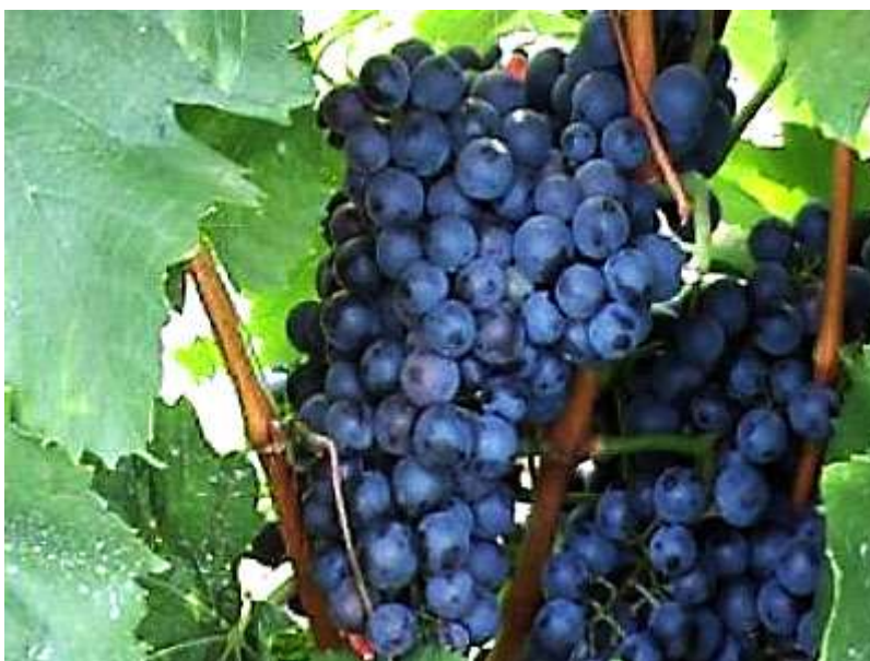
Slika 11. Frankovka

Frankovka je sorta s područja srednje do istočne Europe, pa je prema tome sve te europske države svojataju kao autohtonu, uključujući i Hrvatsku. To je jedna od vodećih vinskih sorata crnog grožđa u nekim podregijama u kontinentalnoj Hrvatskoj. Najrasprostranjenija je u podregijama Slavonija, Moslavina, Plješivica, dok u ostalim podregijama kao što su Zagorje-Međimurje, Podunavlje, Prigorje- Bilogora je manje zastupljena iako je svrstana u preporučene sorte za to područje. Vino je intenzivne rubin crvene boje, srednje gustoće i osvježavajućeg voćnog okusa, prosječni postotak alkohola u vinu je 12 %. Vino se poslužuje blago rashlađeno.