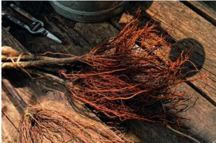
Slika 3. Korijenje cijepova vinove loze

mm. Plojka može biti cijela ili rascjepkana, između glavnih nervi najčešće su izraženi dublji ili plići urezi ili sinusi.