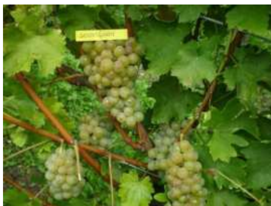
Slika 8. Sauvignon bijeli

Naziva se i muškadni silvanac. Podrijetlom je iz Francuske, a u nas je rasprostranjen u vinogorjima regije Kontinentalna Hrvatska. Bujnog je rasta, prirodni su relativno mali, posebno pri neuravnoteženom odnosu vegetativnog i rodnog kapaciteta, zahtijeva dugi rez. Prilično je otporan na niske temperature, a slabo otporan na botritis. Postiže visok sadržaj sladora i zadovoljavajuće ukupne kiseline. Vino je skladno, bogato, sebi svojstveno, prepoznatljive arome sorte.