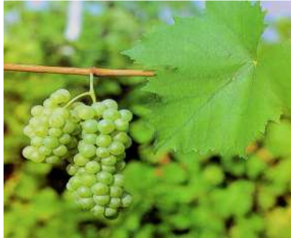
Slika 5. Graševina bijela

vinogradarske regije Kontinentalna Hrvatska. Srednje je bujna, dobre oplodnje, redovitoga i dobrog prinosa. Dozrijeva u III. razdoblju. Ima dobru otpornost na niske temperature. Kakvoća znatno varira s obzirom na ekološke uvijete položaja, godine i opterećenja. Vino je skladnog okusa, mekano, fine sorte arome.