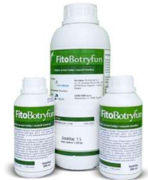
Slika 22. Gnojivo FitoBotryfun

razvoja čuvanja. Može se primjenjivati i tijekom berbe, jer nema karencu. Osim toga, ne ostavlja rezidue na tretiranom grožđu i voću, poboljšava kvalitetu grožđa i ne utječe na korisnu faunu. Preporučene doze kreću se od 2,50 - 3,00 litara po hektaru. Treba izbjegavati primjenu po vjetrovitom i vrućem vremenu.