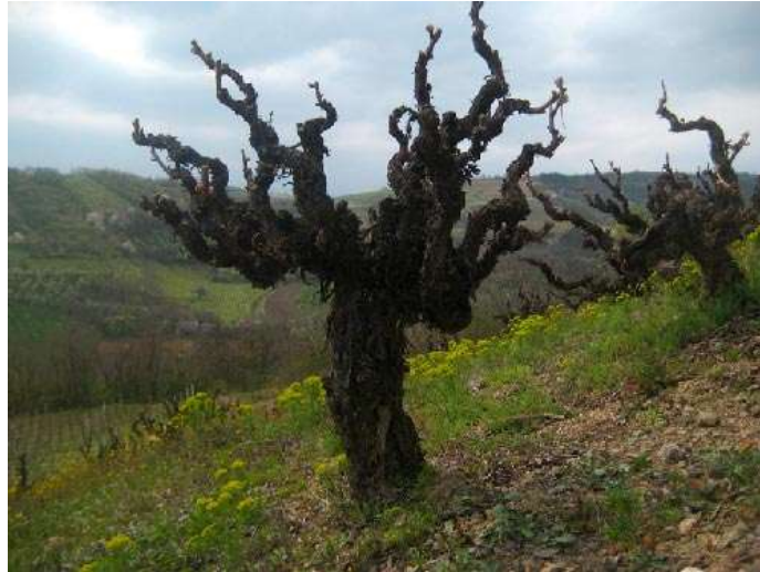
Slika 2. Čokot star preko 120 godina

silvestris - europska divlja loza. Ima mali grozd, sitne bobice, većinom crne boje. Vitis vinifera var. sativa - europska domaća kulturna loza. Ima većinom dvospolni cvijet, krupne grozdove i velike bobice, sočne, visoke kvalitete.