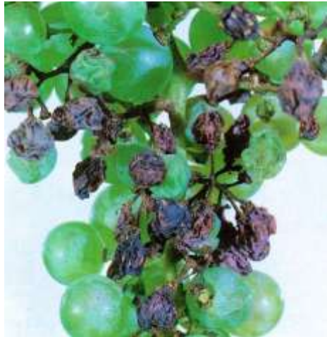
Slika 16. Posljedice plamenjače na grozdu

Agrotehničkim mjerama (sadnja na osunčanim i ocijeđenim terenima, odabir otpornijih sorata, uklanjanje zaperaka), možemo smanjiti vjerojatnost nastanka zaraze. Usprkos provedenim mjerama loza se mora tretirati fungicidima ( preventivni- s površinskim djelovanjem ili sistemici). Uspješnoj borbi protiv plamenjače pomaže prognozna antiperonosopna služba. Ona se temelji na poznavanju uzročnika bolesti, meteorološkim podacima i fungicidima koji se koriste u zaštiti.