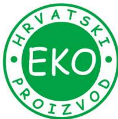
Slika 21. Ekološki proizvod Hrvatske

Zakonom o ekološkoj poljoprivredi te pratećim podzakonskim propisima određeno je što je to ekološka proizvodnja, te tko je nadležan za nadzor i izdavanje certifikata (ekooznaka). Pravilnikom o biljnoj proizvodnji točno su navedene sve mjere, tehnološki postupci i sredstva koja su poželjna i preporučena u procesu uzgoja grožđa i proizvodnje vina u sustavu ekološkog vinogradarstva, te oni koji su zabranjeni, odnosno nespojivi s ovom proizvodnjom. Zakonski je također određeno i vrijeme prelaska, odnosno preusmjeravanja na ekološku proizvodnju. Potrebno je da prođe odgovarajuće vrijeme između početka primjene propisane tehnologije proizvodnje da bi se ona uskladila s temeljnim načelima ekološkog uzgoja, tada se proizvodi mogu deklarirati kao ekološki i nositi odgovarajući znak. Pošto se u vinogradarskoj proizvodnji radi o uzgoju višegodišnje kulture, ovo razdoblje traje od tri do pet godina. Za ekološki uzgoj mogu se odabrati samo površine bez industrijskog oštećenja ili onečišćenja, odnosno ukoliko količina štetnih spojeva (metali, mineralna ulja, policiklički aromatski ugljikovodici) ne prelazi utvrđene granične vrijednosti koje se utvrđuju kemijskom analizom tla u ovlaštenom laboratoriju. Za ekološki uzgoj vinove loze nisu prikladne ni površine u blizini velikih prometnica, odnosno ekološki vinogradi moraju biti udaljeni najmanje 50 m od prometnica na kojima je gustoća prometa 100 vozila na sat ili 20 m ako su odvojeni ogradom visine 1,5 m.