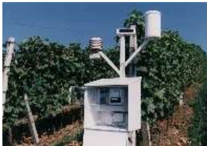
Slika 20. CDA postaja

Da bi se valjano odredile mjere zaštite vinove loze, pojava štetnih organizama mora se pratiti odgovarajućim metodama. Za prognozu suzbijanja i ranog otkrivanja mogućih šteta poželjno je koristiti pouzdane metode i sustave kao što je kompjutorsko dijagnostički sustav u poljoprivredi (CDA - uređaji) kojim se pouzdano određuju rokovi suzbijanja štetnih organizama (Metos, Agra). Preporučuje se korištenje službenih prognoza rizika od napada štetnika i uzročnika bolesti. Optimalni rokovi suzbijanja na osnovi CDA uređaja određuju se na osnovi vremenskih uvjeta tijekom vegetacije (vlaga i temperatura zraka, kiša, rosa, itd.) koji najviše utječu na razvoj bolesti i štetnika i fenofaze vinove loze. CDA uređaj je proizvod visoke tehnologije konstruiran za upotrebu u intenzivnoj poljoprivrednoj proizvodnji. Svrha uređaja je da prikupljanjem i obradom agrometeoroloških podataka pruži pravovremenu informaciju o početku, trajanju i intenzitetu napada određene biljne bolesti, odnosno štetnika. Na taj način omogućeno je precizno određivanje roka tretiranja i olakšan izbor preparata. Pravilnom primjenom uređaja moguće je ostvariti značajne uštede sredstava za zaštitu bilja, kao i traktorskog i ljudskog rada.