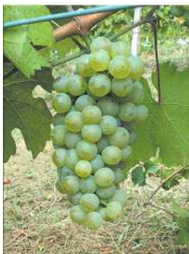
Slika 7. Rizling rajnski