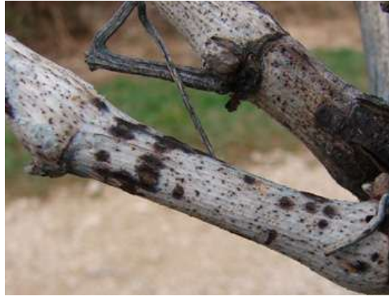
Slika 19. Oštećenja rozgve od crne pjegavosti