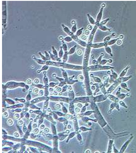
Slika 25. Bakterija Trichoderma harzianum

prskane vinove loze su od 300 - 400 g u 100 l vode. Prskanje se obavlja u vrijeme pune cvatnje. Efikasan je na sojeve botritisa koji su postali rezistentni na kemijske fungicide. Za prskanje jagoda preporučuje se doza od 400g u 100l vode. Karenca za vinovu lozi traje 14, a za jagode 4 dana.