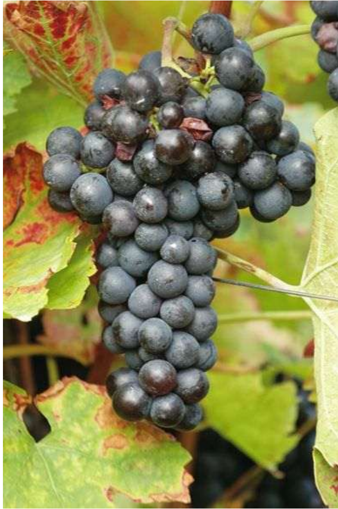
Slika 15. Portugizac