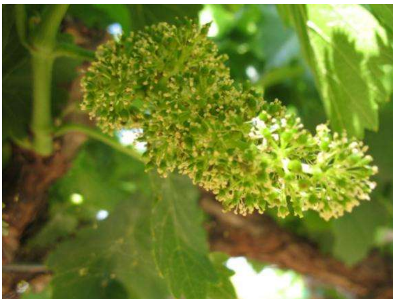
Slika 4. Cvijet vinove loze