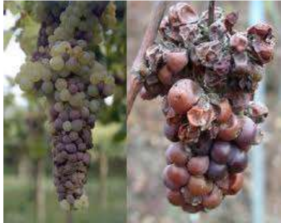
Slika 18. Siva plijesan