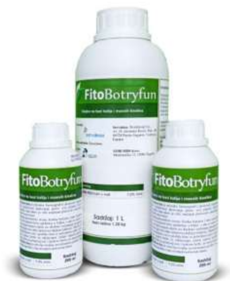
Slika 22. Gnojivo FitoBotryfun

razvoja čuvanja. Može se primjenjivati i tijekom berbe, jer nema karencu. Osim toga, ne ostavlja rezidue na tretiranom grožđu i voću, poboljšava kvalitetu grožđa i ne utječe na korisnu faunu. Preporučene doze kreću se od 2,50 - 3,00 litara po hektaru. Treba izbjegavati primjenu po vjetrovitom i vrućem vremenu.