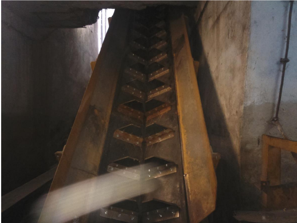
Slika 3. Transportna traka od prebirnog stola ka traci koja vodi do elevatora