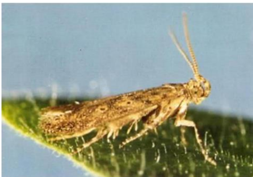
Slika 6. Lisni miner rajčice