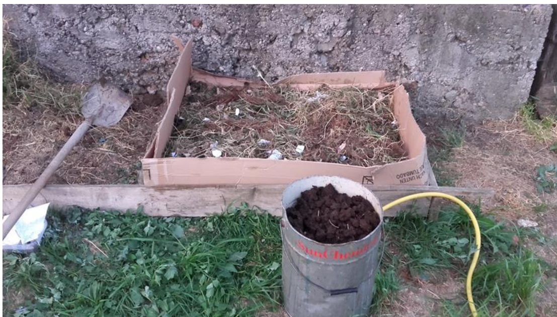
Slika 13: Izrada mjesta za glisnjak