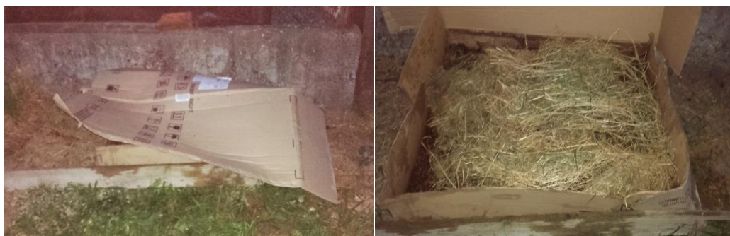
Slika 14: Završni sloj mjesta za glisnjak

Presadnice u sadene u razmaku od 50 cm. Smještene su u sredinu držeći se za stapku. Ogrnute su zemljom te su dobro učvršćene. Sadnja je obavljena 26. travnja 2016. godine. Razmak između redova je ostavljen dosta širok radi višekratne berbe i njege usjeva (Slike 15. i 16.). Svi agroekološki uvjeti – temperatura, svjetlost, voda i tlo su bili optimalni od sadnje pa do berbe. Vremenski uvjeti su bili povoljni za rast korova, tako da je već sredinom svibnja obavljeno prvo mehaničko odstranjivanje korova i plijevljenje nasada. Drugo odstranjivanje korova je obavljeno krajem svibnja kada se obavilo i zagrtanje do prvih donjih listova.