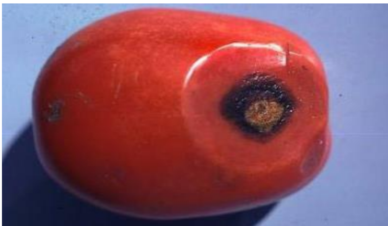
Slika 8: Antraknoza ploda rajčice

Antraknoza, uzrokovana gljivicom Colletotrichum coccodes , je jedno od najčešćih oboljenja rajčice. Prvi simptomi postaju vidljivi na zrelom plodu ili tijekom zrenja kao male kružne mrlje na koži. Kako se ove mrlje počinju širiti, razvija se tamno središte ili koncentrični prstenovi s tamnim pjegama, koje stvaraju spore od gljiva (Slika 8.).