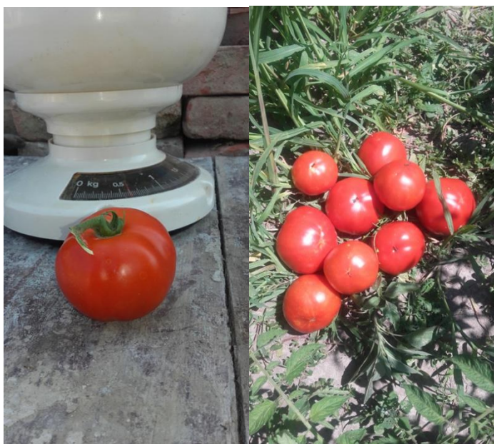
Slika 19: Plod rajčice

Kompostni čaj se općenito koristi na dva načina ili za kontrolu bolesti ili kao hranivo i promotor rasta. Iako je u našim istraživanjima pojava i intenzitet plamenjače bila slabijeg intenziteta uporaba kompostnog čaja je rezultirala većim urodom rajčice u usporedbi s kontrolom. Kompostni čaj pokriva površinski sloj biljke i korijen s mikroorganizmima osiguravajući povoljne uvjete za rast rajčice. Kombinacija kompostnog čaja i hraniva s pokazala kao jeftina, okolišno prihvatljiva i sigurna metoda u kontroli plamenjače rajčice u istraživanjima (Al-Mughrabi, 2007.). Također je utvrđeno da kompostni čaj aktivira induciranu otpornost kod biljaka. Naša istraživanja potvrđuju kosrisnost kompostnog čaja u uzgoju rajčice i kontroli plamenjače rajčice.