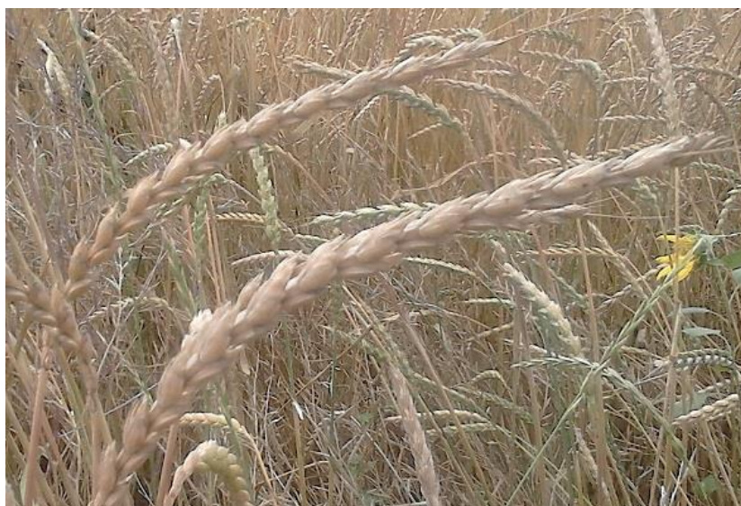
Slika 10. Klas pira u zriobi

predvidjeti kvalitetu uroda. Što je sjajnija pljevica, to je urod kvalitetniji. Treba paziti da se vlaga ne snizi ispod 12%, jer tada pljevice počnu tamniti. Na slici 10. prikazan je klas pira u zriobi. Pir u agroekološkim uvjetima Europe sazrijeva sredinom srpnja. Na površinama obrta „Klica“ žetva je započela 17. srpnja, a završila je pet dana kasnije.