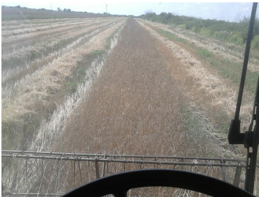
Slika 8. Žetva pira

Žetva pira obavljena je jednofazno žitnim kombajnom Đuro Đaković M1620 (Slike 8. i 9.). Kombajn je kupljen nekoliko dana prije žetve te je prvo pregledan i podešen na ekonomskom dvorištu obrta „Klica“. Od važnijih podešavanja izvršeno je reguliranje broja okretaja bubnja i ventilatora, podešavanje zazora bubnja, otvora na slamotresima te poklopca ventilatora. Za žetvu pira se kombajn podešava kao i za suvremenu pšenicu, s manjim razlikama, koje su navedene u tablici 2.