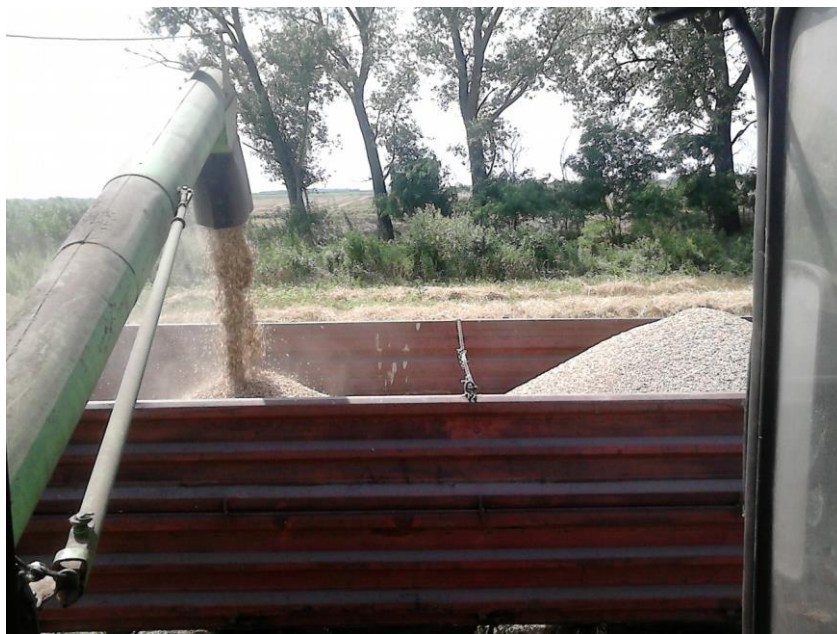
Slika 11. Pražnjenje bunkera kombajna

ovlaštenom laboratoriju u Austriji, te je utovaren, izvagan i odvezen. Ukupna količina požnjevenog zrna pira iznosila je 105 tona ili prosječno 2,625 t/ha. Ovaj prinos je u skladu s prosječnim prinosima nekoliko kultivara pira, koji su zabilježeni u Vojvodini 2014. godine od 2,20-2,84 t/ha ( www.polj.savetodavstvo.vojvodina.gov.rs/node/4670 ), ali slabiji od onoga kojeg navode Mlinar i Ikić (2012.) u dvogodišnjim pokusima na četiri lokacije od 5,002 t/ha. Ugrenović (2013.) navodi prinos pira od 3,46 t/ha sjetvom početkom listopada, ali i smanjenje prinosa za 4% odnosno 19,7% sjetvom krajem listopada odnosno sredinom studenog. Tako da je na prinos zrna pira od 2,625 t/ha vjerojatno najviše utjecala odgođena sjetva (od kraja studenog do početka siječnja sljedeće godine).