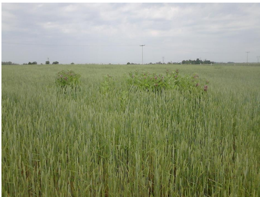
Slika 7. Korov svilenica

Pred kraj sazrijevanja se pojavila svilenica ( Asclepias syriaca L.) koja je mjestimično izbila kroz usjev, uglavnom na mjestima gdje je ležala voda i prorijedila pir (Slika 7.), no nije zadala veće probleme.