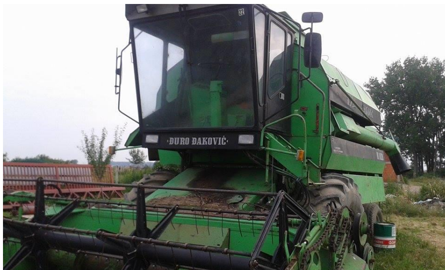
Slika 9. Kombajn Đuro Đaković M1620