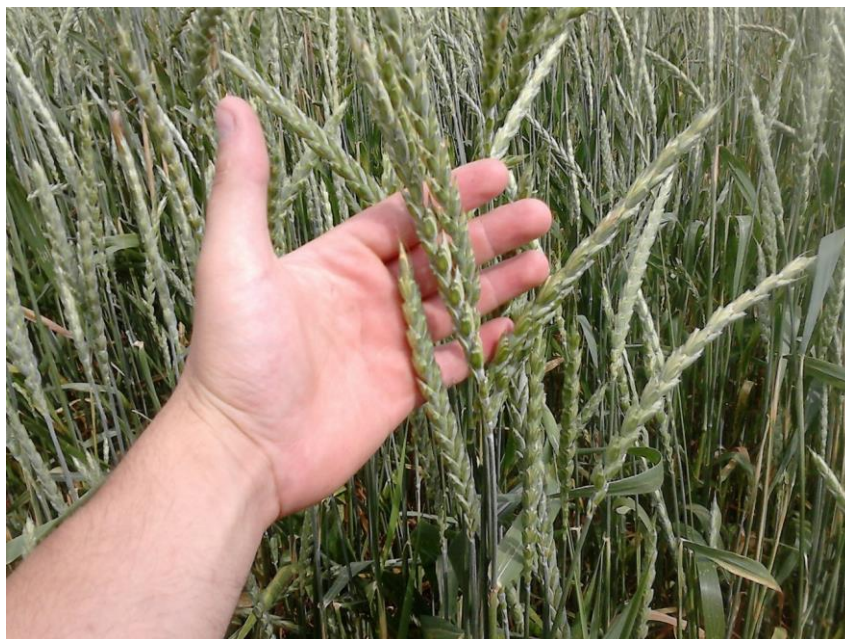
Slika 1. Klasovi pira