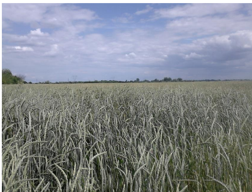
Slika 4. Polje pira

inozemstvom. Godine 2013. potpisuje prvu ugovorenu proizvodnju s njemačkom kompanijom „Natur Gold Farms“ sa sjedištem u Mađarskoj. Potpisani su ugovori za ekološki pir, ekološku soju i ekološki visokooleinski suncokret. Poslovanjem s inozemstvom obrt doživljava ekonomski oporavak te dobija visokovrijedne ekonomske i agrotehničke savjete stručnjaka i poslovnih partnera. Na slici 2. prikazana je površina obrta „Klica“ na kojoj se uzgaja pir. Danas obrt „Klica“ u svom vlasništvu ima 30 ha obradivih površina, dva traktora marke John Deere snaga 90 i 180 KS, žitni kombajn Đuro Đaković M1620, radionicu s garažom, halu za skladištenje strojeva i uroda u izgradnji te svu potrebnu mehanizaciju za obradu, sjetvu, zaštitu i transport. Na slici 4. prikazano je polje pira obrta „Klica“. Obrt nastoji primjenjivati najsuvremeniju tehnologiju u proizvodnji ekološke hrane te ima u planu izgraditi skladišta i razviti preradu u suradnji s poslovnim partnerima.