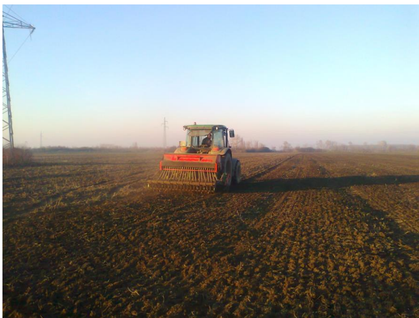
Slika 5. Traktor John Deere 5820 i sijačica „Rotosem“ u sjetvi pira

Optimalni agrotehnički rok za sjetvu pira u Europi je mjesec listopad. Sjetvom u tom mjesecu se dobivaju snažne biljke koje lako prezime, dobro se izbusaju i daju najveće prinose. Sjetva na parcelama obrta „Klica“ je obavljena znatno kasnije zbog kasne isporuke sjemena te loših vremenskih prilika. Sjeme je isporučeno sredinom studenog, a 20. tog mjeseca su posijane prve parcele na kojima je predusjev bila soja. Nakon toga uslijed loših vremenskih prilika i Božićnih blagdana ostatak parcela je posijan u prvoj trećini prosinca i jedan dio u siječnju sljedeće godine.