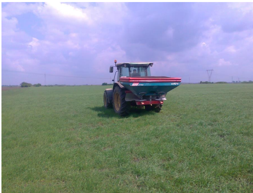
Slika 6. Traktor John Deere 5820 i rasipač Sulky u prihrani pira