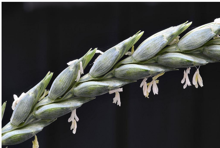
Slika 2. Klasići s peludnicama