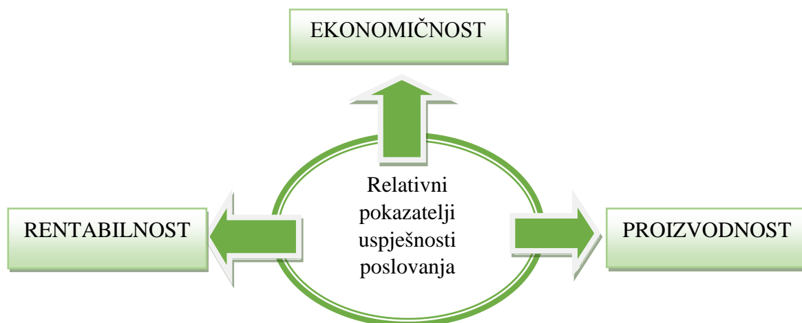
Slika 1. Relativni pokazatelji uspješnosti poslovanja

Relativni pokazatelji uspješnosti poslovanja su: