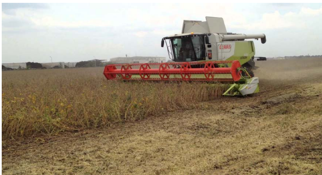
Slika 9. Žetva soje

Važna je dobra poravnatost tla i visina prve donje mahune. Optimalna žetvena vlažnost zrna soje je između 14 i 16%, ali bilo bih poželjno da bude ispod 13% da se izbjegnu troškovi sušenja.