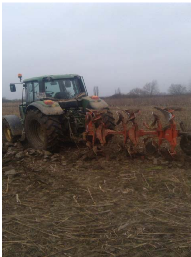
Slika 3. Osnovna obrada (oranje)

Osnovna ili primarna obrada tla, kao što sama riječ govori, obrada je do dubine u kojoj će se razvijati najveća masa rizosfere, kako bi se tlo prorahlilo, omogućila gnojidba ili stvorili uvjeti za podizanje višegodišnjih nasada.