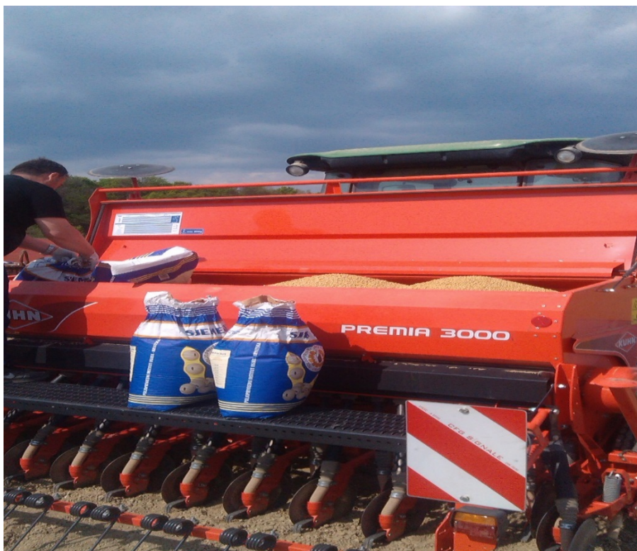
Slika 7. Punjenje sijačice sojom