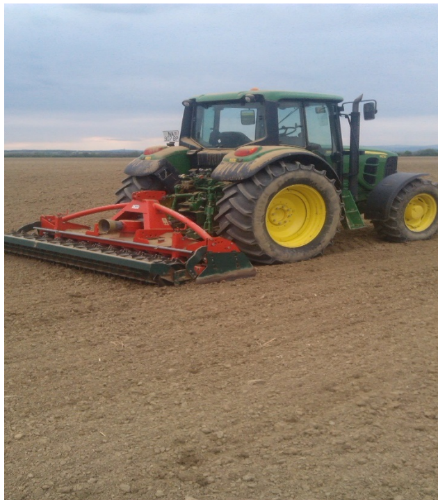
Slika 4. Dopunska obrada (rotodrljača)

Može se obaviti po golom tlu, pa tako omogućuje pripremu sjetvenog sloja ili sjetvene posteljice i sjetvu, a kako se tlo obrađuje poslije sjetve i nicanja, kao i u višegodišnjim nasadima, služi za rahljenje površinskog sloja tla, uništavanje korova u međurednom prostoru i unošenje gnojiva. Zahvati dopunske obrade tla dijele se na: blanjanje, tanjuranje i kultiviranje.