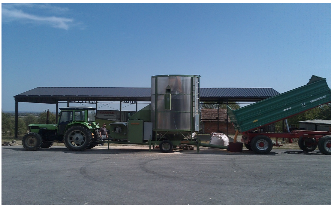
Slika 10. Sušenje soje

U prošloj godini zbog vrlo povoljnog omjera oborina tokom cijele vegetacije postignut je vrlo dobar prinos, jedini nedostatak je učestali trend oborina i oblačnog vremena bez sunca, bilo je otežano otpuštanje vlage iz zrna tako da je žetva trajala 10 radnih dana, a i dio uroda je skidan sa 15-16% vlage pa smo morali sušiti a i samim time povećavali troškove, ali uzevši povoljne uvjete tijekom cijele vegetacije ostvarili smo vrlo dobar prinos od 3,5 t/ha, što je više za oko 500 kg/ha od prosjeka na našem obrtu. Ostatak uroda zadnjih dana žetve skidali smo sa 10-12% vlage, što je dodatno pridonijelo boljem finansijskom rezultatu, jer nije bilo potrebe za sušenjem.