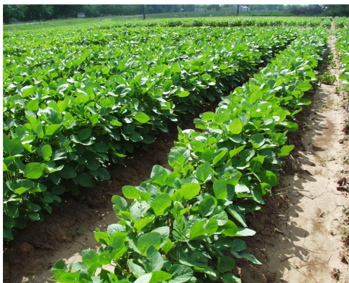
Slika 2. Soja koja ima dovoljno vlage

Velike količine oborina u cvatnji dovode do opadanja velikog broja cvjetova. IZREKA: “ako su mahune mokre, a cvjetovi suhi, dobri su prinosi“.