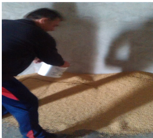
Slika 8. Nanošenje bakterija na soju prije sjetve

Bakterizaciju sjemena soje prije sjetve bakterijama Bradyrhizobium japonicum spp. Treba smatrati obaveznom i učinkovitim mjerom u tehnologiji proizvodnje soje. Posebno je značajna na tlima gdje ranije nije uzgajana soja ili nije sijana duže razdoblje. Unošenjem bakterija fiksatora dušika u tlo popravlja mu se struktura. Povećava se sadržaja bjelančevina u zrnju soje, štede se dušična gnojiva za slijedeću kulturu.