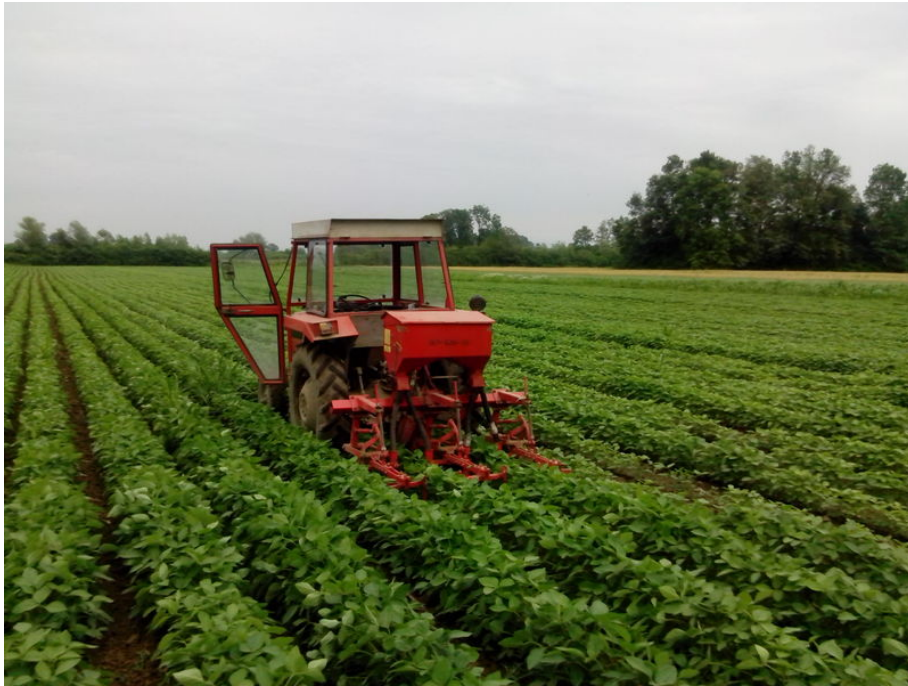
Slika 5. Kultivacija soje s prihranom (www. poljoprivredni-forum.com)

Dopunska odnosno predsjetvena priprema tla ima glavni zadatak pripremiti tlo za kvalitetnu sjetvu stoga joj treba pokloniti posebnu pažnju. Sjeme soje traži tvrdi postelju i meki pokrivač tj. dobar kontakt s vlagom u tlu iz dubljih slojeva i rastresiti sloj tla iznad koji sprječava gubitak vode iz tla. Dobro priređena, ravna i rastresita, dovoljno vlažna i topla površina osigurava kvalitetnu sjetvu na zadanu dubinu (4-6 cm) te brzo ujednačeno klijanje i nicanje sjemena, daljnje razviće soje i u konačnici visoke urode zrna.