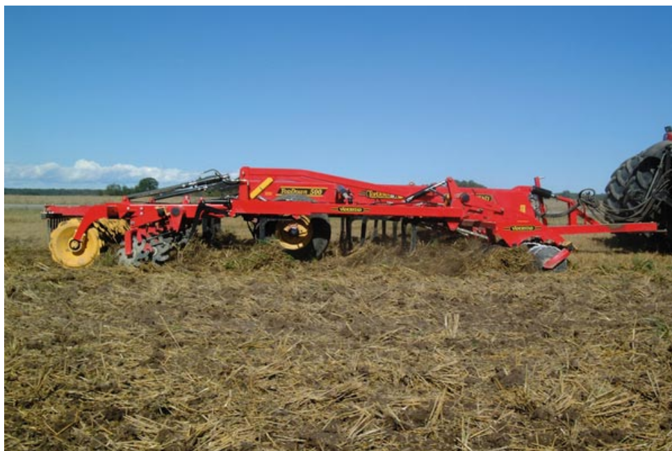
Slika 6. TopDown, stroj za reduciranu obradu tla ( http://www.vaderstad.com )

Prema višegodišnjim rezultatima pokusa izvedenih u 6 država prosječni urodi zrna soje za 20 sorata bili su gotovo identični za oba sistema sjetve i to: 48,4 bu/acre (3250 kg/ha) u sistemu bez obrade i 48,2 bu/acre (3240 kg/ha) u klasičnom sistemu obrade. Ispitivanje sorte soje nisu se razlikovale u urodu zrna u odnosu na sistem obrade tla.