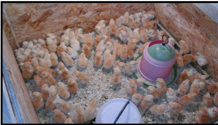
Slika 15. Kokoš hrvatica/pilići

http://mystart3.dealwif.com/search/images?fcoid=417&fcop=topnav&fpid=2&q=+doma%C4%87a+koko%C5%A1+hrvatica (20.2.2016.)