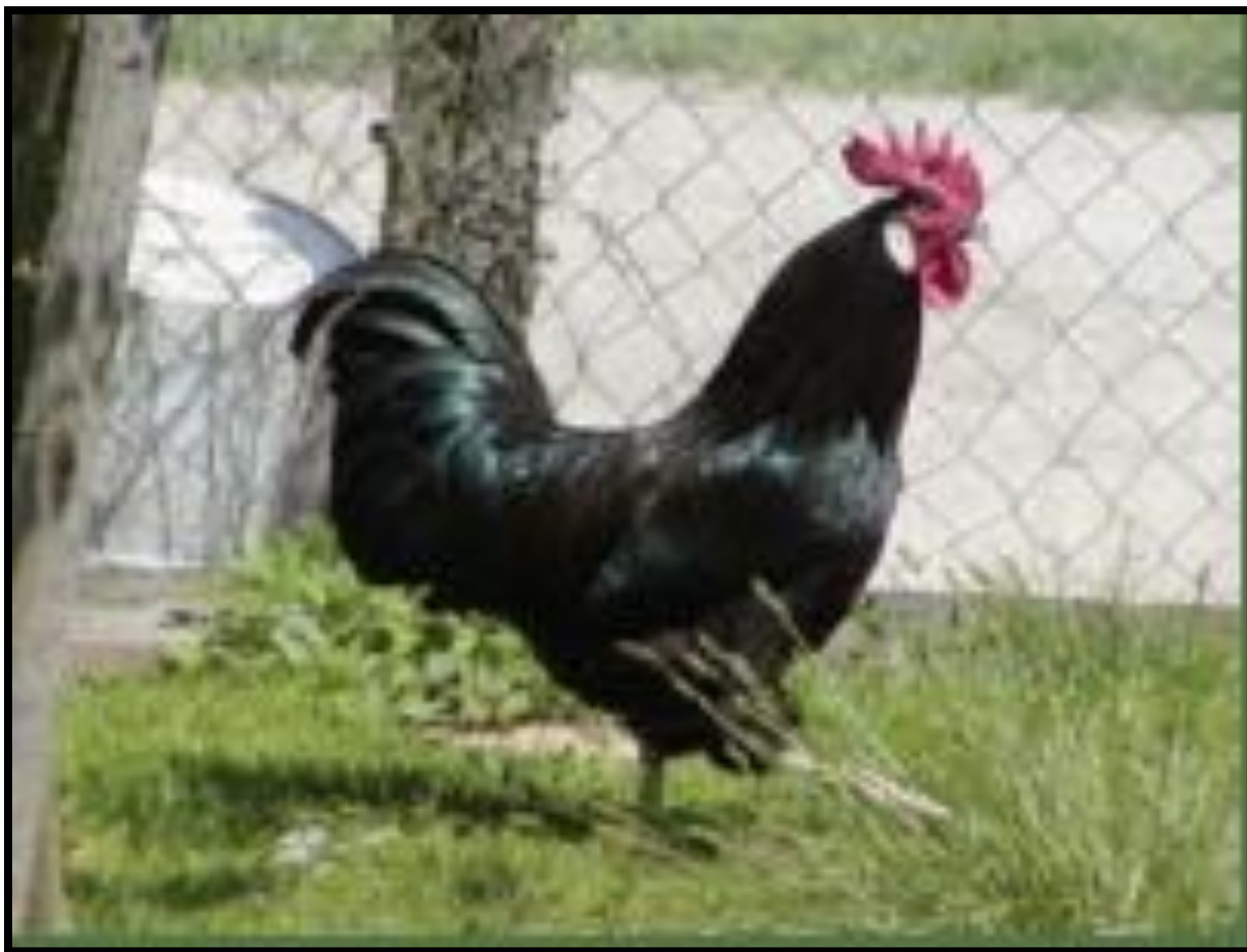
Slika 3. Kokoš hrvatica/crni soj

Razlikuje se od drugih sojeva po tome što su mu noge sivkaste boje dok ostalim sojevima su bijele boje. Također pijetao i kokoš ovog soja se ne razlikuju nego su potpuno iste boje.