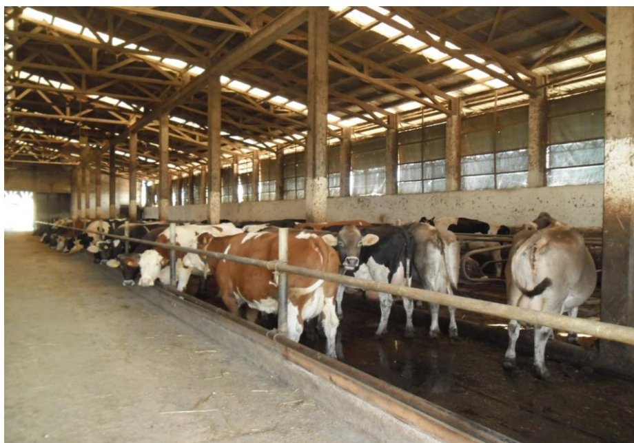
Slika 1. Slobodan način držanja krava