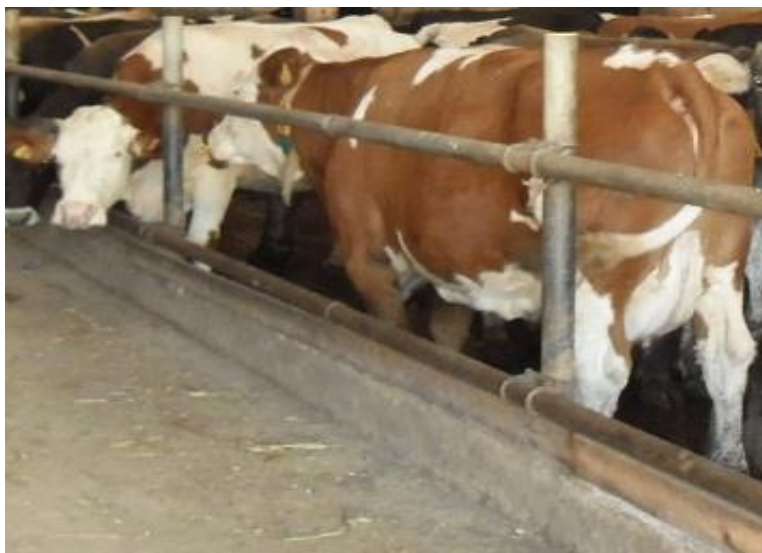
Slika 4. Pasmina Simentalac

Tjelesna masa krava je 600 - 750 kg, visine 136 - 140 cm. Prvi put se pripušta sa 16 mjeseci, a teli s 25 mjeseci. Porodna masa teladi je 40 - 45 kg. Proizvodni vijek u intenzivnom iskorištavanju traje 5 - 7 godina. Stoga je simentalska pasmina goveda računajući financijski najisplativija u dugoročnoj proizvodnji.