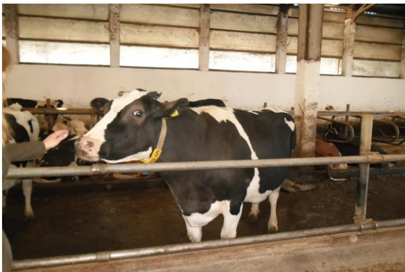
Slika 3. Pasmina Holstein

Za uzgoj ove pasmine krava potrebni su dobri uvjeti držanja i dobra hranidba kvalitetnom hranom. Ta pasmina je podložna bolestima kao što su jalovost, mastitis i visoki remont. Proizvodni vijek traje četiri godine. Proizvodnja mesa je slabija zbog ranijeg zamašćivanja, nižih prirasta i nižeg randmana u odnosu na pasminu simentalac.