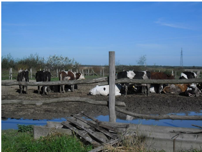
Slika 2. Slobodan način držanja krava na otvorenom