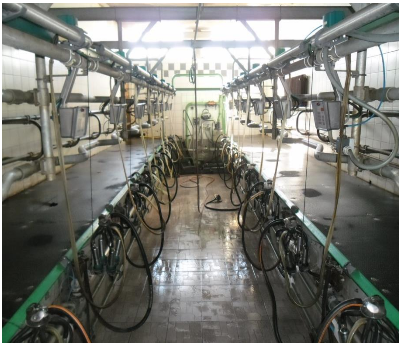
Slika 6. Izmuzište “riblja kost”

Na gospodarstvu koriste izmuzište na sistem “riblja kost”. Sistem se koristi 2x8 mjesta za krave. Prosječni učinak sa 2x8 mjesta iznosi oko 75 pomuženih krava/h. Fiksna izmuzišta namijenjena su i uglavnom pogodna za slobodni način držanja.