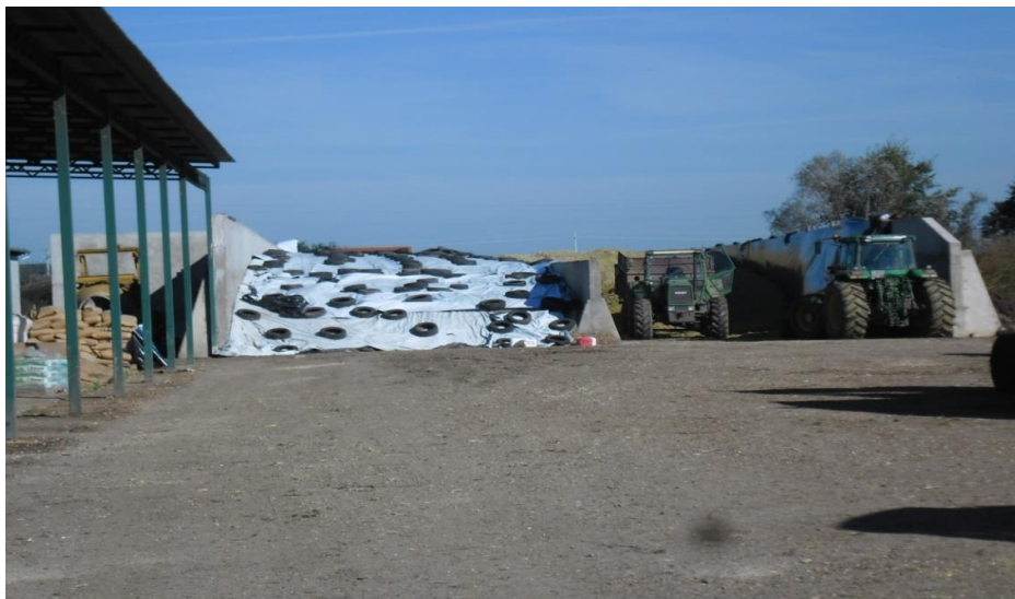
Slika 5. Silaža na poljoprivrednom gospodarstvu